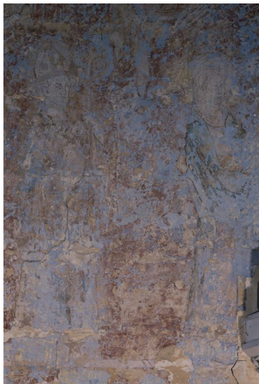
Détail de la partie gauche.