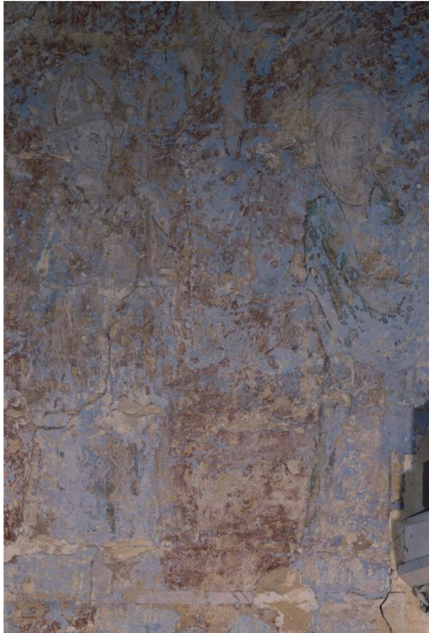
Détail de la partie gauche.