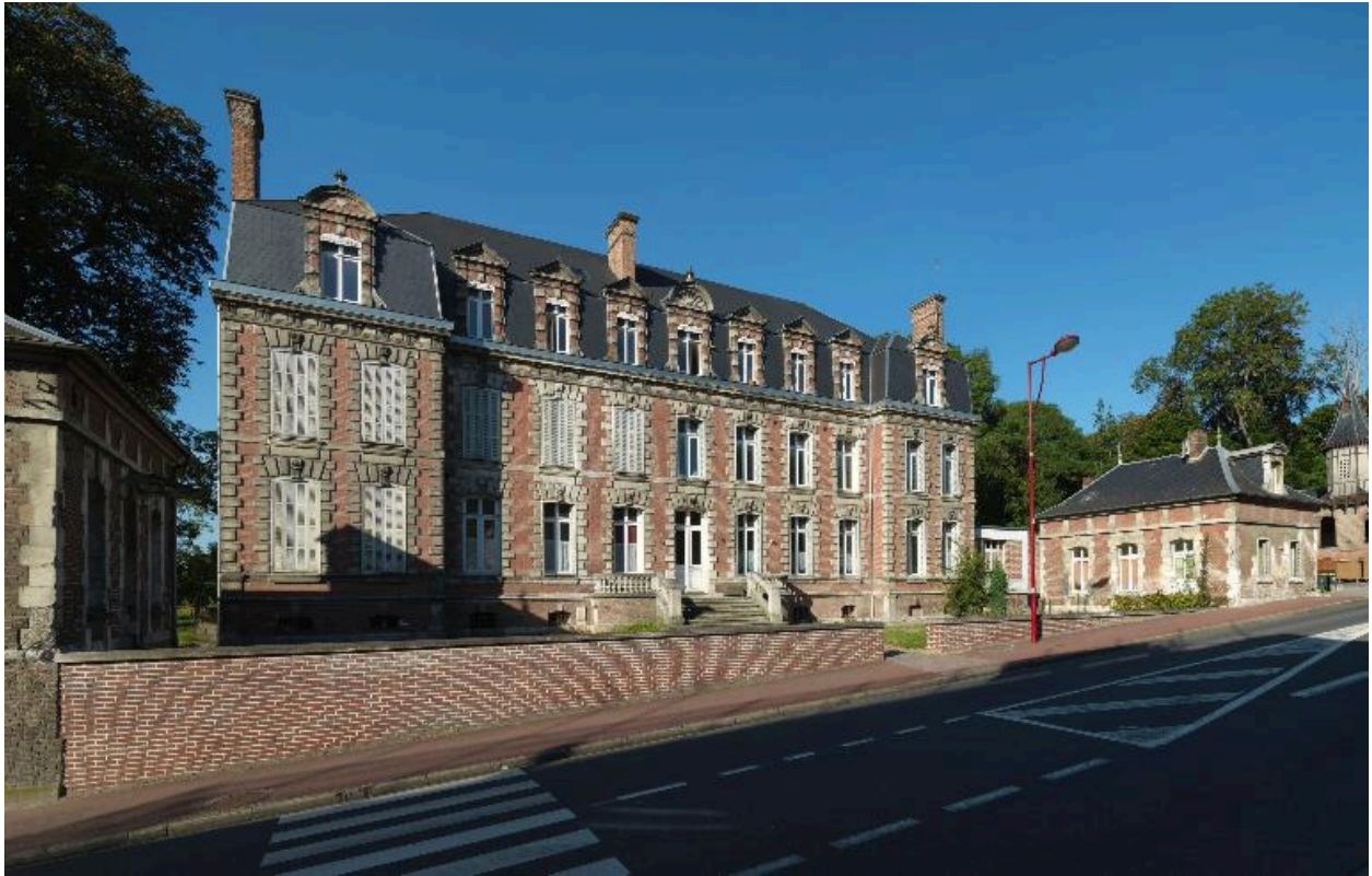
Flixecourt, demeure dite Château rouge, Paul Delefortrie architecte, 1875.