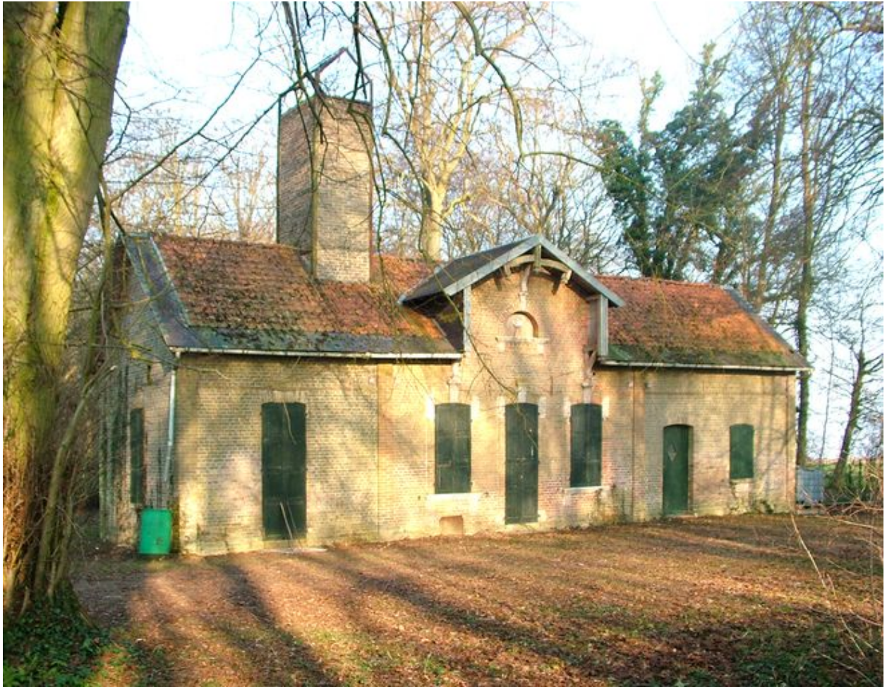
Bettencourt-Saint-Ouen, rendez-vous de chasse, dit châtlet de Bachimont, vers 1910.