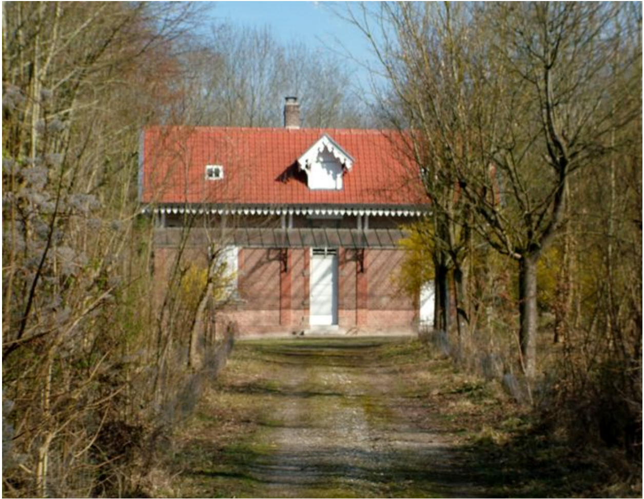
Bettencourt-Saint-Ouen, ancien chemin de l'Homme-mort. Maison forestière dite châlet Monpetit, vers 1910.