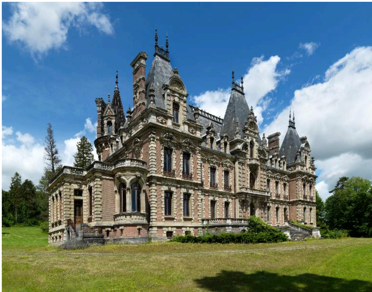
Flixecourt, demeure dite château de la Navette, Paul Delefortrie architecte, 1882.