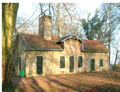
Bettencourt-Saint-Ouen, rendez-vous de chasse, dit châtelet de Bachimont, vers 1910.