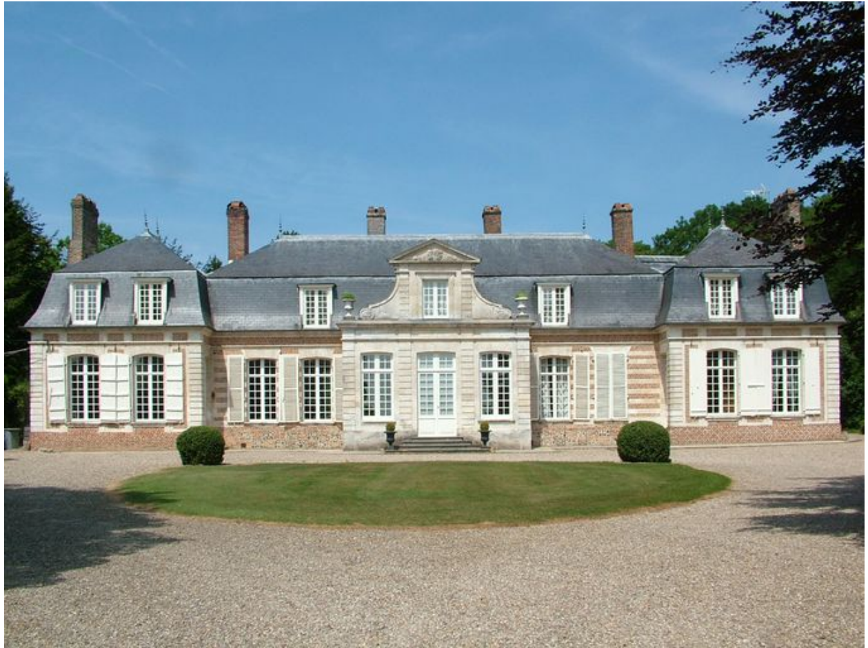
Fransu, château, 3e quart du 18e siècle et 2e quart du 19e siècle.