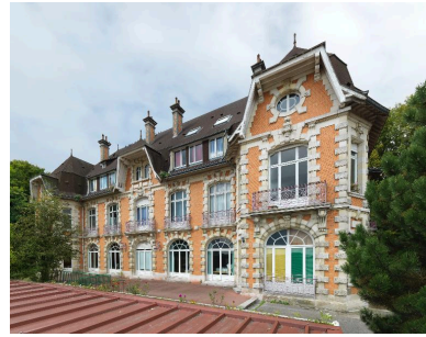
Ville-le-Marcelet, demeure dite château, vers 1920. IVR22_20128000851NUC2AQ