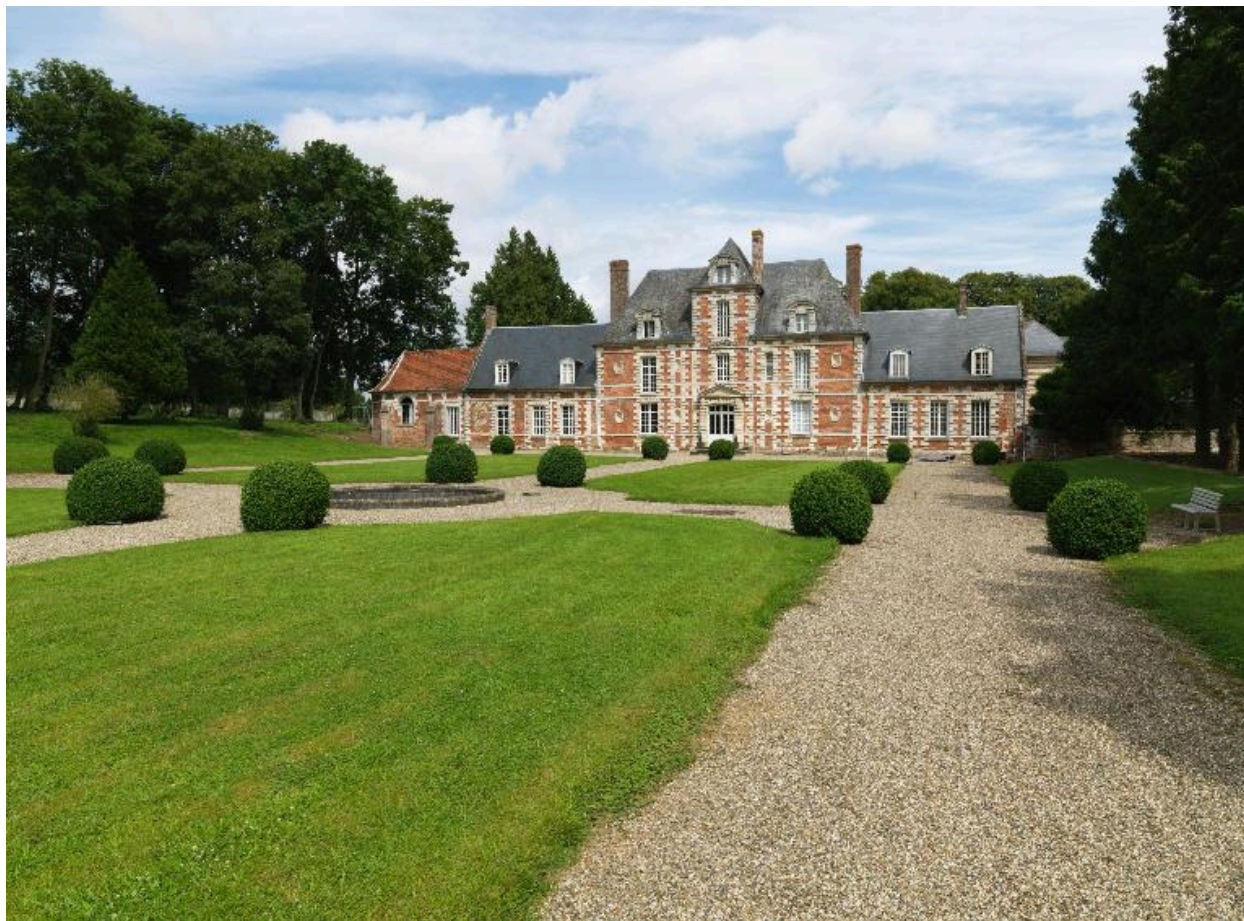
Vauchelles-lès-Domart, château, 2e quart du 17e siècle.