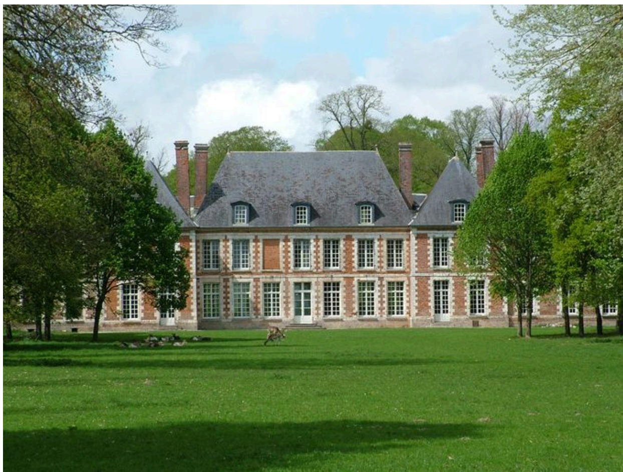
Ribeaucourt, château, milieu du 17e siècle.