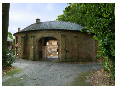
Flixecourt, communs de la demeure dite château Hesse, 1865. IVR22_20128000843NUC2A