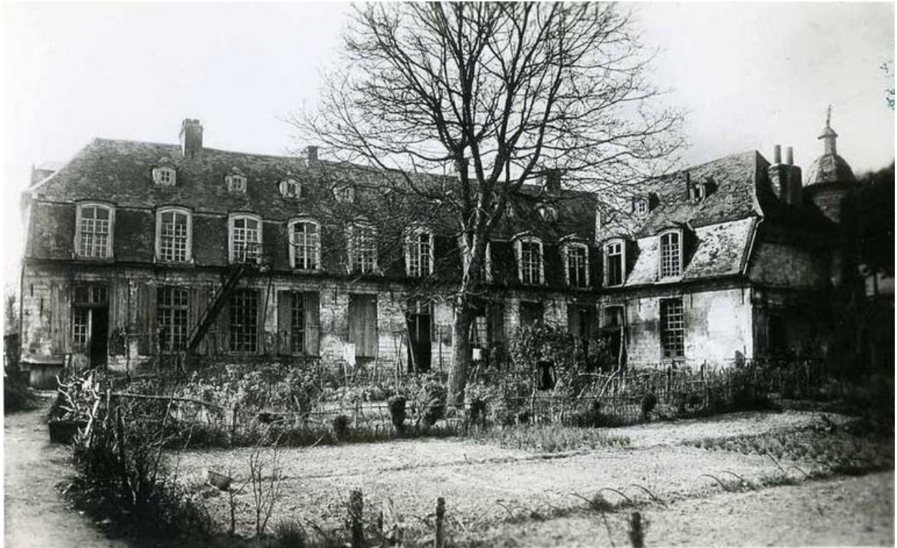
L'Étoile, ancien château, 18e siècle (coll. part.)