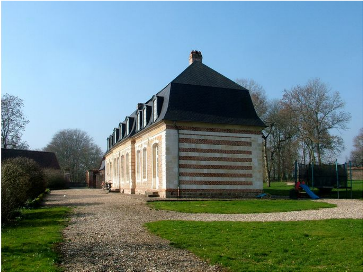
Fransu, château de Houdencourt, 3e quart du 18e siècle.