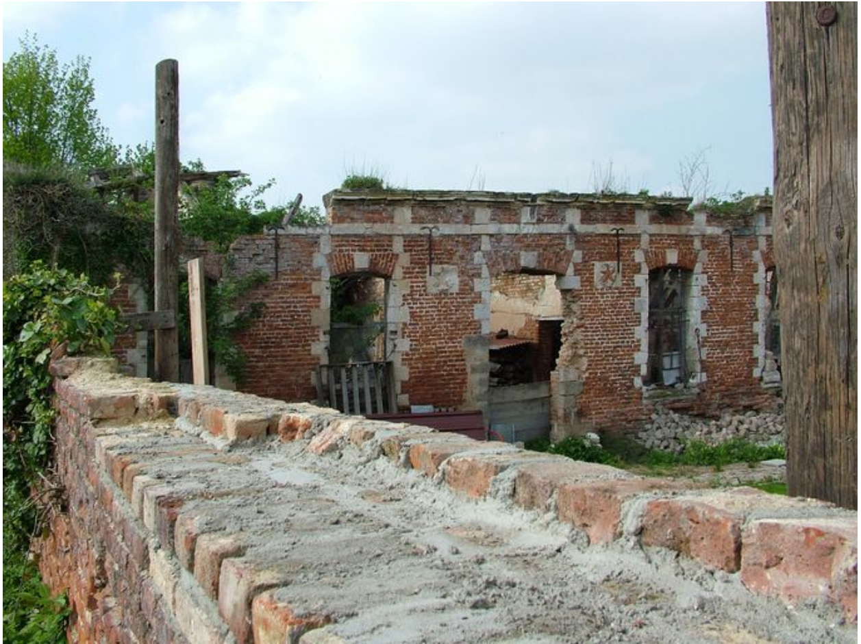
Bettencourt-Saint-Ouen, ancien château, 1777.