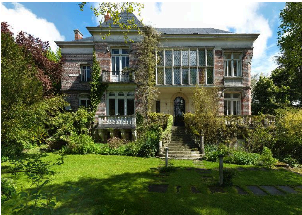
Beauval, demeure d'industriel dite villa Sueur, Anatole Bienaimé architecte, vers 1900, et Pierre Herdebaut architecte, 1960.