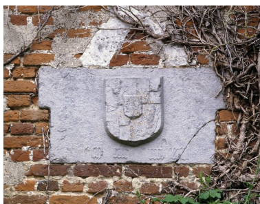
Bettencourt-Saint-Ouen, dalle armoriée portant la date de 1488 (?) et provenant probablement du premier château fort.