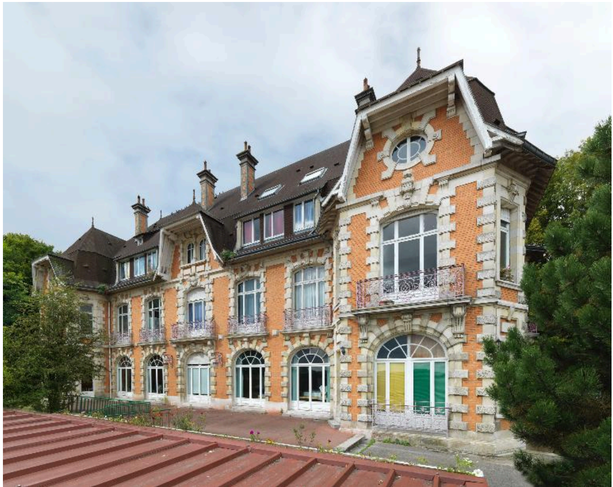
Ville-le-Marcelet, demeure dite château, vers 1920.