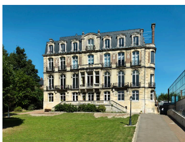
Flixecourt, demeure dite Château blanc, 1912.