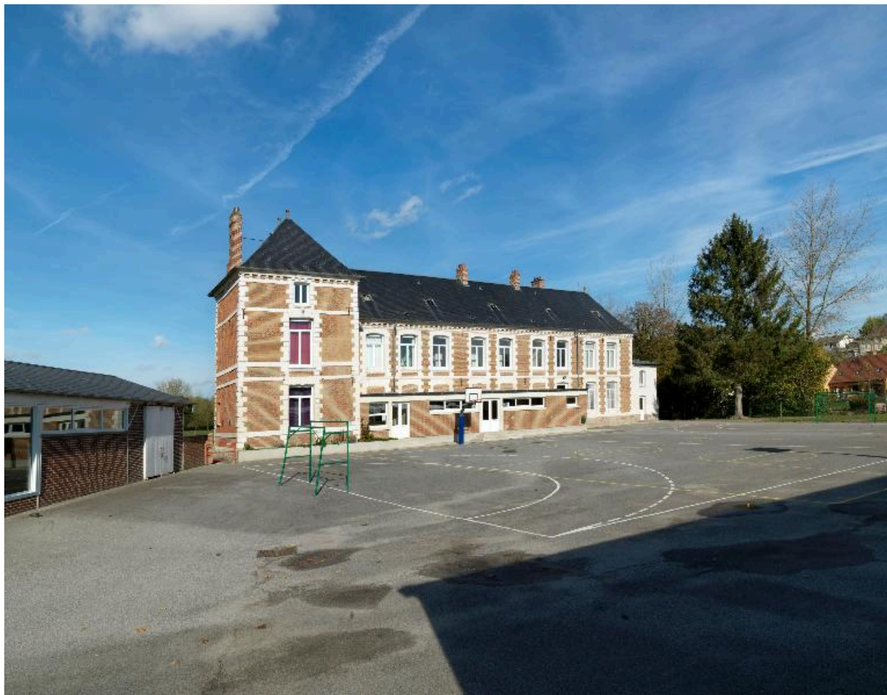
Saint-Léger-lès-Domart, ancien château, 1632 puis début du 18e siècle (agrandissement).