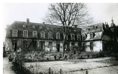
L'Étoile, ancien château, 18e siècle (coll. part.) IVR22_20108002106NUCA