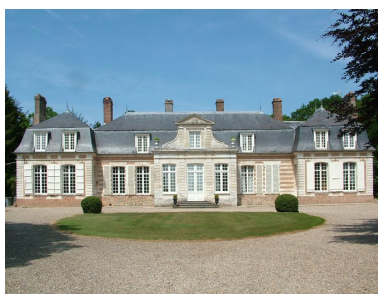
Fransu, château, 3e quart du 18e siècle et 2e quart du 19e siècle. IVR22_20108001909NUCA