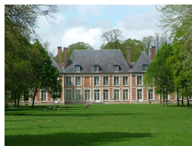
Ribeaucourt, château, milieu du 17e siècle.