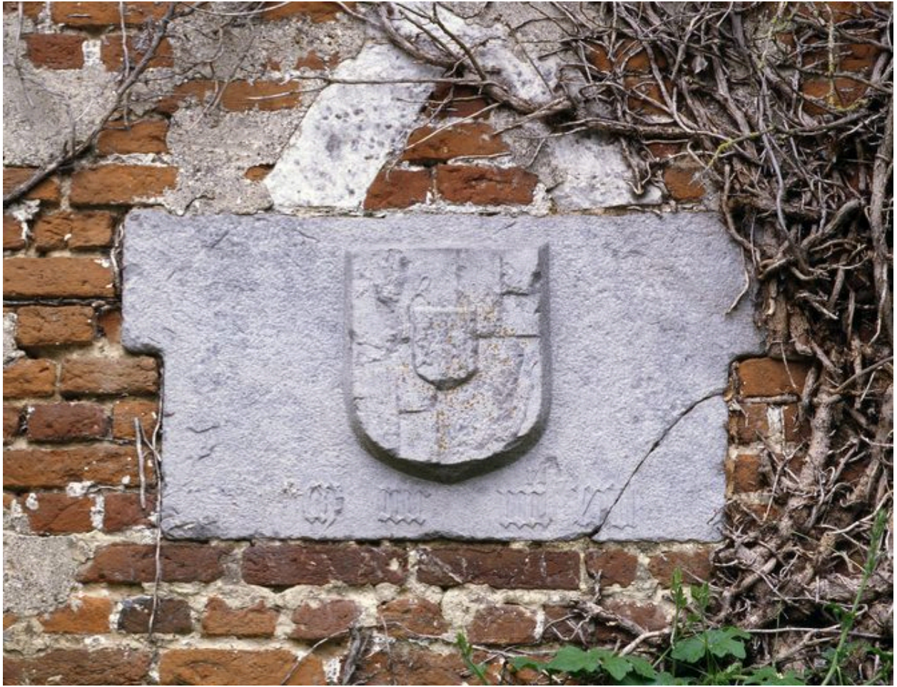
Bettencourt-Saint-Ouen, dalle armoriée portant la date de 1488 (?) et provenant probablement du premier château fort.