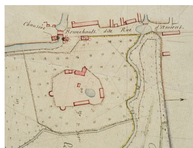
Saint-Ouen, ancien château, détail du plan cadastral de 1832, section A3 (AD Somme; 3P 1470/"). IVR22_20088000117NUCA