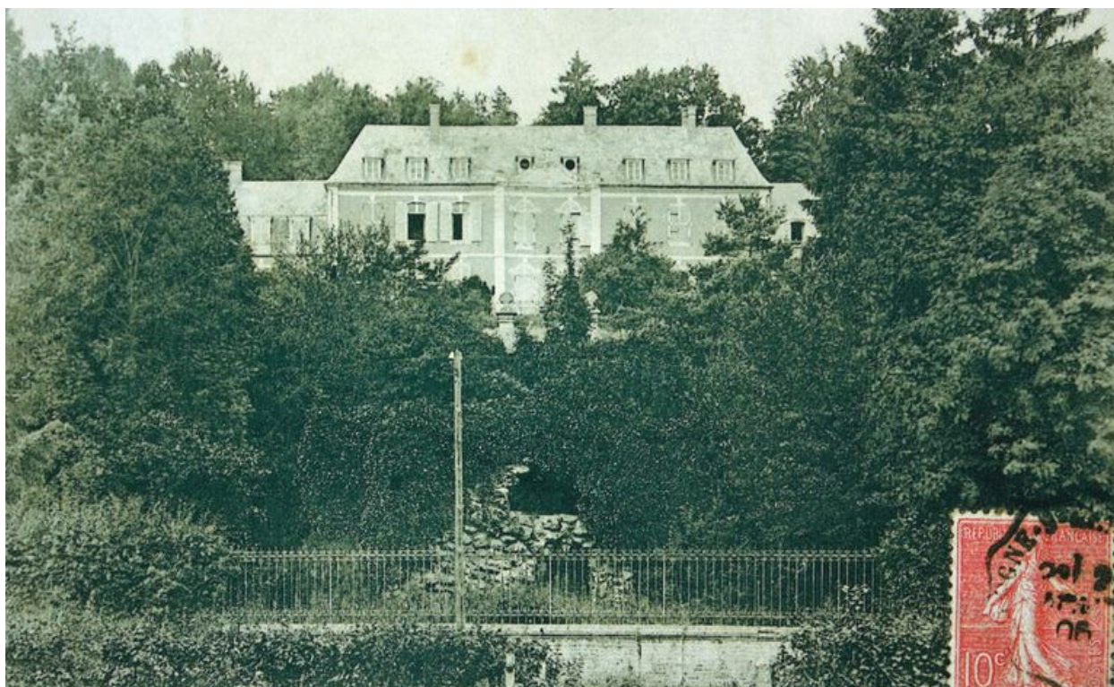
Ville-le-Marclet, ancien château, 1755 (coll. part.).