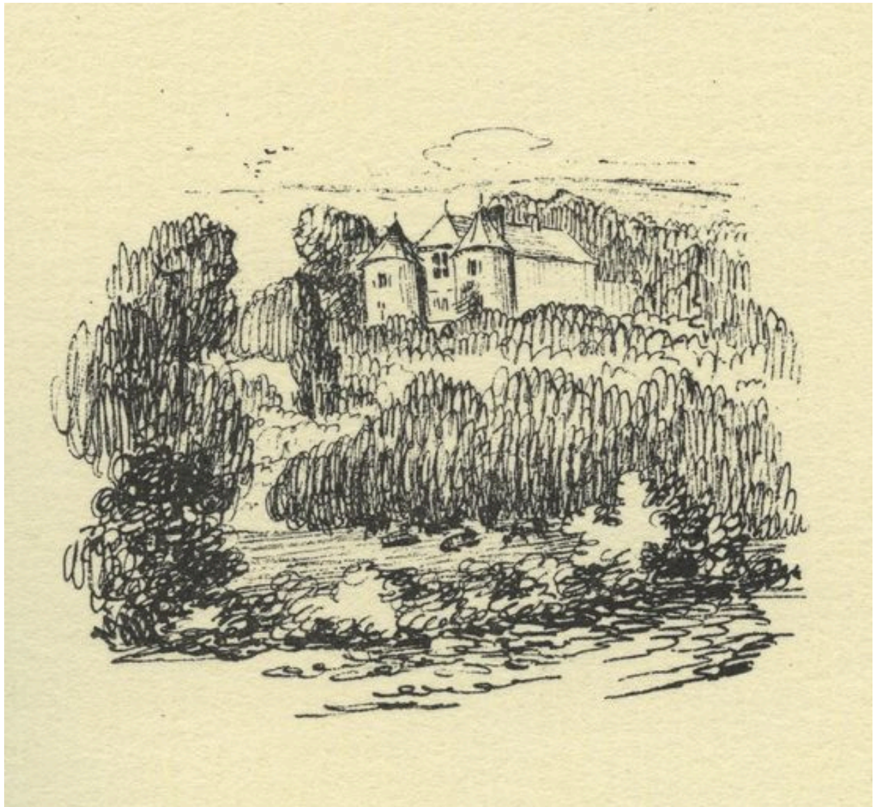
Pernois, ancien manoir des évêques d'Amiens, 3e quart du 16e siècle (Quelques cantons de Picardie).