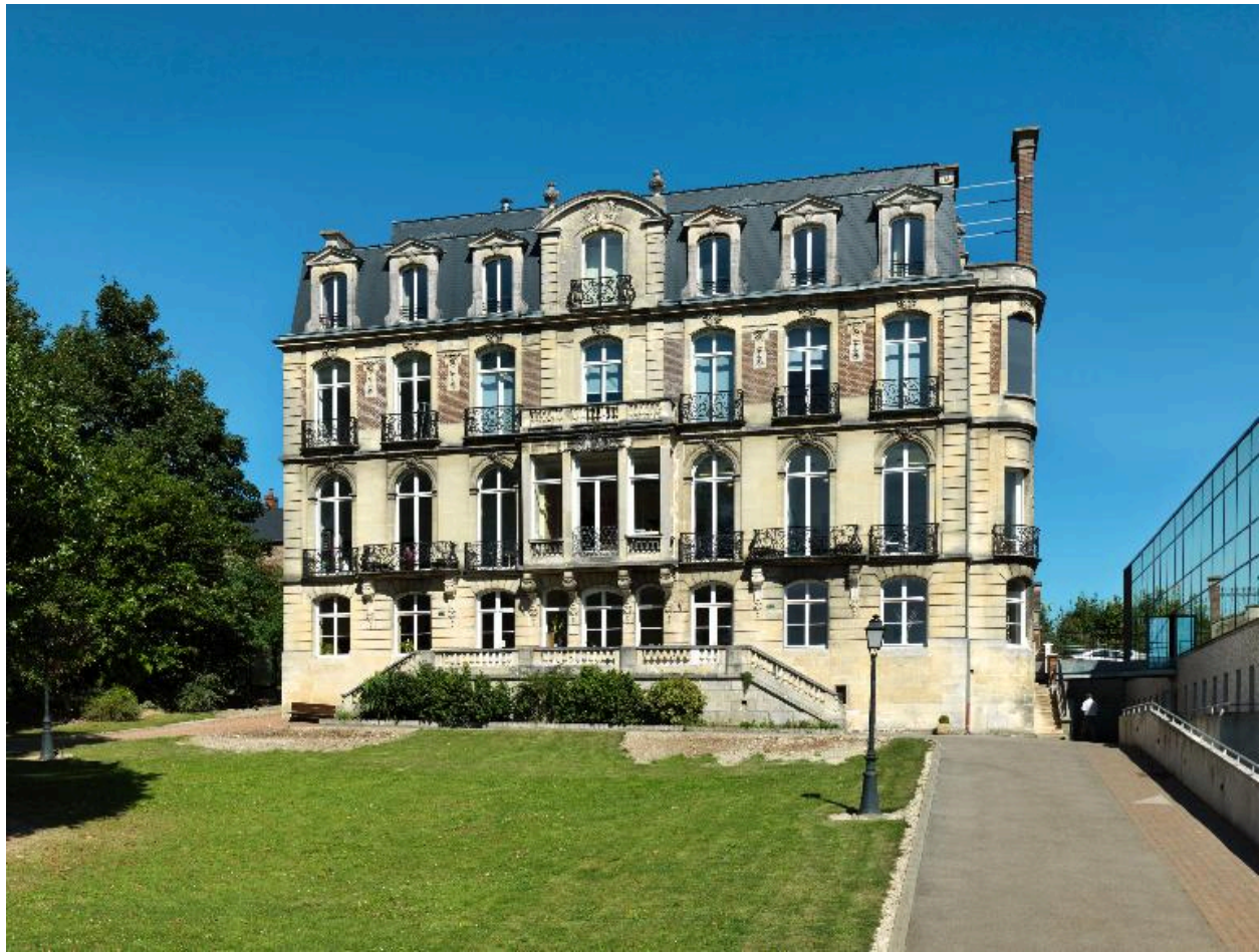
Flixecourt, demeure dite Château blanc, 1912.