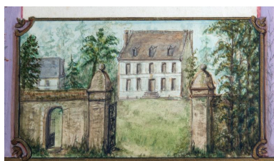
Havernas, manoir, aquarelle du début du 19e siècle (archives privées).