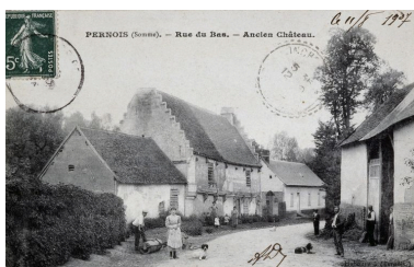
Pernois, ancien manoir dit Petit Château, 16e siècle (coll. part.). IVR22_20108000079XA