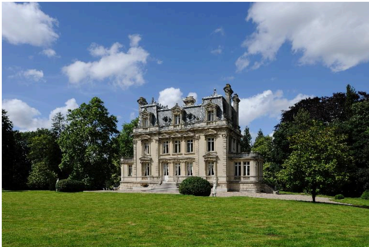
Canaples, demeure dite château, Anatloe Bienaimé architecte, 1898.