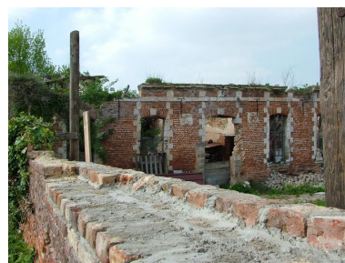
Bettencourt-Saint-Ouen, ancien château, 1777. IVR22_20098005203NUCA