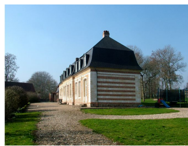
Fransu, château de Houdencourt, 3e quart du 18e siècle. IVR22_20118001065NUCA