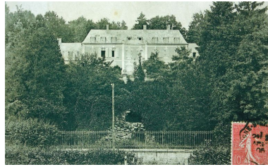
Ville-le-Marcelet, ancien château, 1755 (coll. part.). IVR22_20098005030NUCA