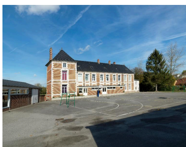
Saint-Léger-lès-Domart, ancien château, 1632 puis début du 18e siècle (agrandissement). IVR22_20128001026NUC2A