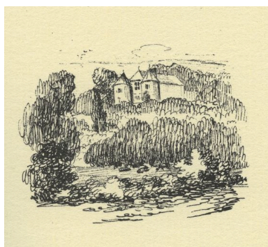
Pernois, ancien manoir des évêques d'Amiens, 3e quart du 16e siècle (Quelques cantons de Picardie). IVR22_20108000011NUCA