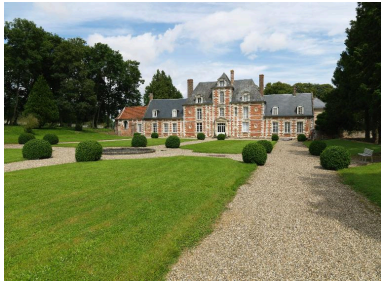
Vauchelles-lès-Domart, château, 2e quart du 17e siècle. IVR22_20128000772NUC2A