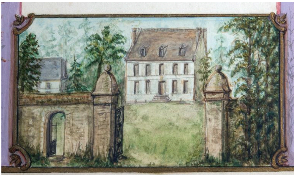
Havernas, manoir, aquarelle du début du 19e siècle (archives privées).