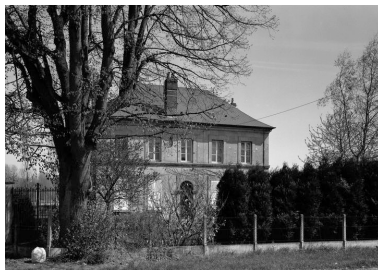
Elévation antérieure. IVR22_19856000572X