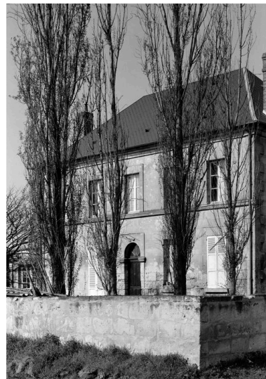
Elévation postérieure. IVR22_19856000573X