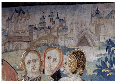
Détail des trois dames à droite et de la ville en arrière-plan.