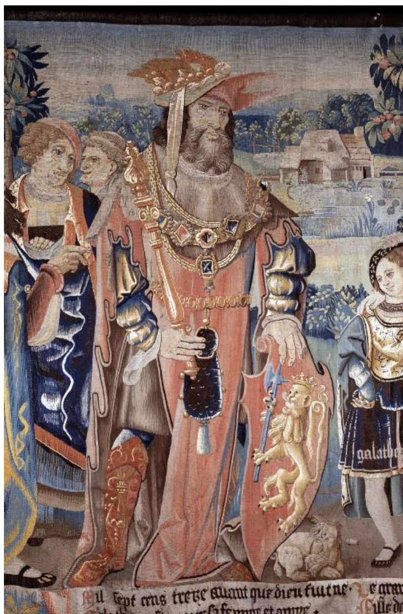
Détail d'Hercule et de ses armes, à gauche de la tapisserie.