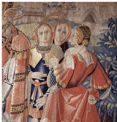
Détail des trois dames, à droite de la tapisserie. IVR22_19966003416XA