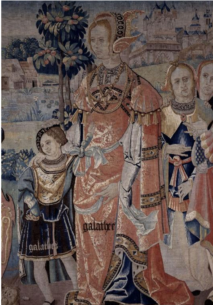
Détail de Galathée et de son fils Galathès, à droite de la tapisserie.