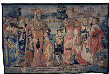
Vue d'ensemble. IVR22_19966003414VA