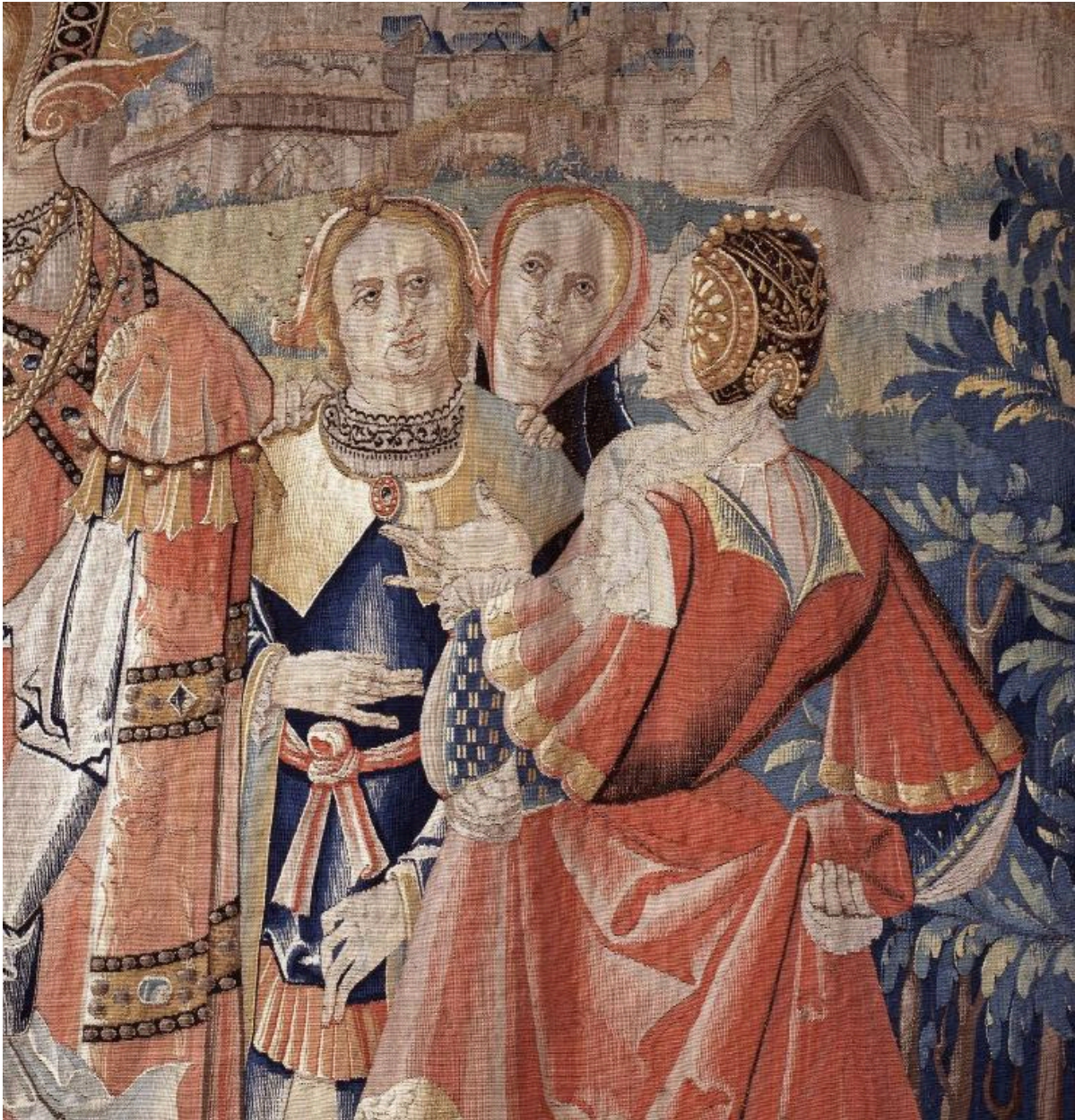
Détail des trois dames, à droite de la tapisserie.