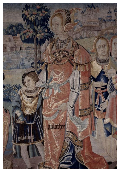
Détail de Galathée et de son fils Galathès, à droite de la tapisserie.