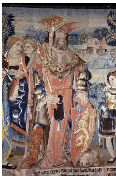
Détail d'Hercule et de ses armes, à gauche de la tapisserie. IVR22_19966003417XA