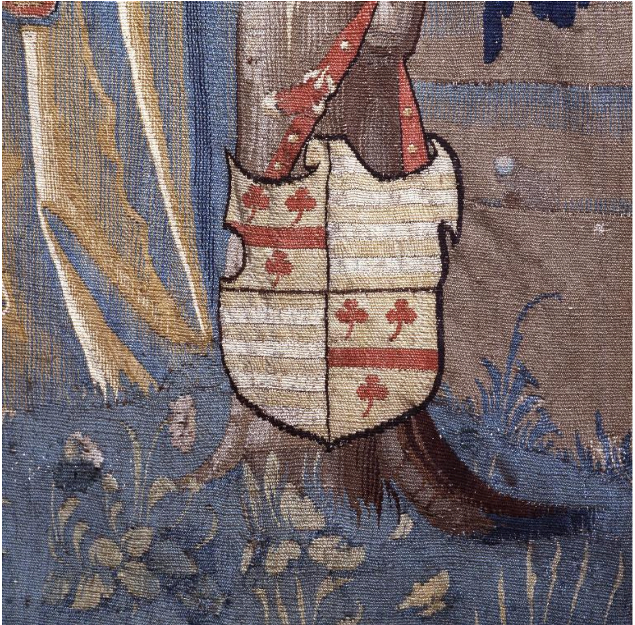
Détail des armes de Nicolas d'Argillières.