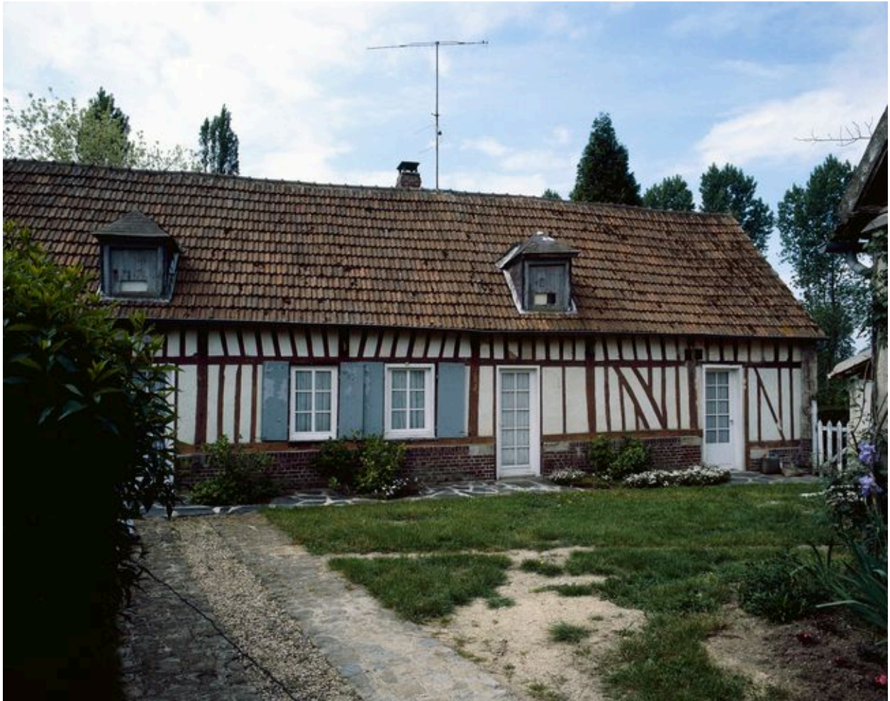
Logis. Elévation antérieure.