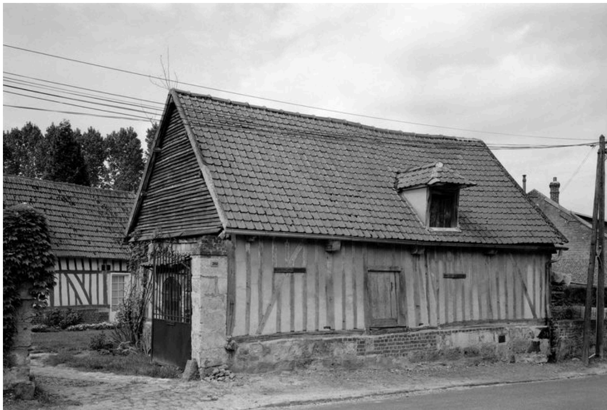
Grange. Elévation sur rue.