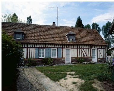
Logis. Elévation antérieure. IVR22_19856000723XA