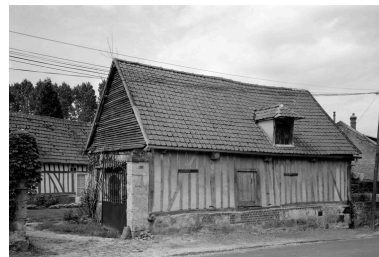
Grange. Elévation sur rue.