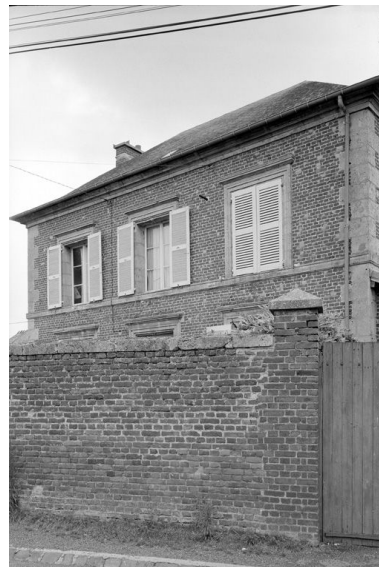
Elévation antérieure. IVR22_19846000958X