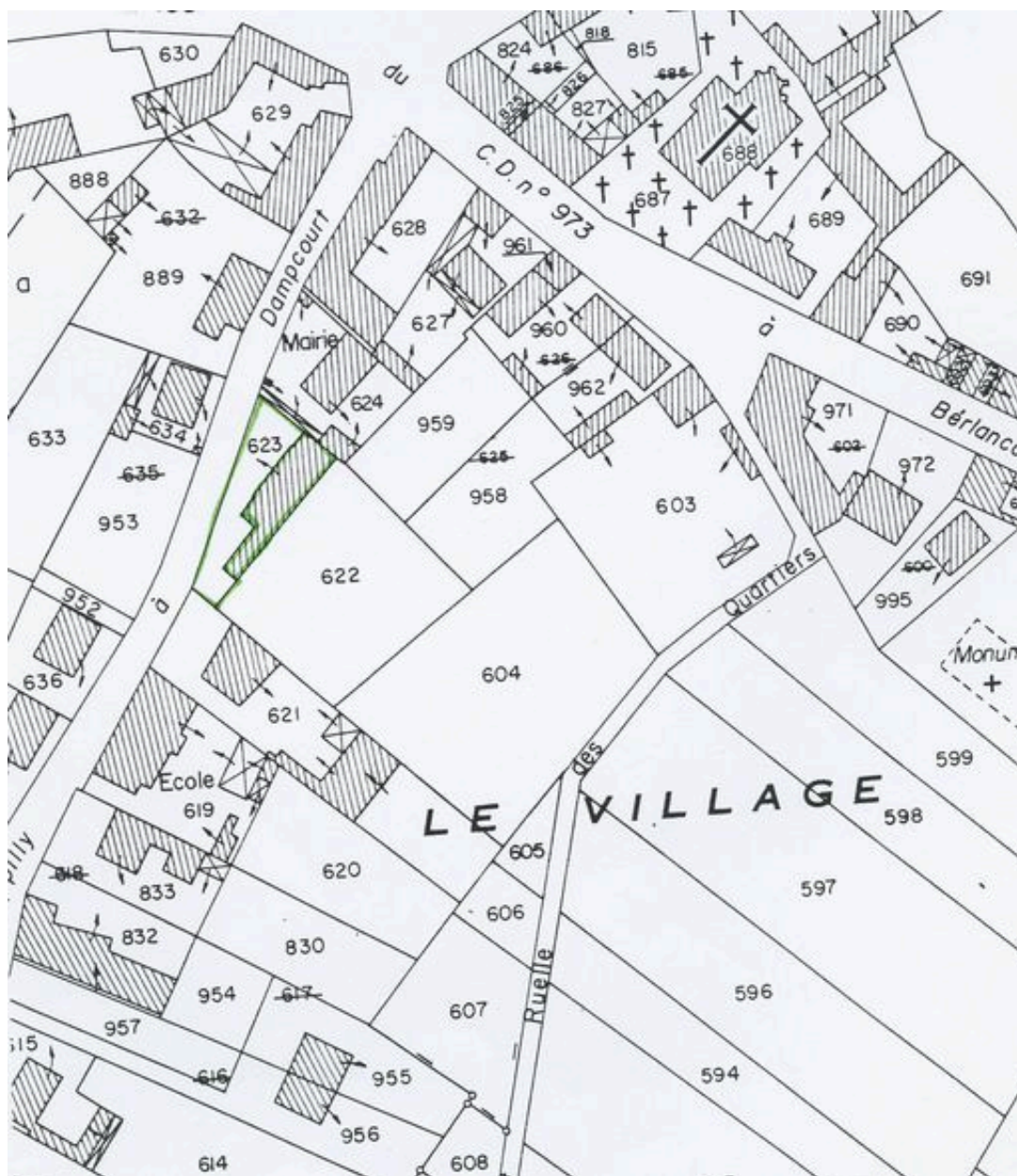
Plan de situation. Extrait du plan cadastral de 1982, section A5 623.