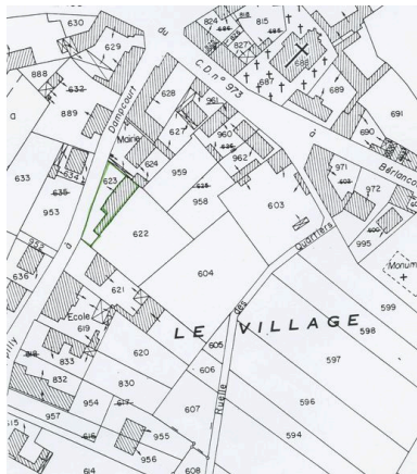
Plan de situation. Extrait du plan cadastral de 1982, section A5 623. IVR22_2009600008NUCA