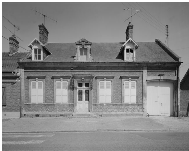
Elévation antérieure. IVR22_19856000574V

Plan de situation. Extrait du plan cadastral de 1982, section A4 381. IVR22_20096000271NUCA