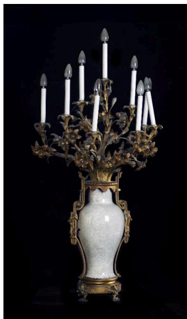
Vue générale de l'un des chandeliers.

IVR22_19920202353VA