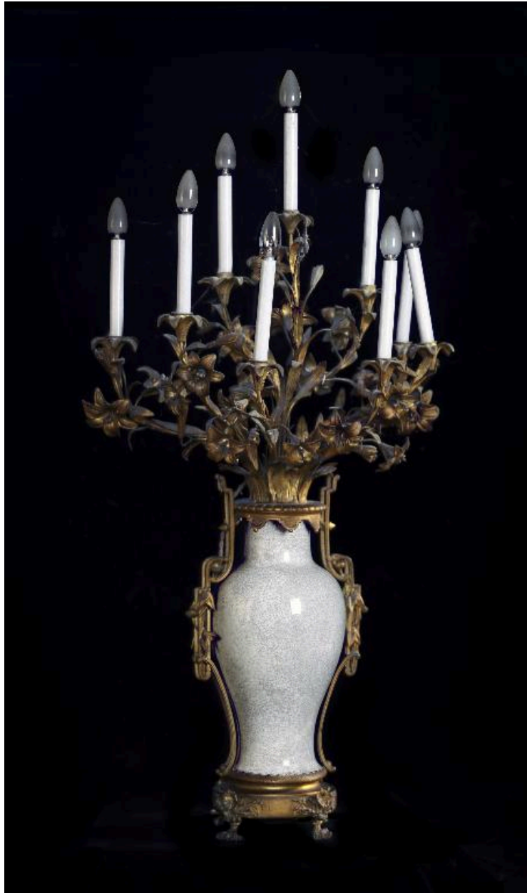
Vue générale de l'un des chandeliers.