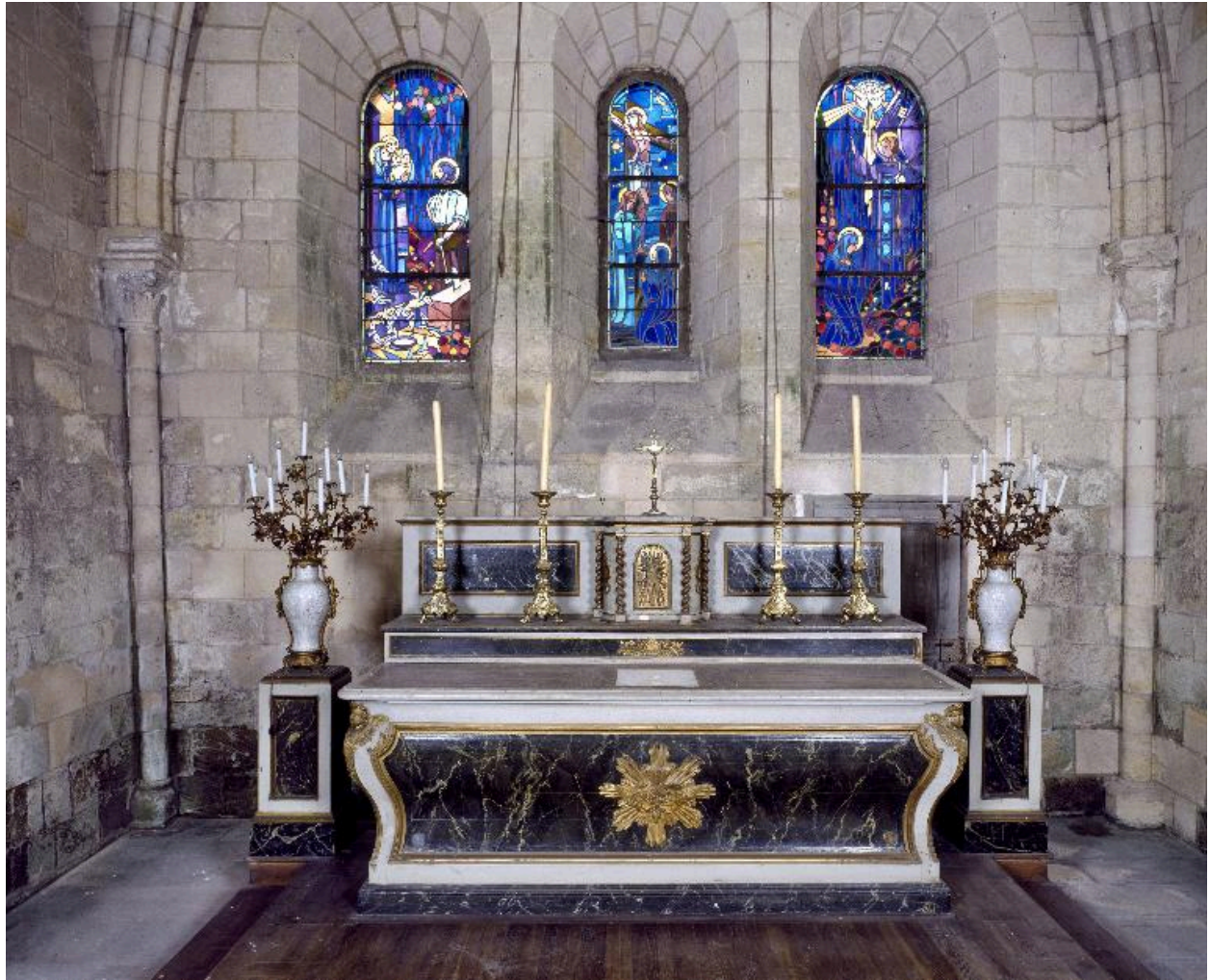
Vue des deux chandeliers, de part et d'autre du maître-autel.