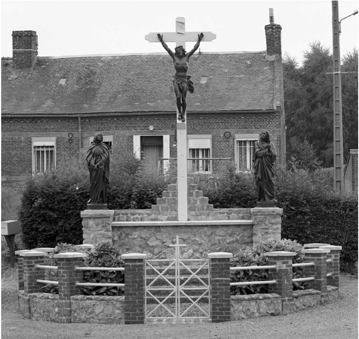
Rue de la Laiterie, rue de Bergues : calvaire composé de statues provenant de l'Union artistique de Vaucouleurs (1954).