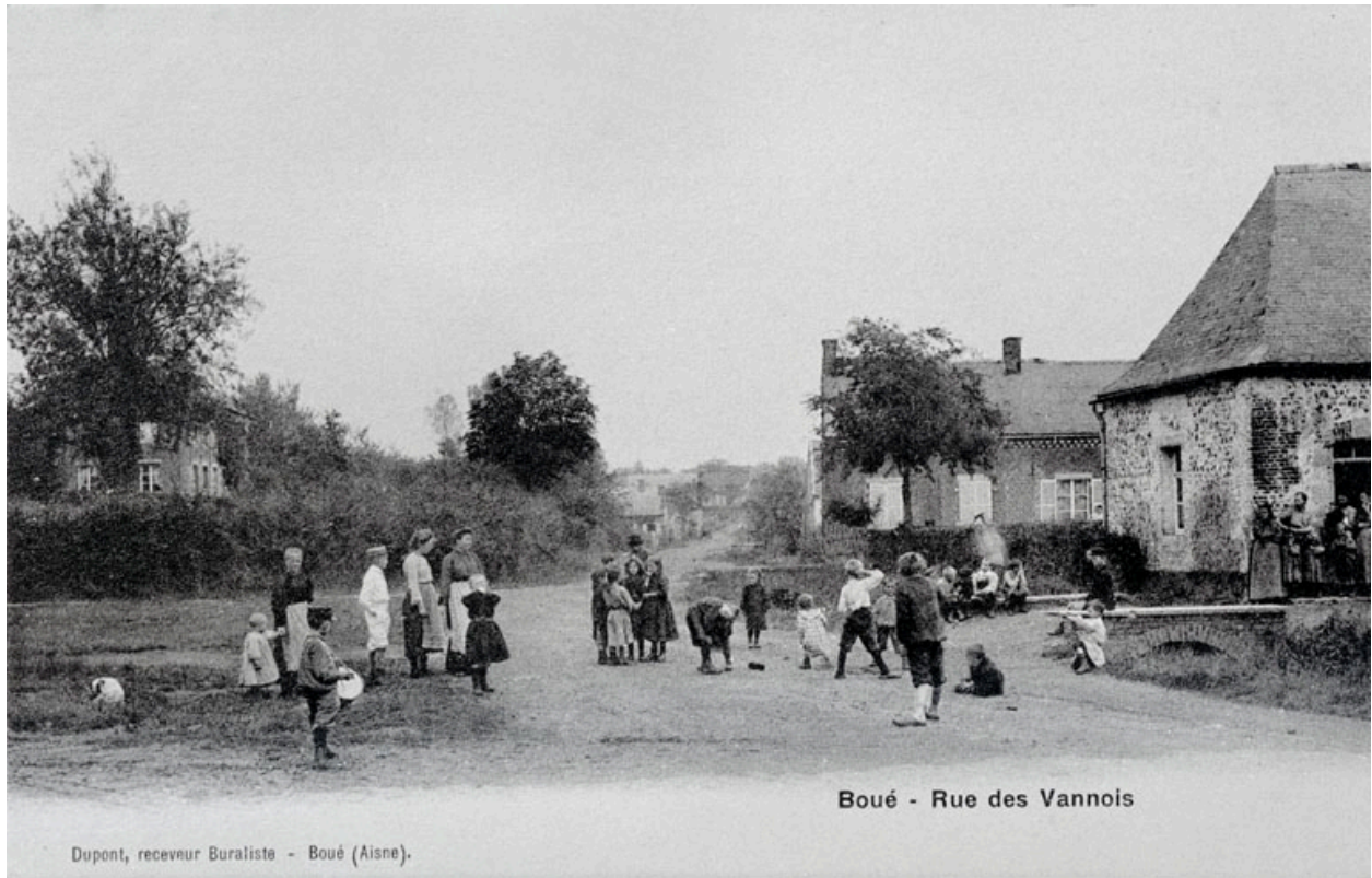
Rue des Vannois, vers 1910.