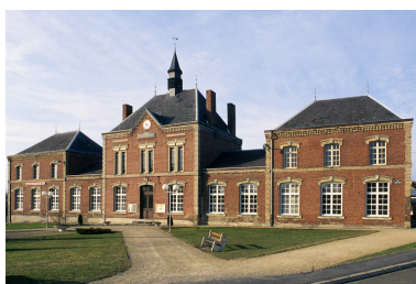
La mairie. IVR22_19960200035ZA