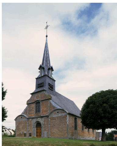
L'église Saint-Nicolas.