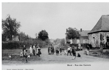
Rue des Vannois, vers 1910 (coll. part.). (reproduction) IVR22_19980205043ZB