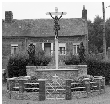
Rue de la Laiterie, rue de Bergues : calvaire composé de statues provenant de l'Union artistique de Vaucouleurs (1954).