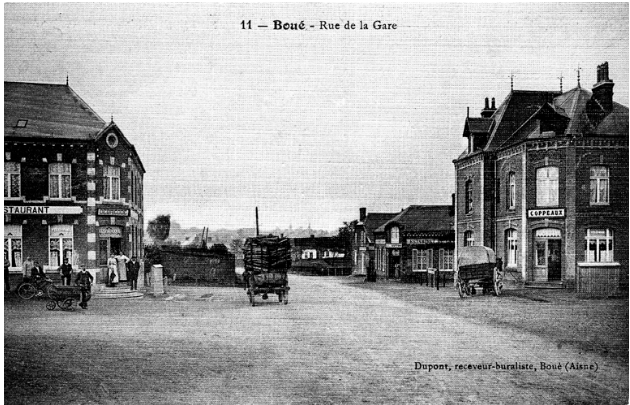
La rue de la gare, avant 1914.