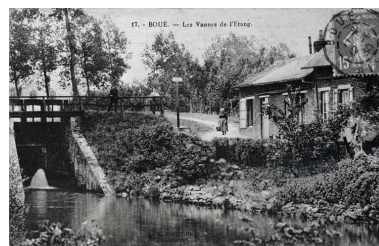
Vue des vannes de l'étang, vers 1930 (coll. part.). IVR22_19980205044ZB