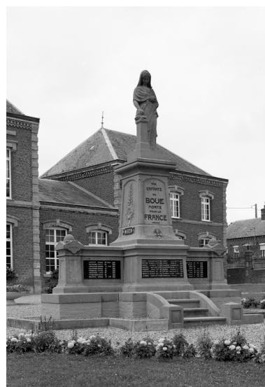
Le monument aux morts devant la mairie.