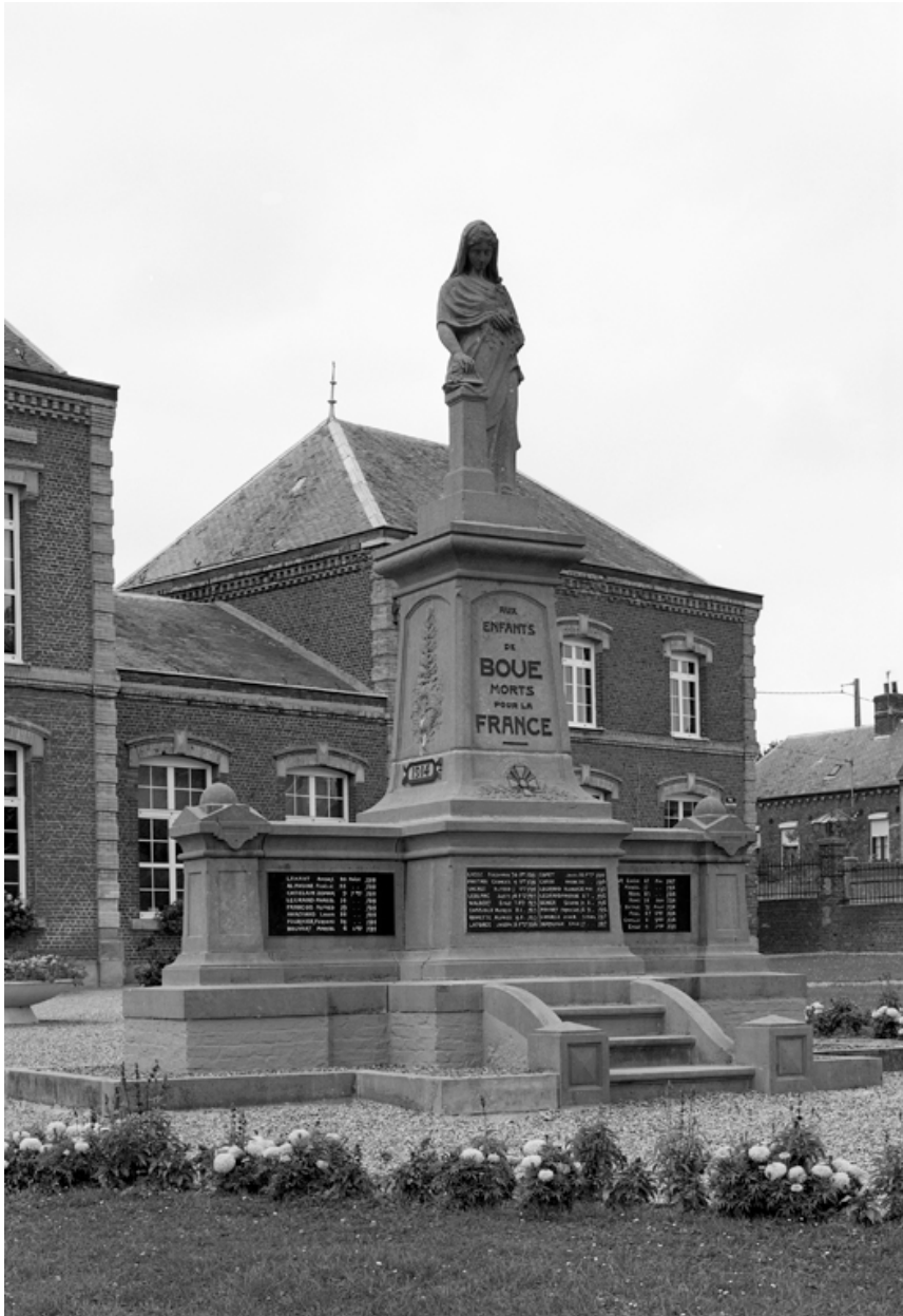
Le monument aux morts devant la mairie.