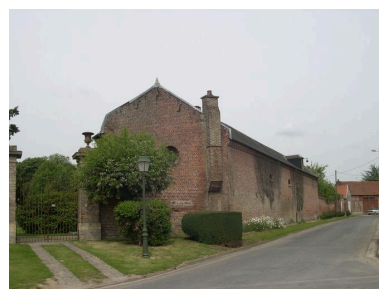
Dépendances bordant la ruelle. IVR22_20038010418NUCA