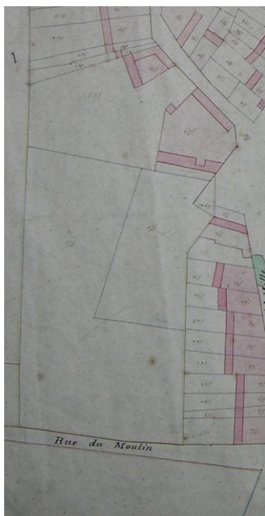
Extrait du cadastre napoléonien. IVR22_20038010775NUCA