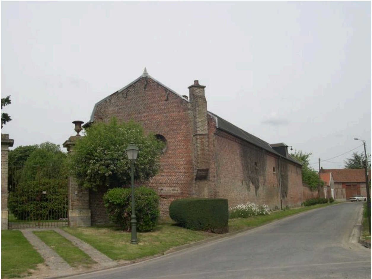
Dépendances bordant la ruelle.