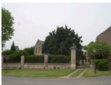
Vue de situation. IVR22_20038010417NUCA