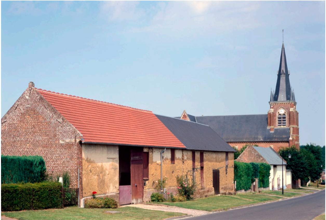
La Grande-Rue avec au premier plan, les granges en torchis des 46 et 44.