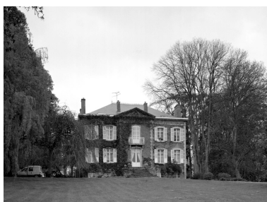
Le château.