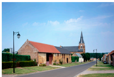
La Grande Rue, depuis le haut du village.