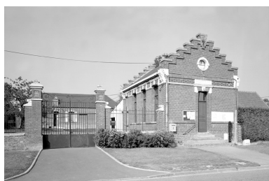
La mairie-école. IVR22_19978000819X

L'église Saint-Gilles. IVR22_19978000100VA