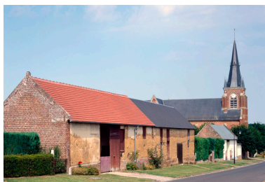
La Grande-Rue avec au premier plan, les granges en torchis des 46 et 44.