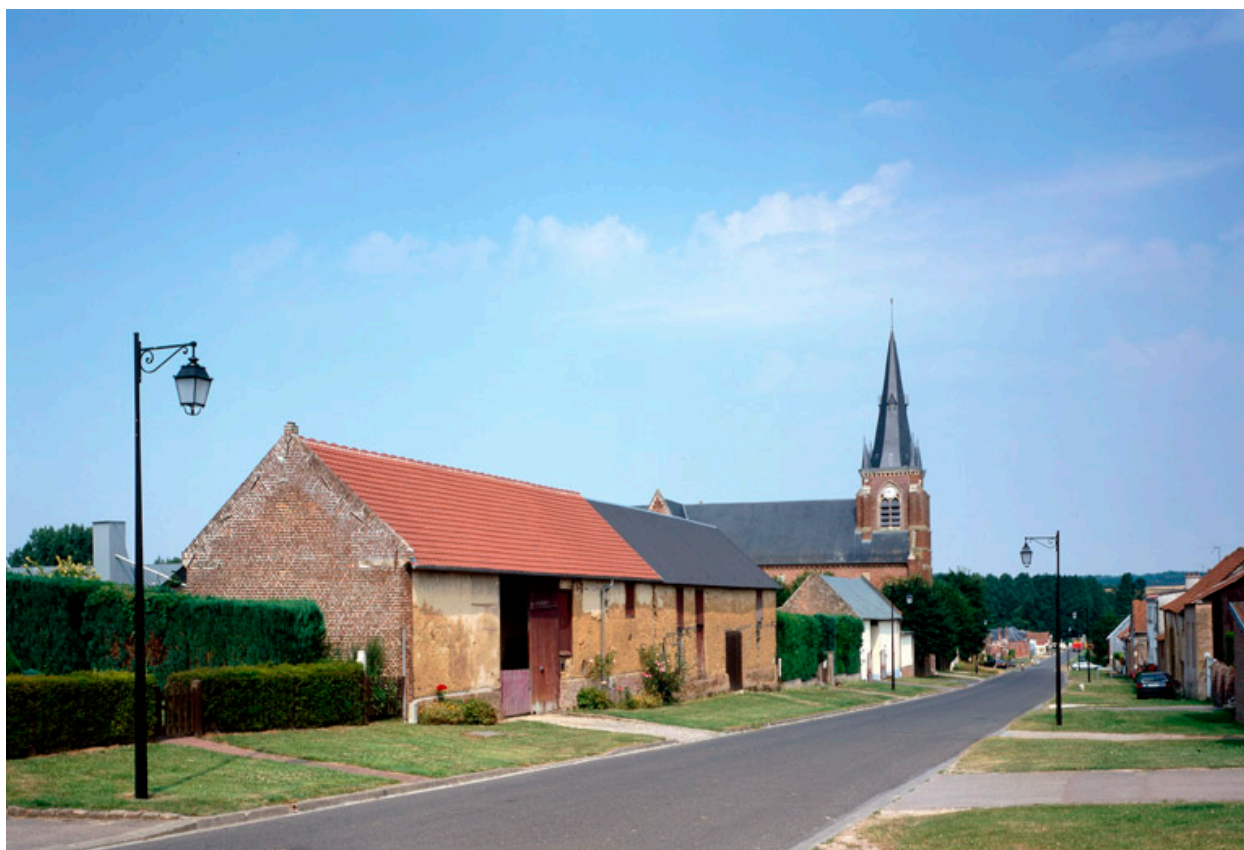
La Grande Rue, depuis le haut du village.