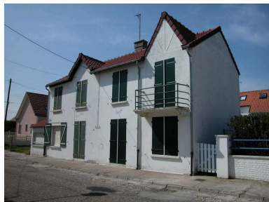
Vue d'ensemble. IVR22_20058002817NUCA