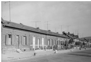
Vue générale. IVR22_19856001344X