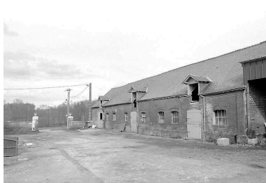
Vue des étables à chevaux et à vaches. IVR22_19980200829Z