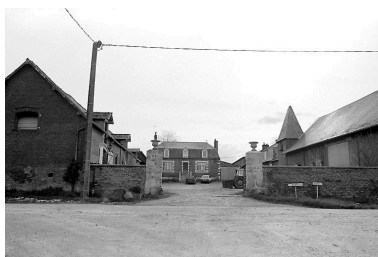
Vue générale de la ferme. IVR22_19980200830Z