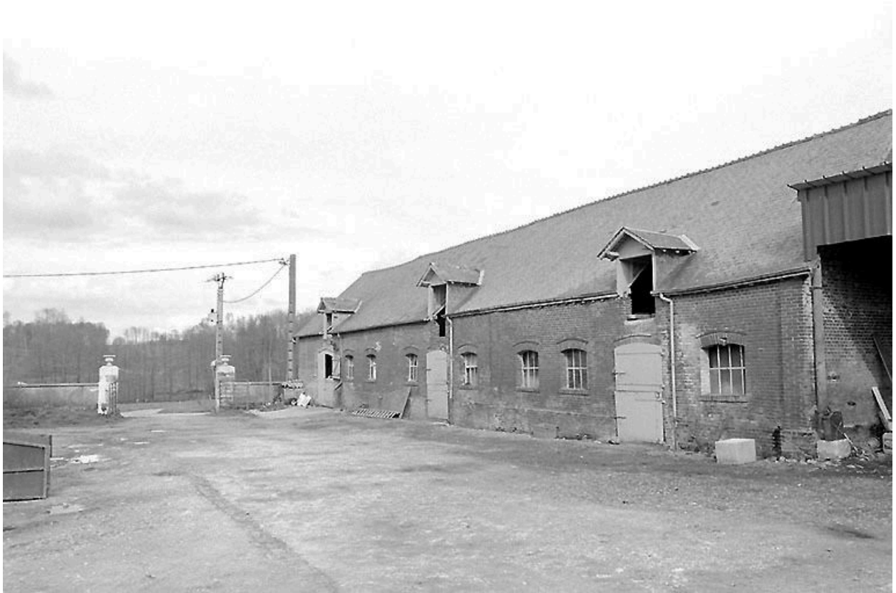
Vue des étables à chevaux et à vaches.