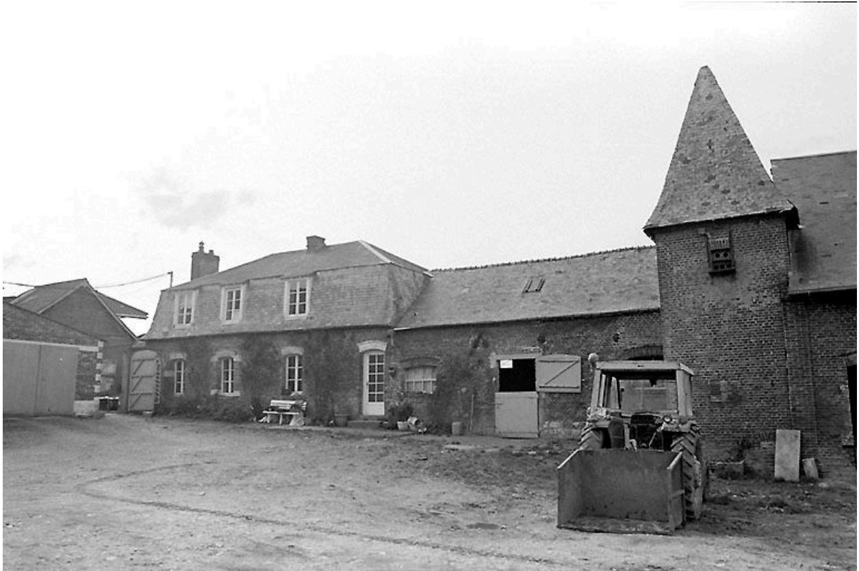
Vue du logement, de l'étable et du pigeonnier.