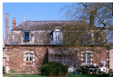
Élévation postérieure du logis. IVR22_19990201290XA