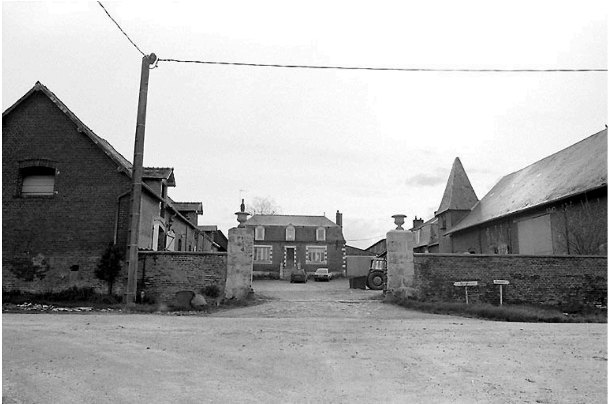
Vue générale de la ferme.