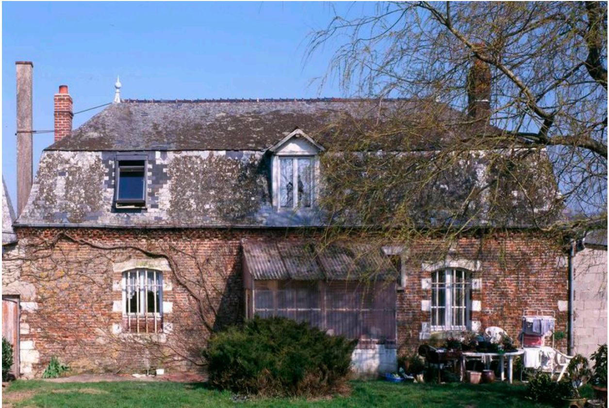
Elévation postérieure du logis.