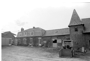
Vue du logement, de l'étable et du pigeonnier.