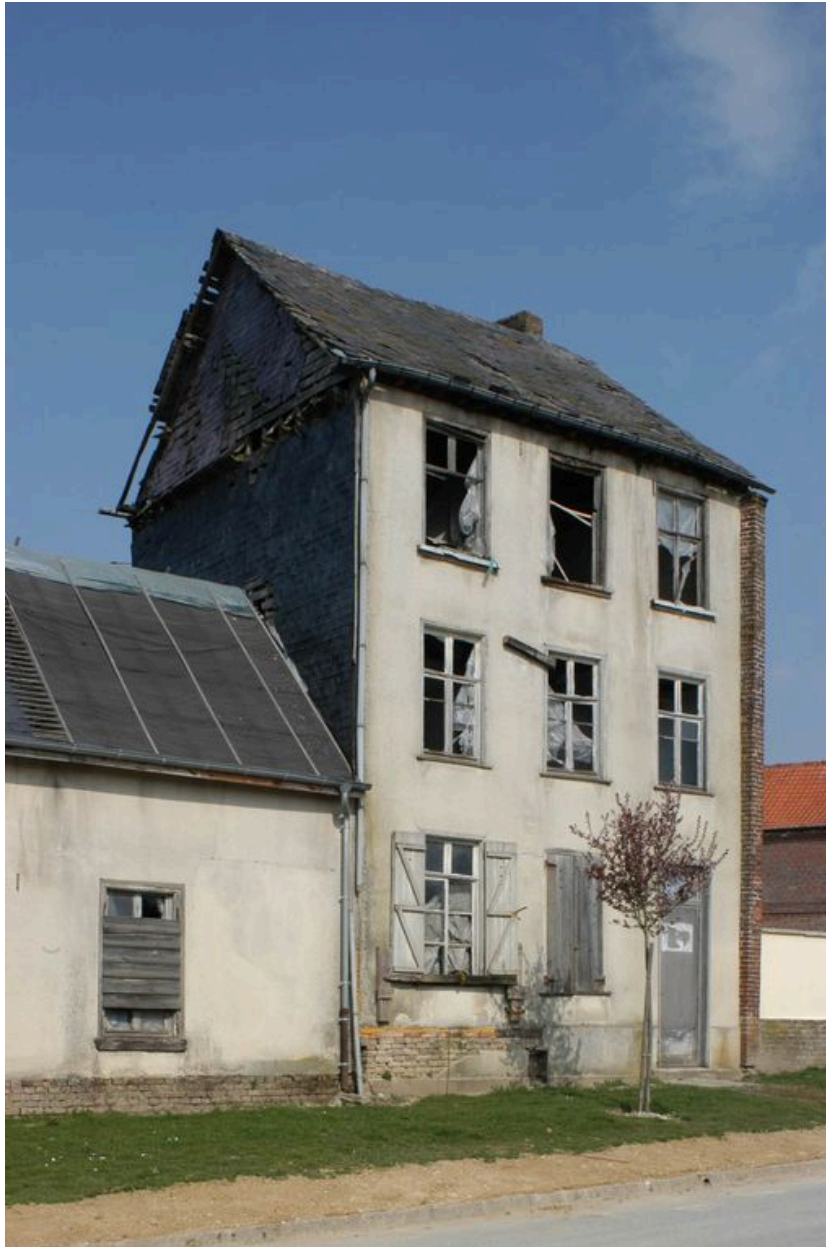
Vue de détail sur le corps de logis.