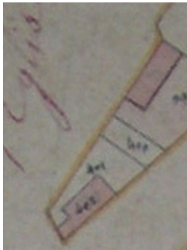
Extrait du cadastre napoléonien (DGI). IVR22_20038010329NUCA