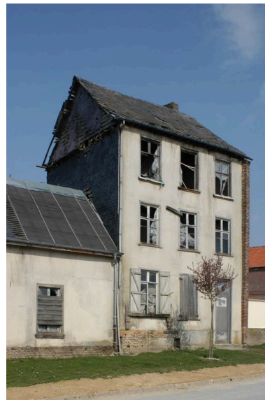
Vue de détail sur le corps de logis. IVR22_20038000269NUCA