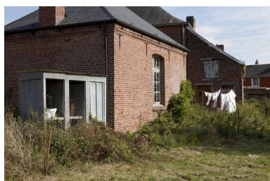
Détail de la maison d'école. IVR31_20095903201NUCA