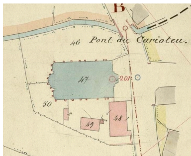
Extrait de la feuille cadastrale E1. Plan de situation en 1897 (AD Nord ; série P : P 31 / 712 / 012863).