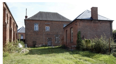
Vue du revers du presbytère et de la maison d'école. IVR31_20095900032NUCA