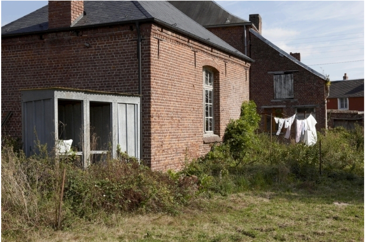
Détail de la maison d'école.