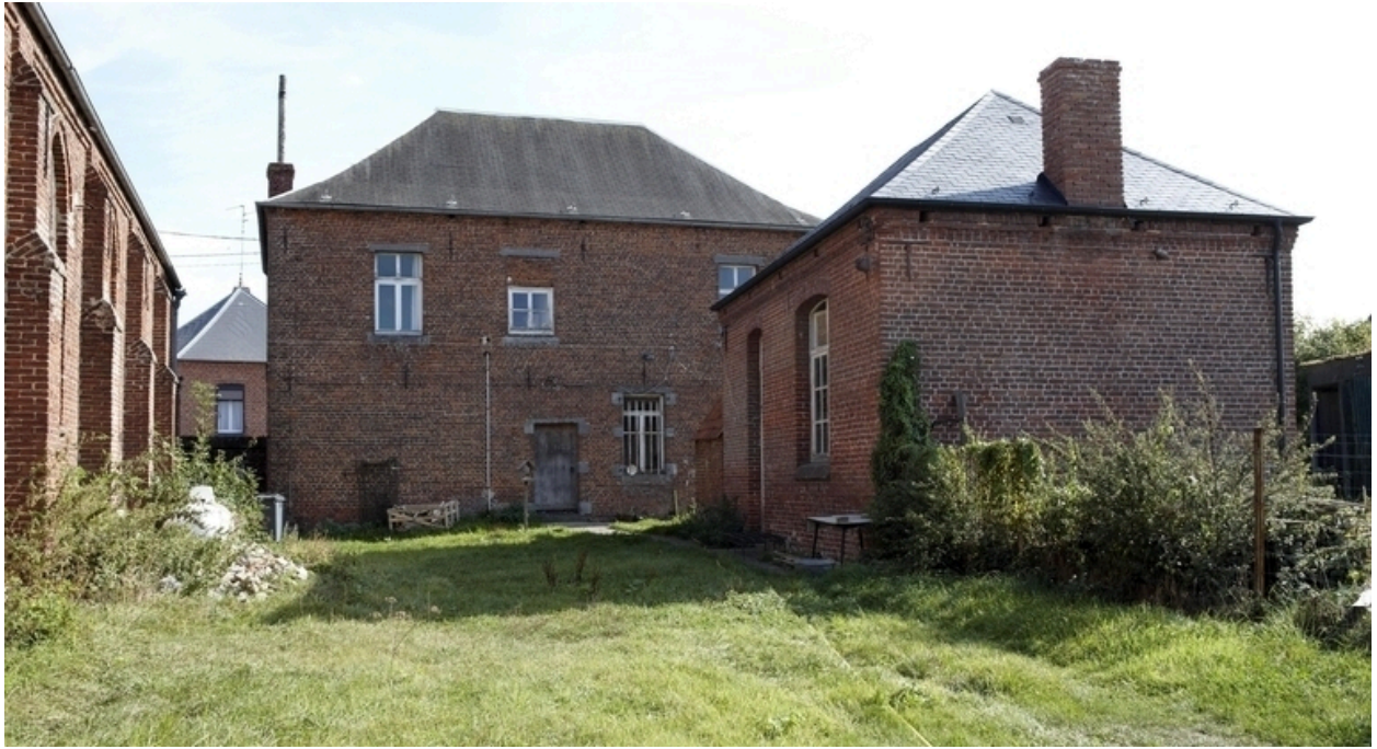
Vue du revers du presbytère et de la maison d'école.