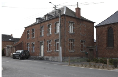
Vue générale. IVR31_20095903245NUCA