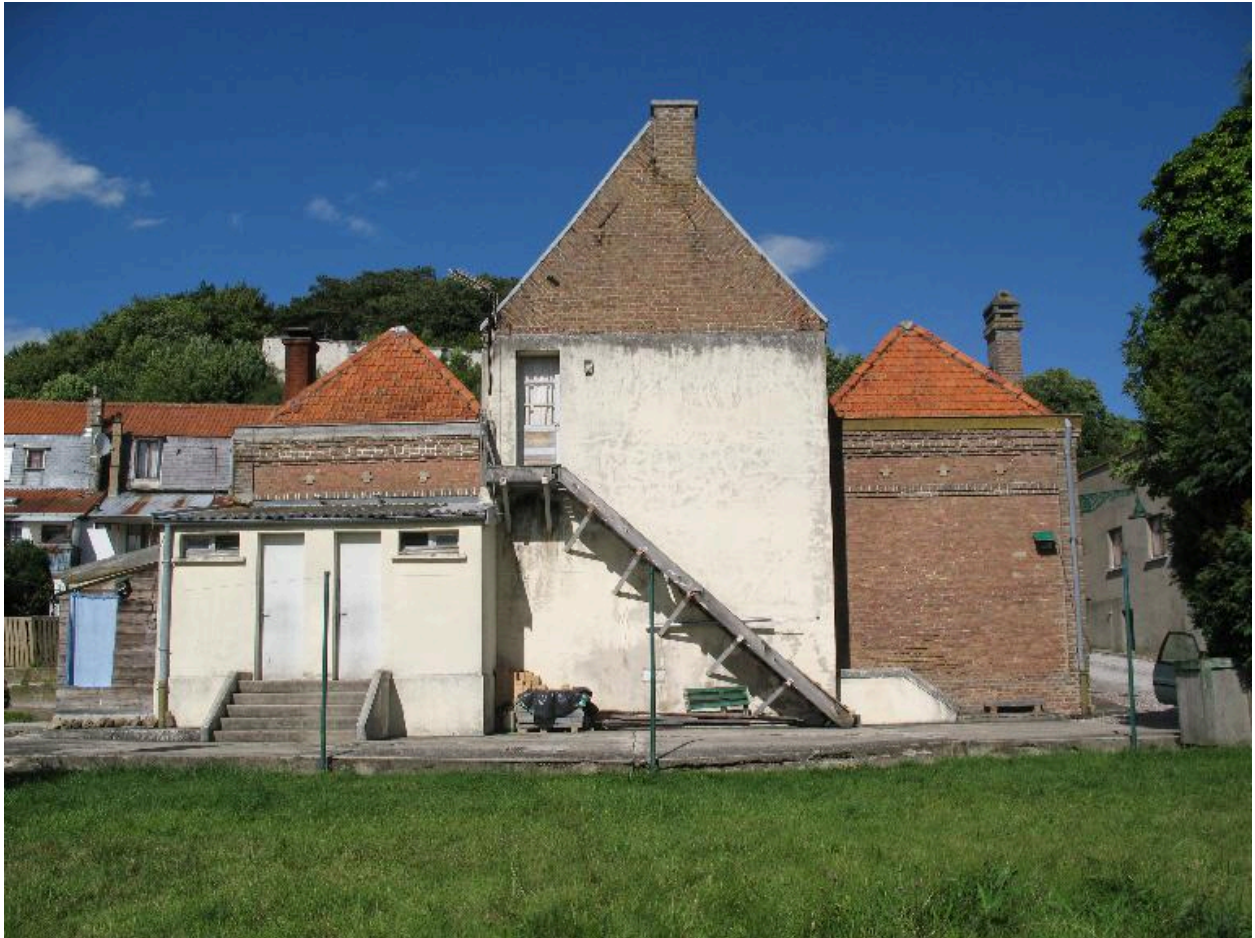
Vue d'ensemble de la façade postérieure.