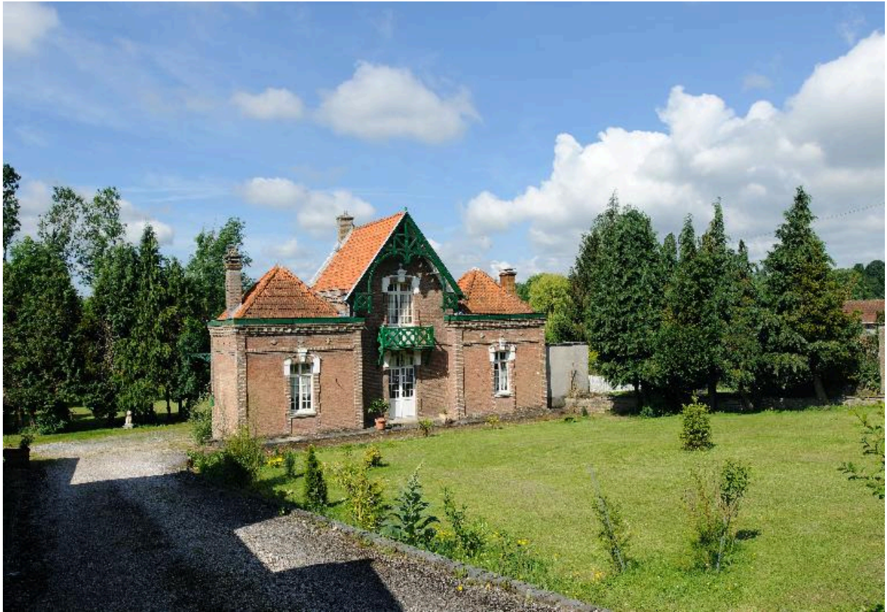
Vue d'ensemble sur rue.