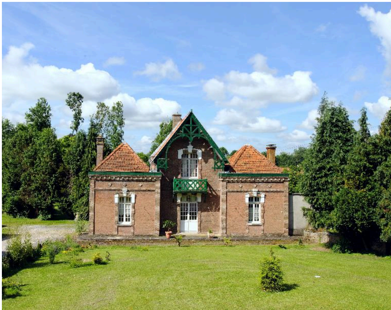
Ensemble sur rue, vue de face.

IVR22_20128000302NUC2A Auteur de l'illustration : Thierry Lefébure (c) Région Hauts-de-France - Inventaire général reproduction soumise à autorisation du titulaire des droits d'exploitation