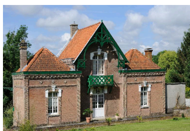
Façade sur rue, vue de trois-quarts. IVR22_20128000301NUC2A