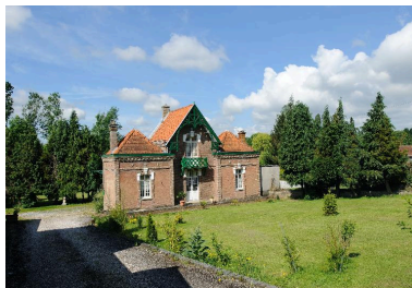
Vue d'ensemble sur rue. IVR22_20128000300NUC2A