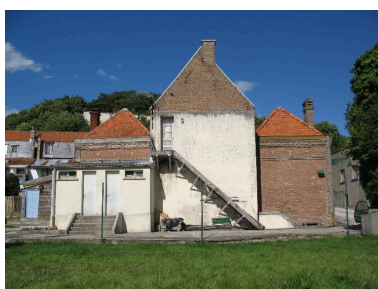
Vue d'ensemble de la façade postérieure. IVR22_20128005089NUCA