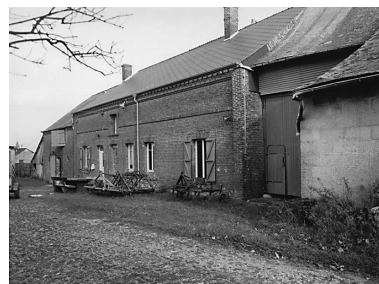
Façade ouest du logis donnant sur la cour intérieure.