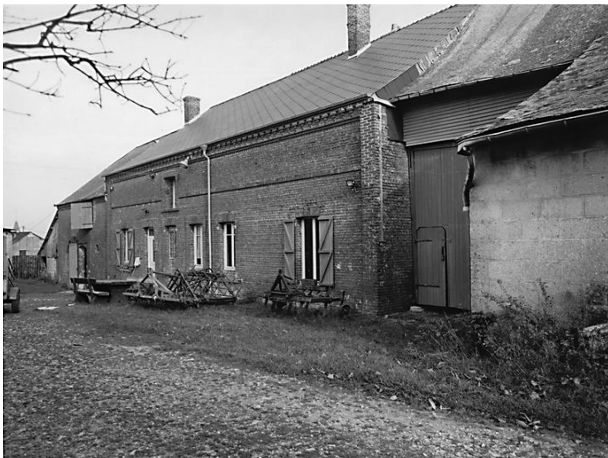
Façade ouest du logis donnant sur la cour intérieure.