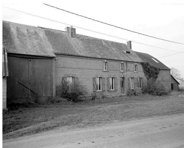
Façade est du logis, avec l'entrée de la grange traversante. IVR22_19970202208X