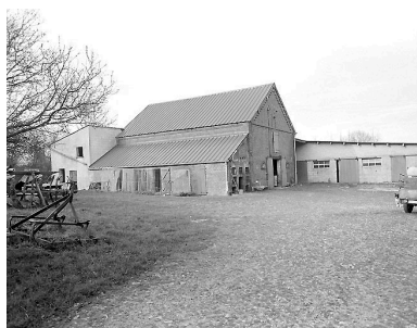
Vue de la cour intérieure : grange-étable. IVR22_19970202207X