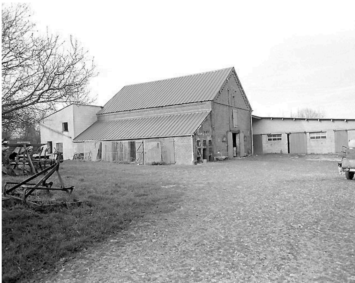
Vue de la cour intérieure : grange-étable.