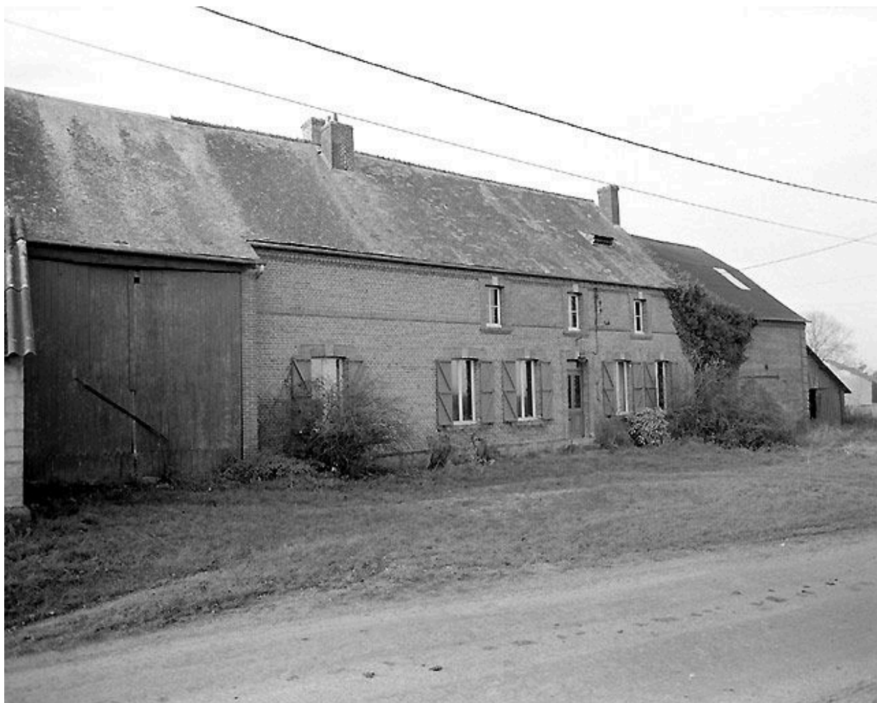
Façade est du logis, avec l'entrée de la grange traversante.