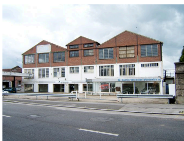
Façade est donnant sur la rue. IVR22_20066090070NUCA