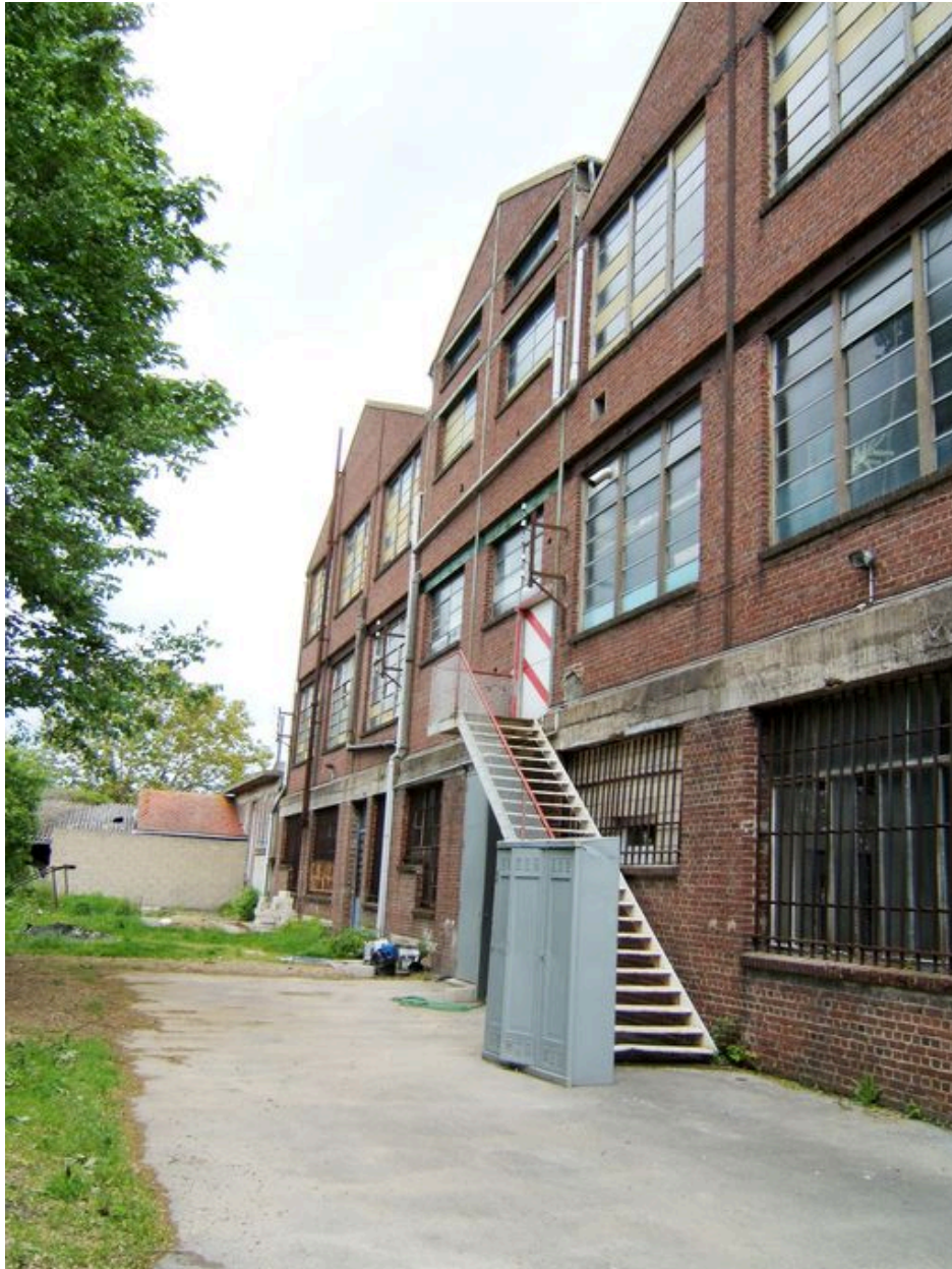
Vue latérale de la façade ouest.