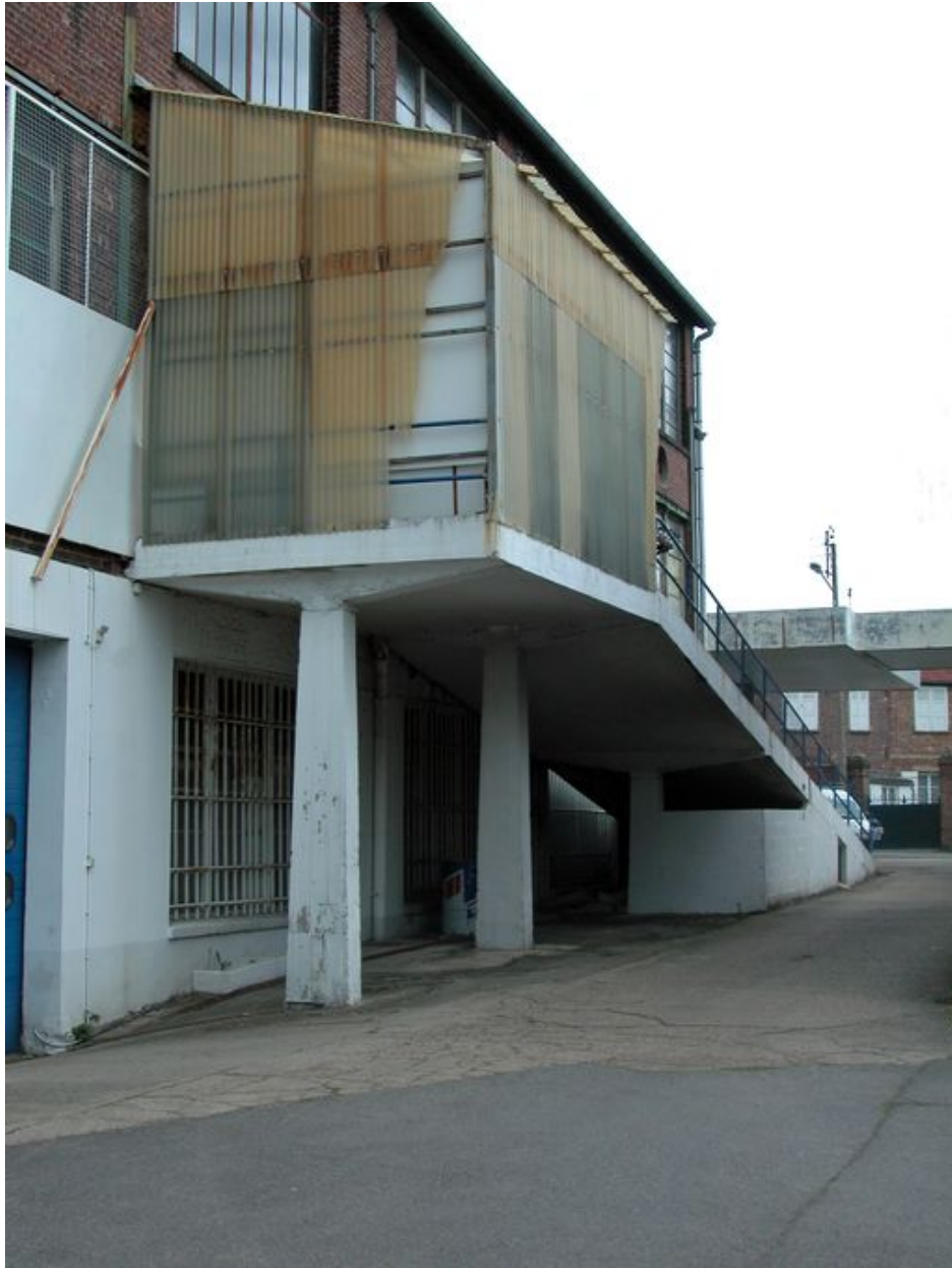
L'escalier de la façade sud.