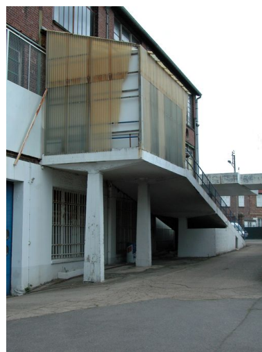
L'escalier de la façade sud.