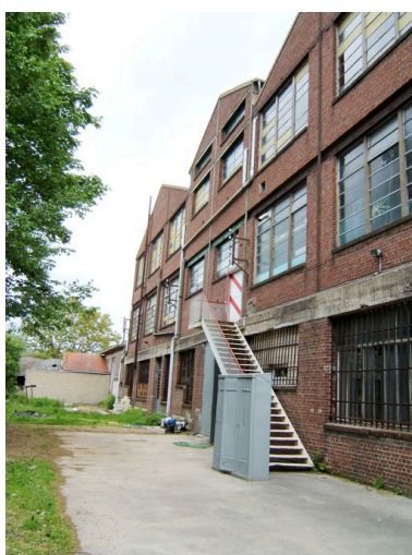
Vue latérale de la façade ouest. IVR22_20066090072NUCA