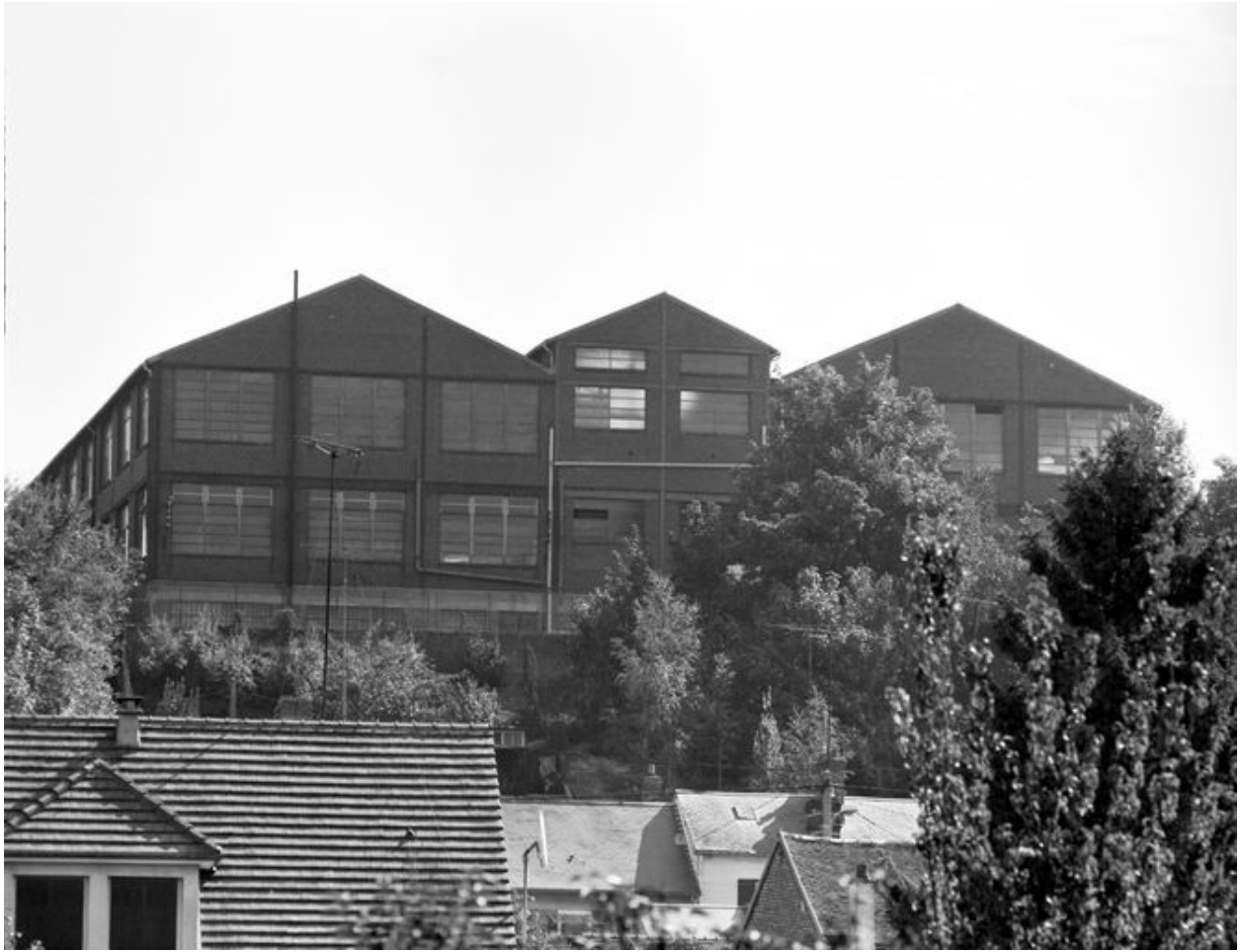
Façade ouest de l'usine.