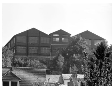
Façade ouest de l'usine.