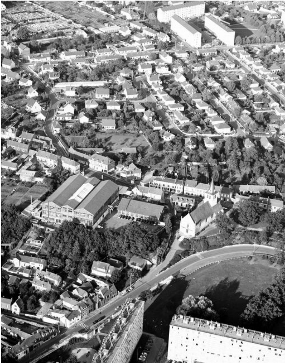
Vue aérienne de l'usine en 1994.