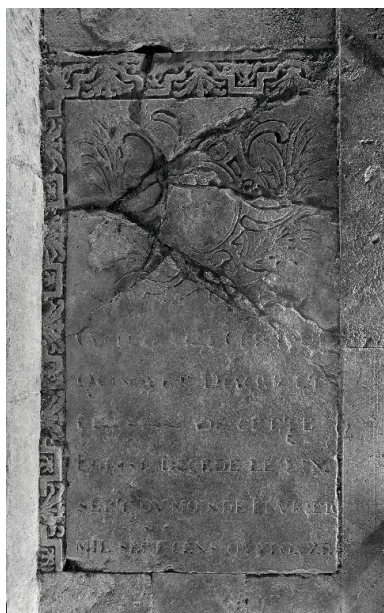
Vue générale de la dalle.

IVR22_20030200992X