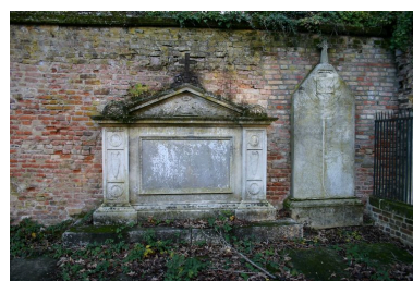
Stèle funéraire, vers 1822 (au centre) et stèle funéraire, vers 1852 (à droite).