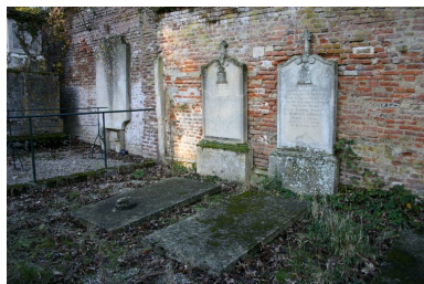
Stèles funéraires réalisées sur le même modèle vers 1863 et 1876.