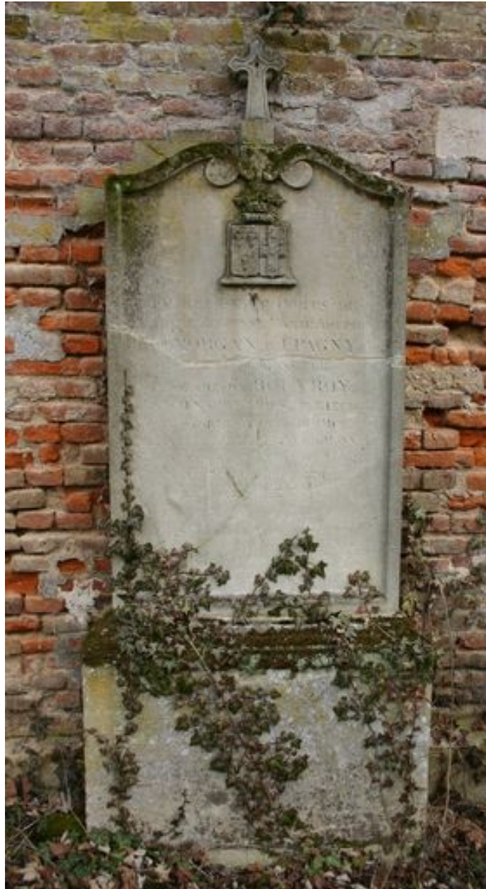
Stèle funéraire, vers 1876.