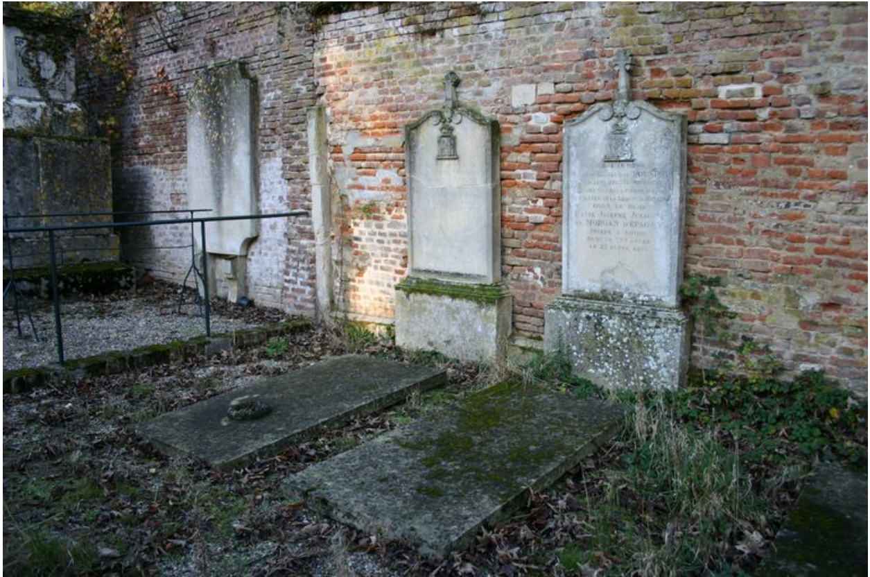
Stèles funéraires réalisées sur le même modèle vers 1863 et 1876.