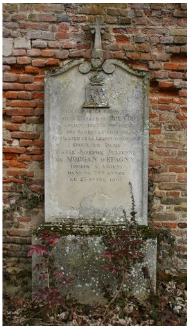
Stèle funéraire, vers 1863.