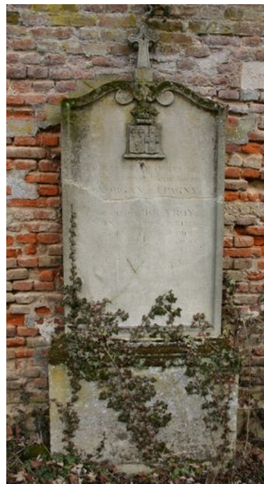
Stèle funéraire, vers 1876.