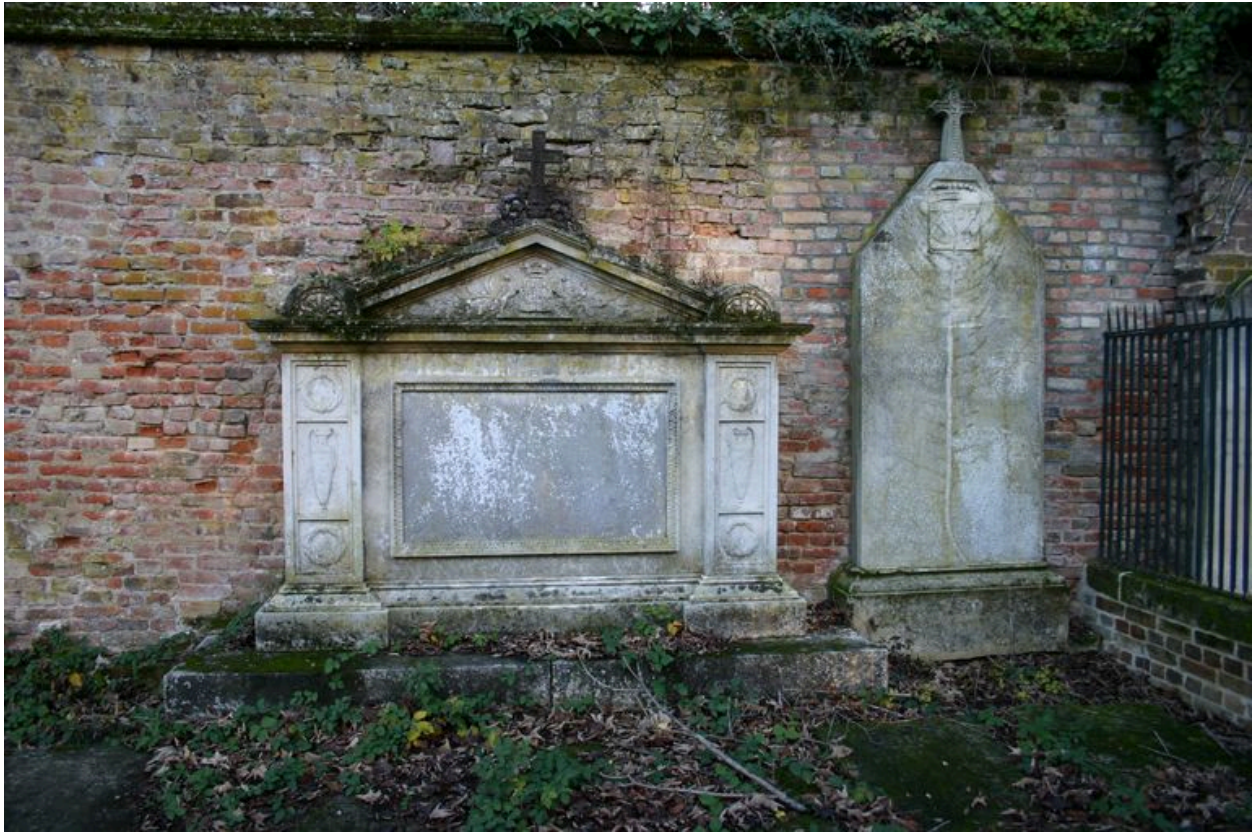
Stèle funéraire, vers 1822 (au centre) et stèle funéraire, vers 1852 (à droite).