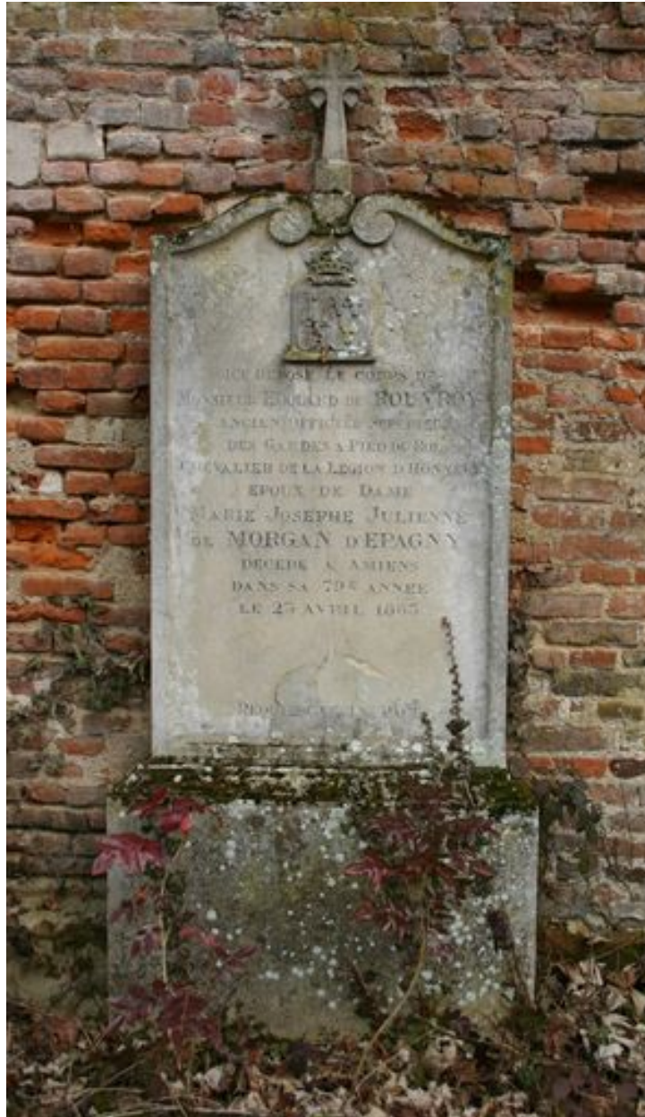
Stèle funéraire, vers 1863.