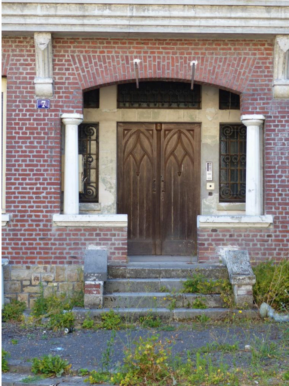
Vue de détail sur le porche dans oeuvre.