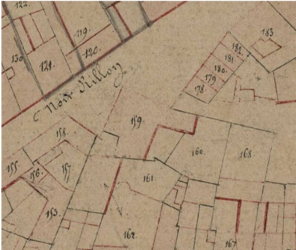
Extrait du cadastre napoléonien. Section B, parcelles 159-160 (AD Somme ; 3P2065/4).