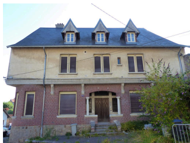
Vue de la façade ouest sur rue.