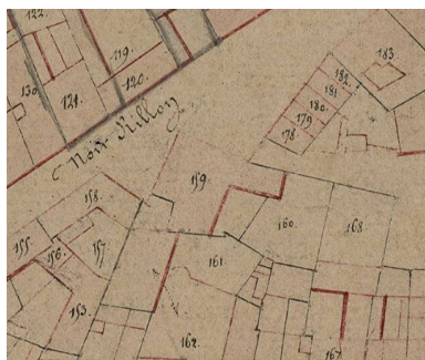
Extrait du cadastre napoléonien. Section B, parcelles 159-160 (AD Somme ; 3P2065/4). IVR32_20178005488NUCA