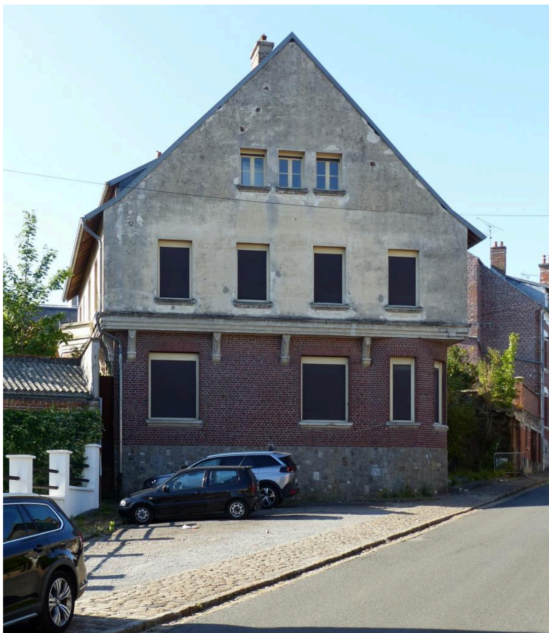
Vue de la façade nord.