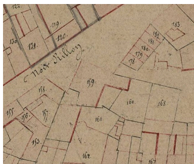
Extrait du cadastre napoléonien. Section B, parcelles 159-160 (AD Somme ; 3P2065/4).

Phot. Archives départementales de la Somme IVR32_20178005488NUCA