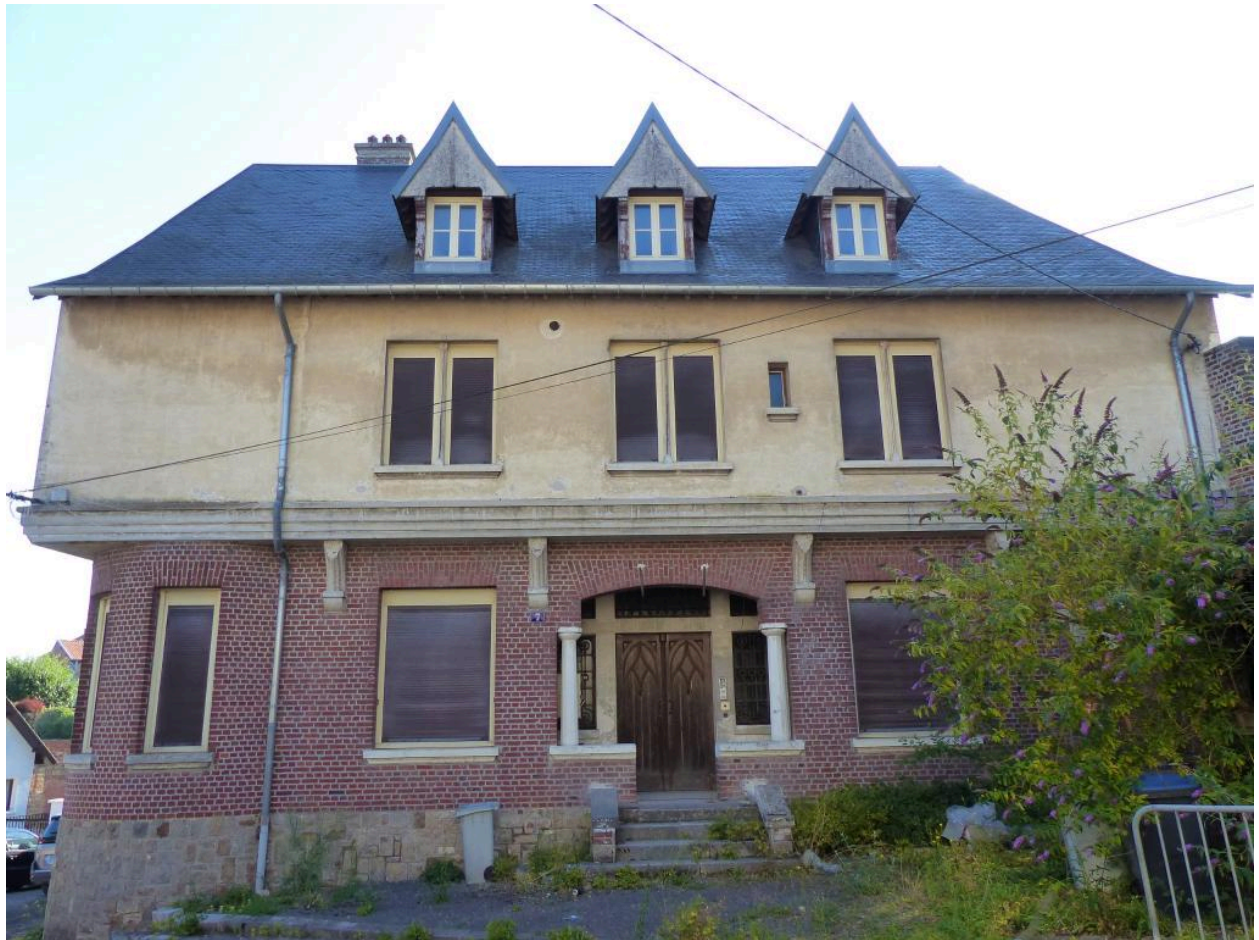
Vue de la façade ouest sur rue.