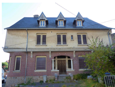
Vue de la façade ouest sur rue.