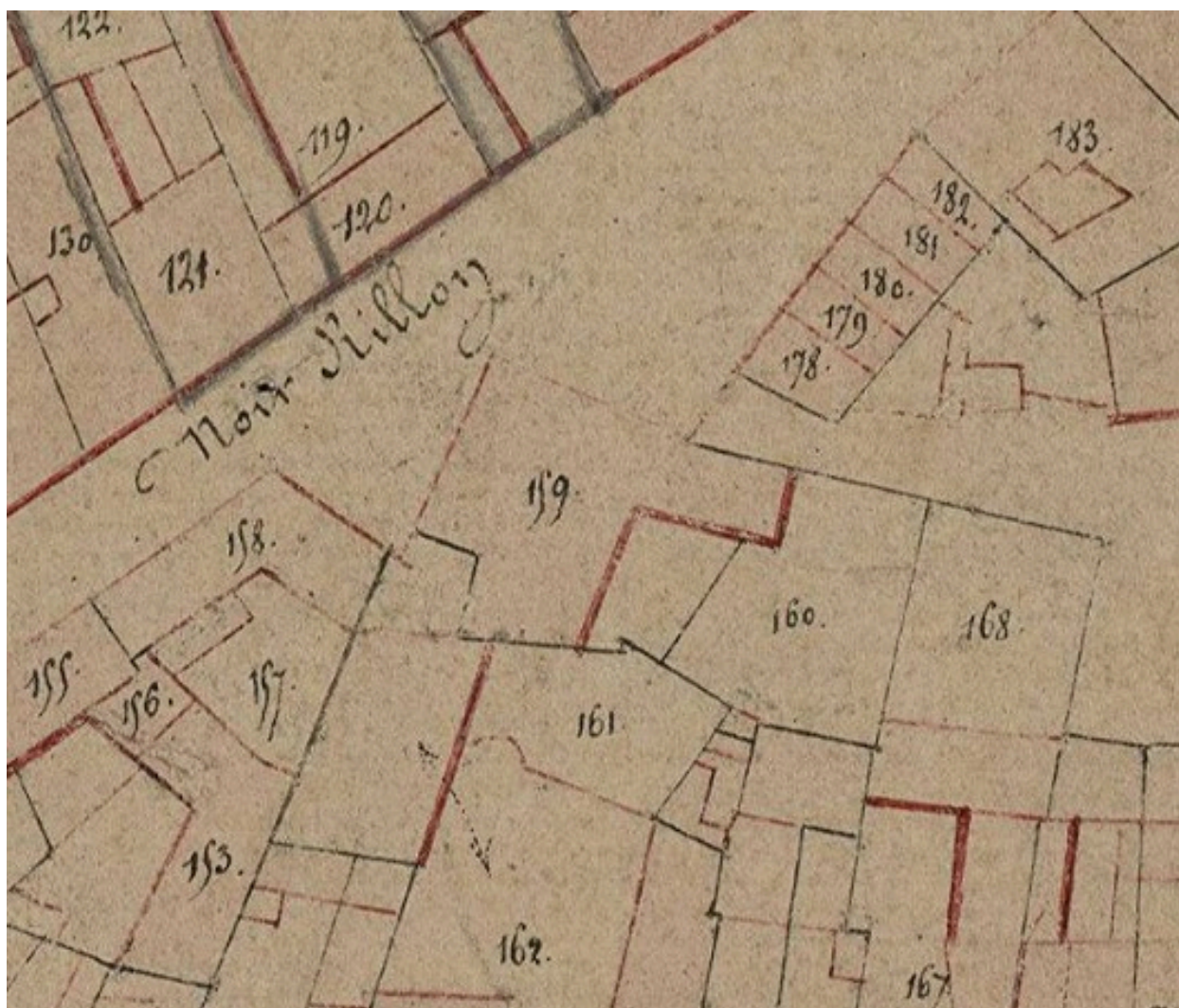
Extrait du cadastre napoléonien. Section B, parcelles 159-160 (AD Somme ; 3P2065/4).