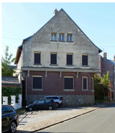
Vue de la façade nord. IVR32_20188005190NUCA