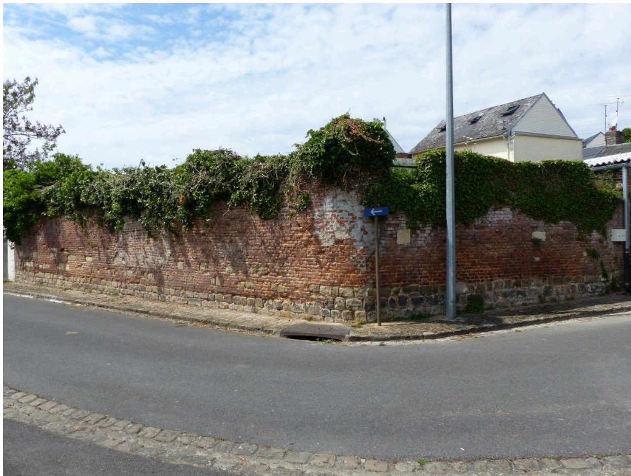
Rue de la Fontaine. Vestiges du mur de soutènement de l'ancien cimetière de l'église.