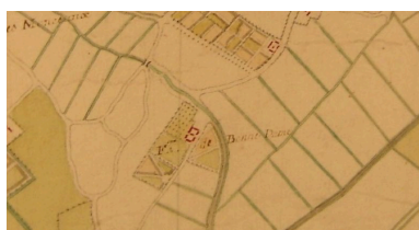
Extrait d'une carte du 18e siècle présentant le plan et les terres de la ferme.

IVR22_20068005958NUCAB