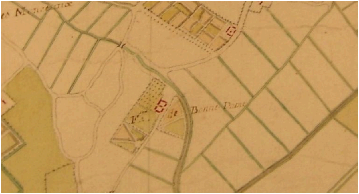
Extrait d'une carte du 18e siècle présentant le plan et les terres de la ferme.