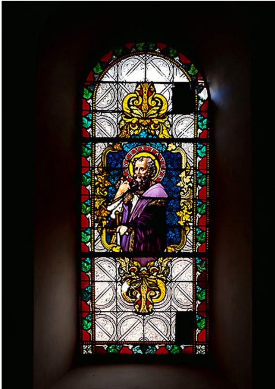
Baie 3 : saint Paul.