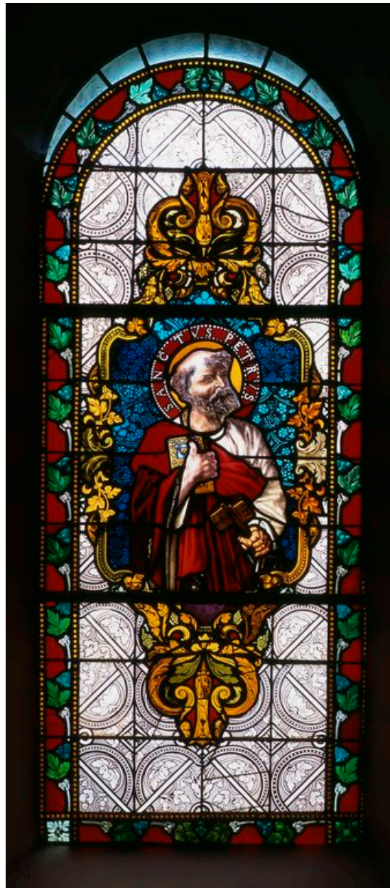
Baie 4 : saint Pierre.