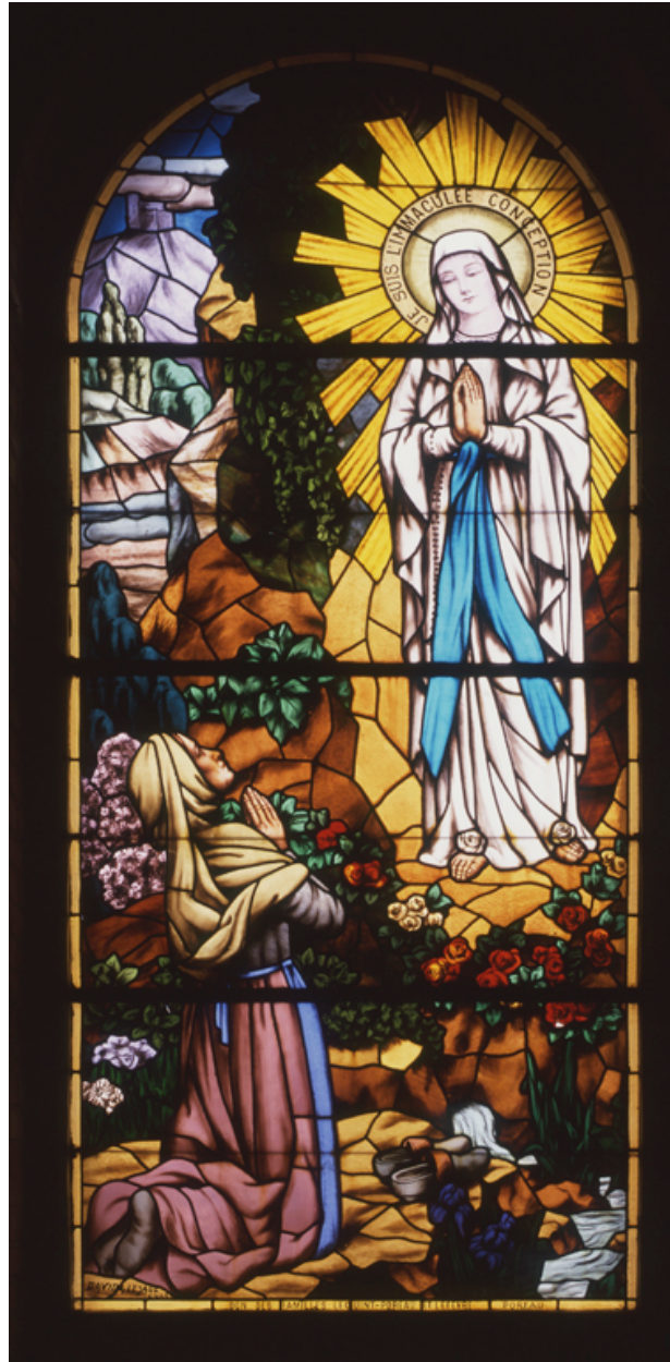
Baie 1 : Apparition de la Vierge à Bernadette Soubirous.