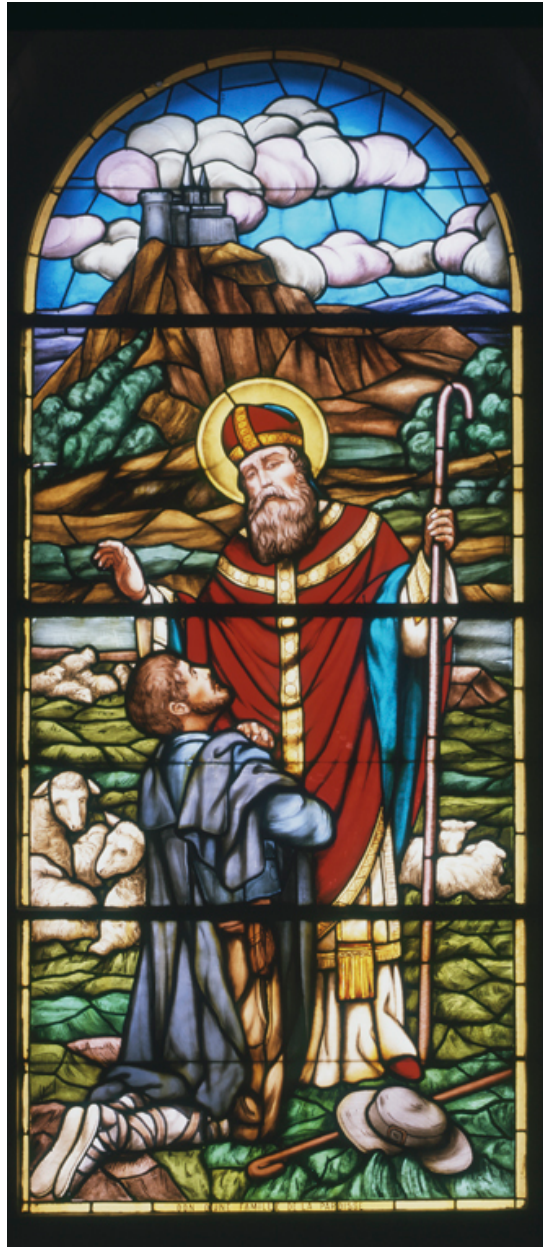
Baie 0 : saint évêque bénissant un berger.