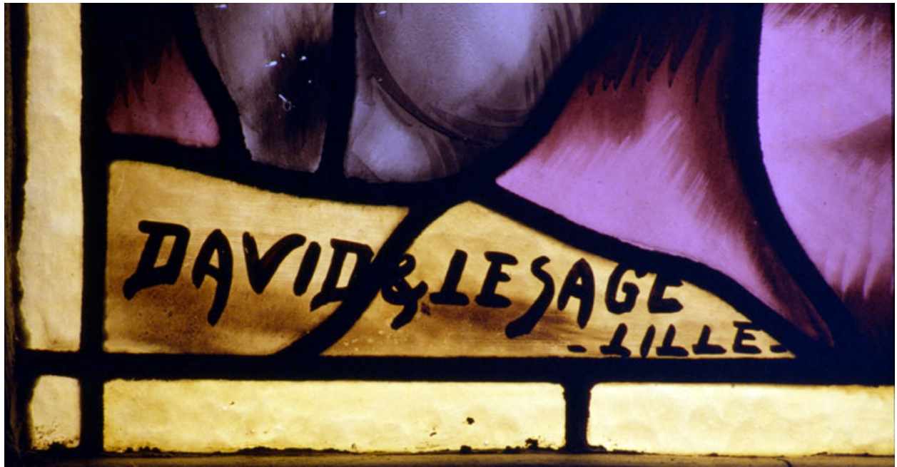
Baie 1 : détail de la signature.