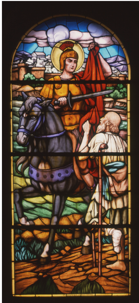
Baie 2 : Charité de saint Martin.