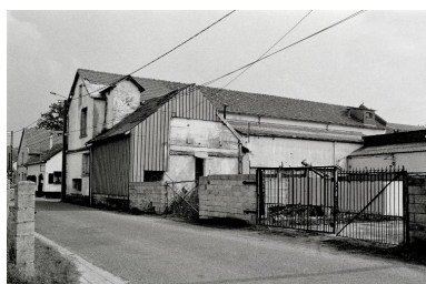
Atelier de fabrication.