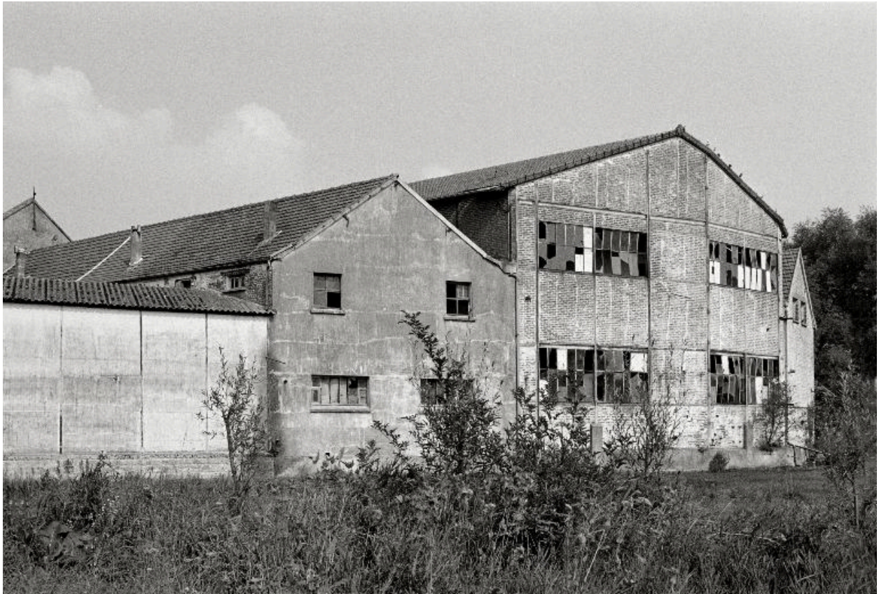
Ateliers de fabrication, élévations postérieures.