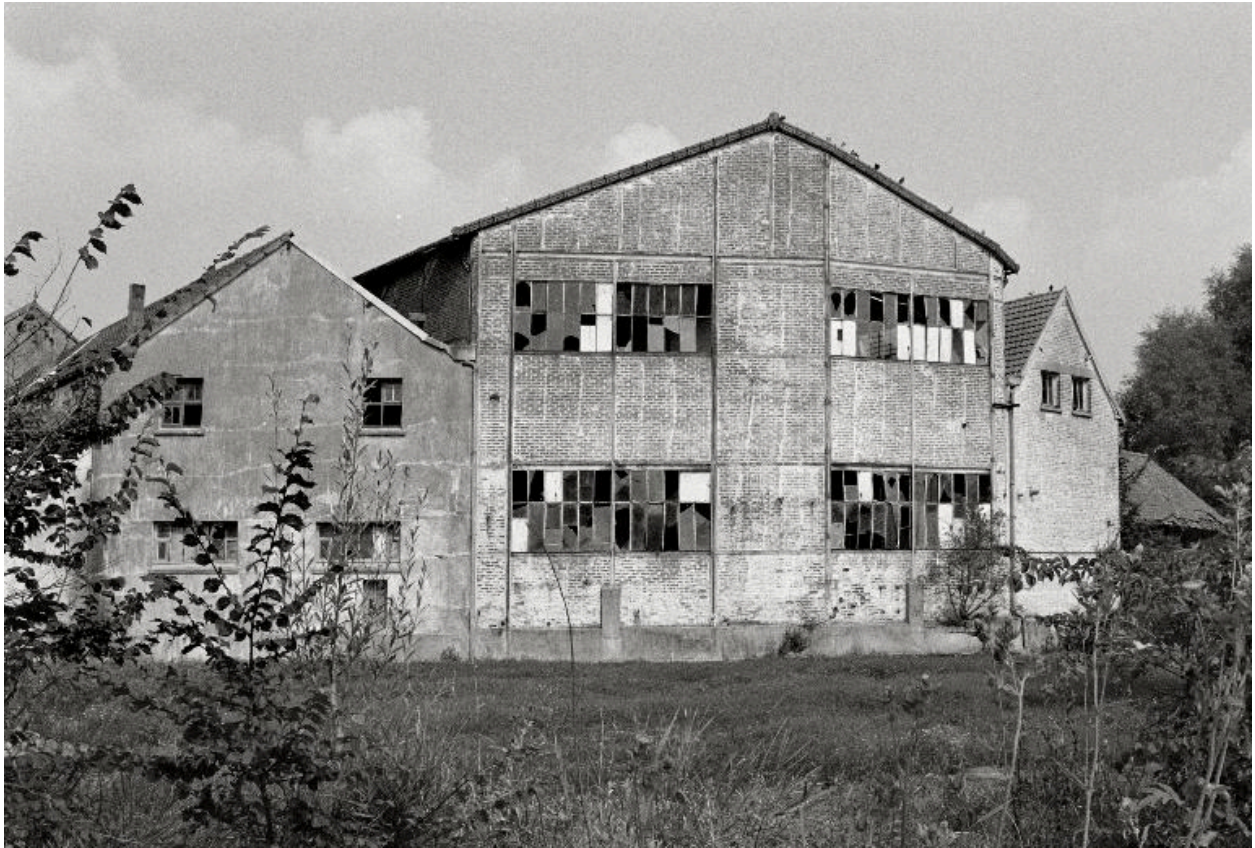
Ateliers de fabrication, vue postérieure.