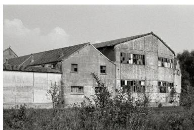
Ateliers de fabrication, élevations postérieures. IVR22_19908000757Z