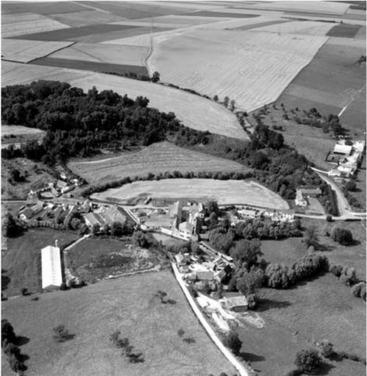
Vue aérienne, flanc est.