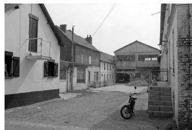
Atelier de fabrication, élévation antérieure. IVR22_19908000754Z