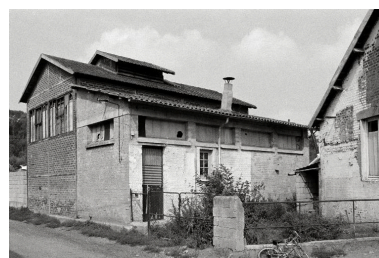
Ateliers de fabrication. IVR22_19908000759Z