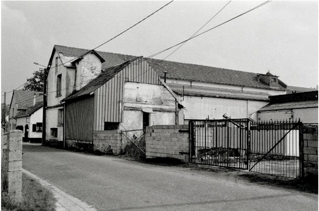
Atelier de fabrication.