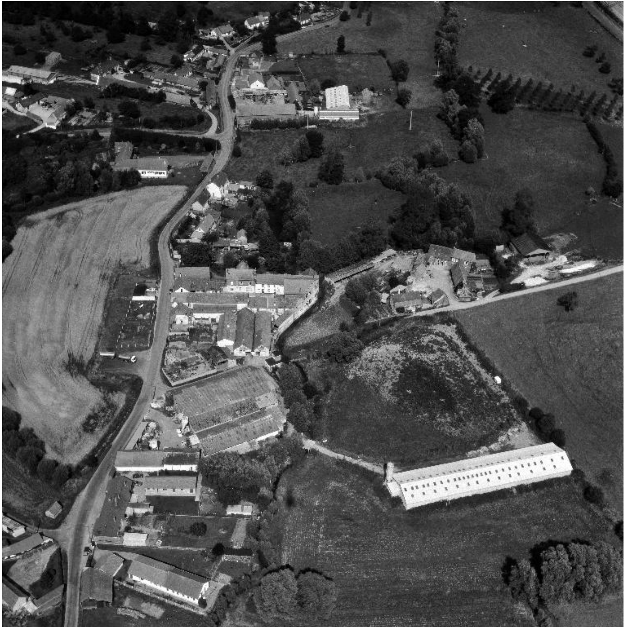
Vue aérienne, flanc sud-ouest.