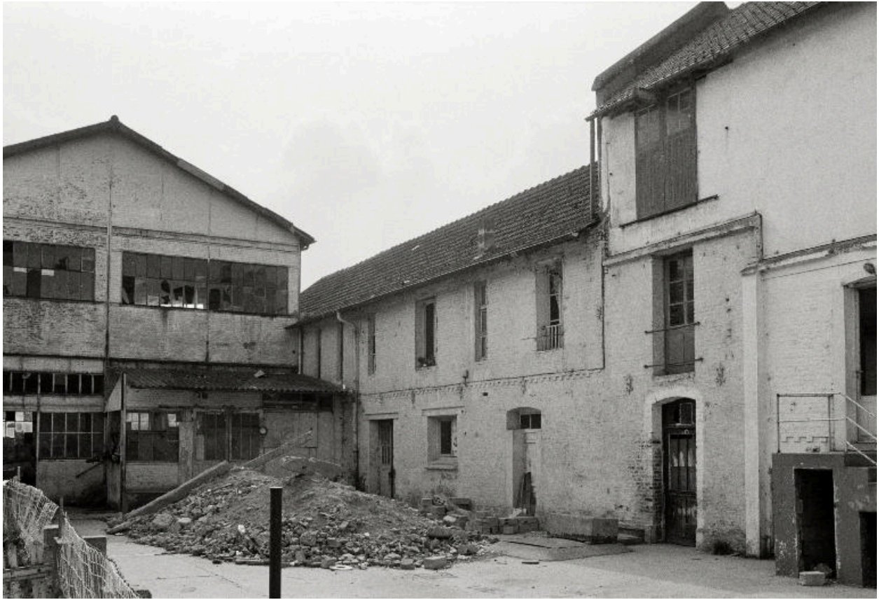
Ateliers vus depuis la cour.