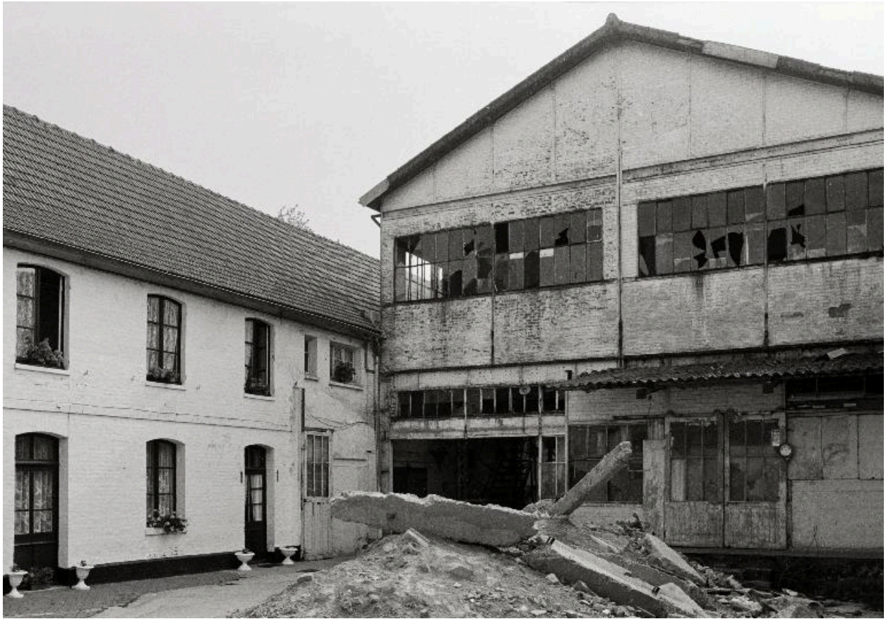
Atelier de fabrication, vue depuis la cour.