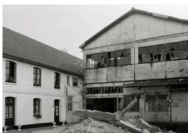
Atelier de fabrication, vue depuis la cour. IVR22_19908000755Z