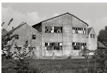
Ateliers de fabrication, vue postérieure. IVR22_19908000758Z