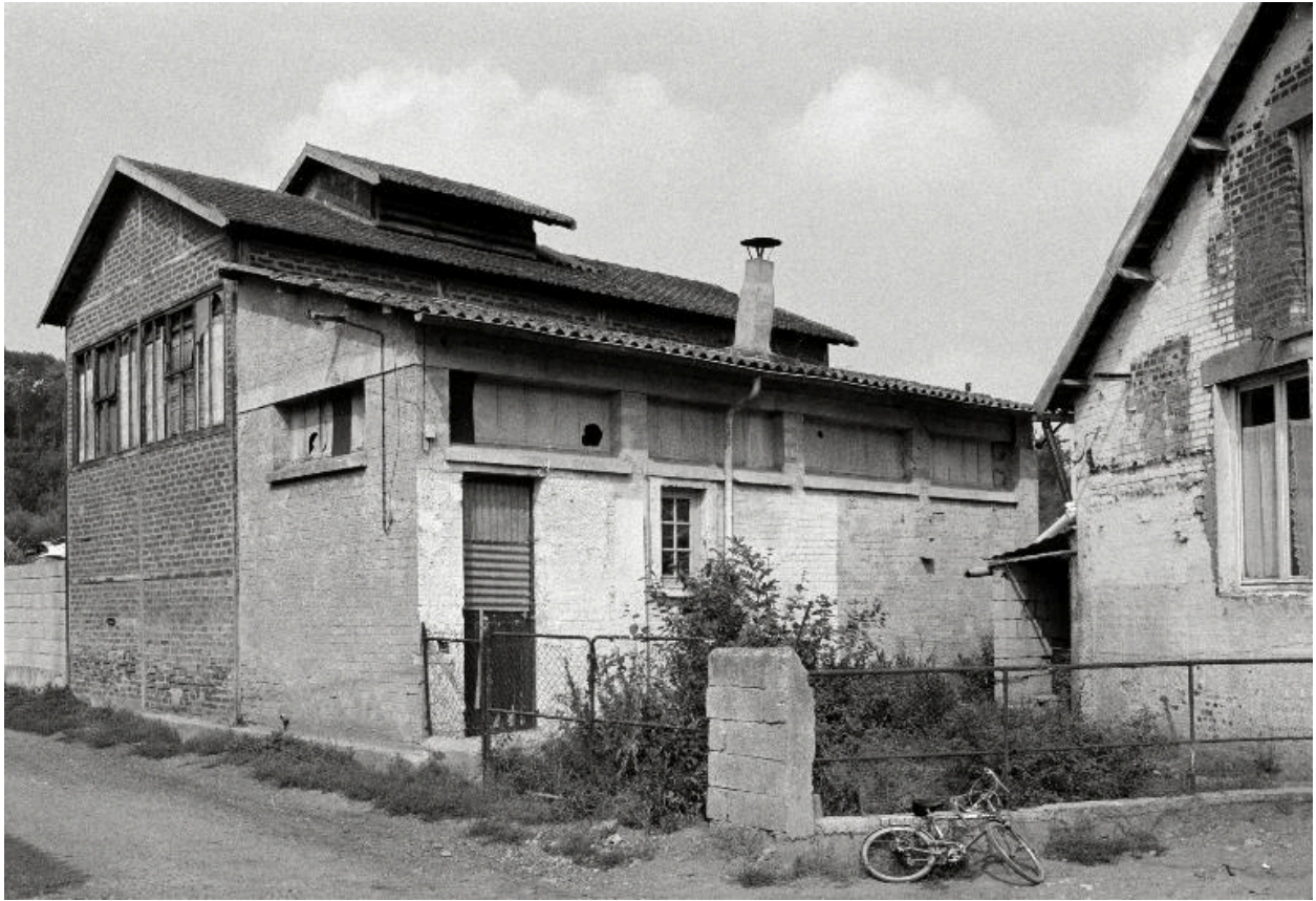
Ateliers de fabrication.