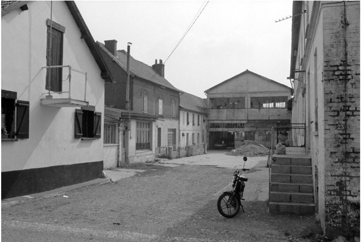
Atelier de fabrication, élévation antérieure.