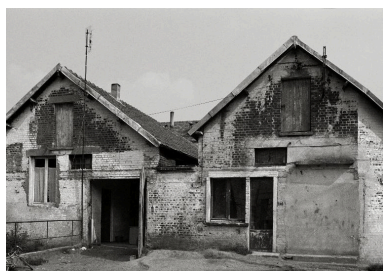
Atelier de fabrication. IVR22_19908000760Z