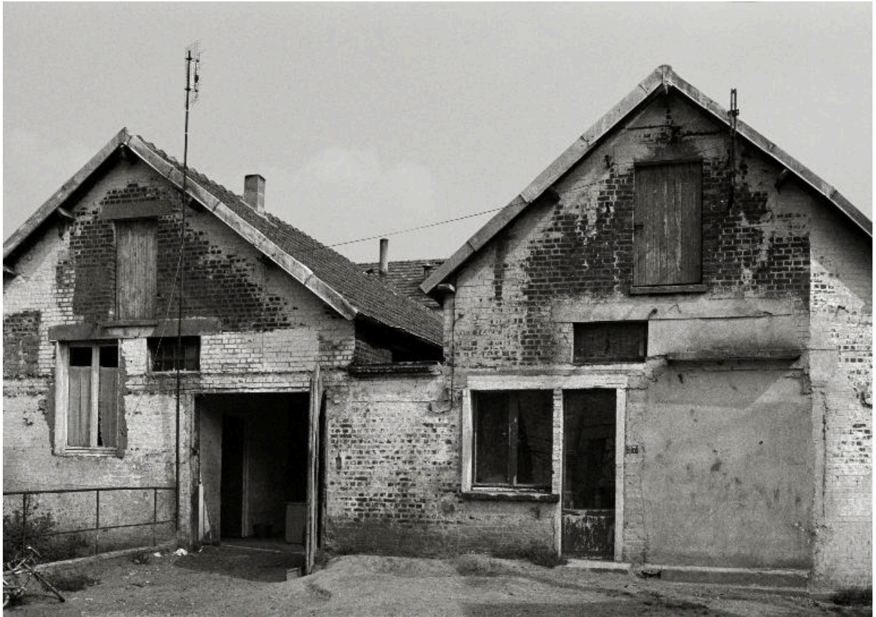
Atelier de fabrication.