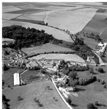
Vue aérienne, flanc est. IVR22_19888001398P