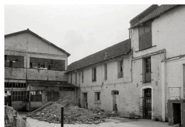
Ateliers vus depuis la cour. IVR22_19908000756Z