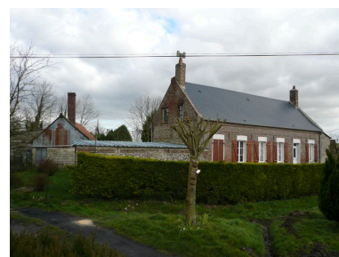
Vue générale. IVR22_20078005631NUCA