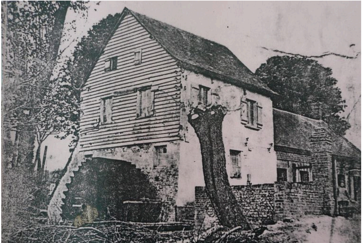
Vue du moulin au début du 20e siècle.