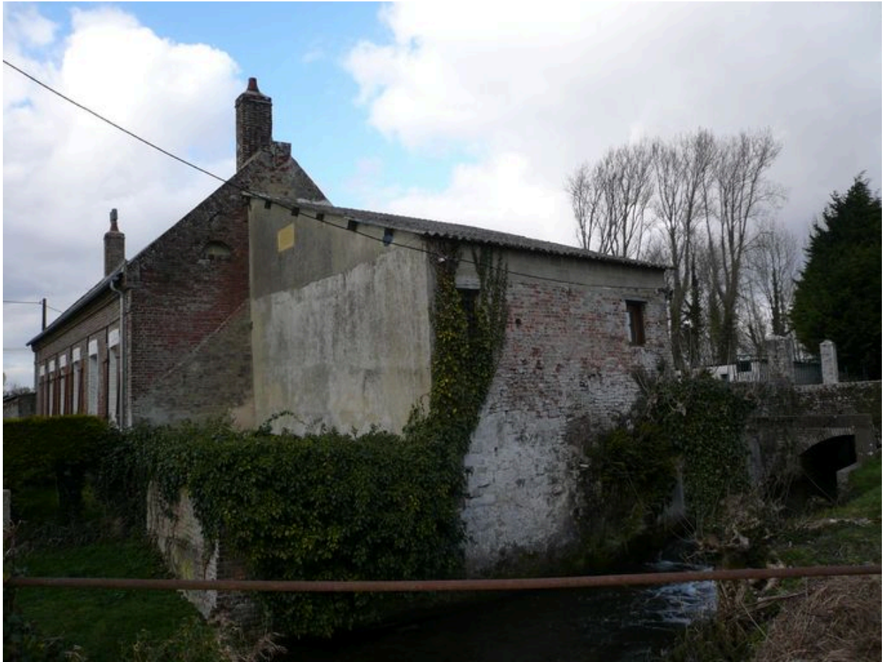
Vue du logis et de ce qu'il reste du moulin à eau.