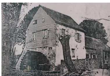
Vue du moulin au début du 20e siècle.