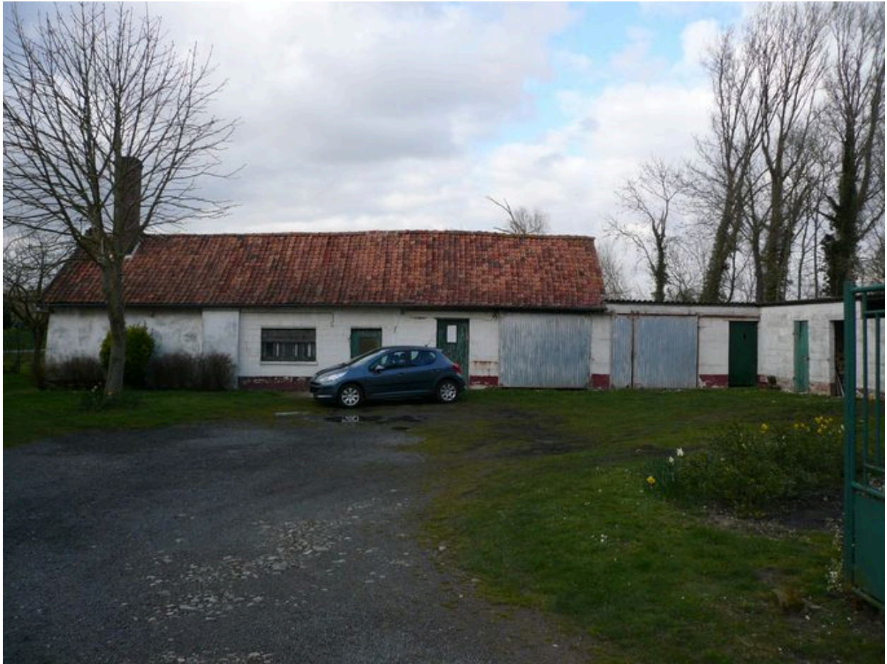
Vue des étables.