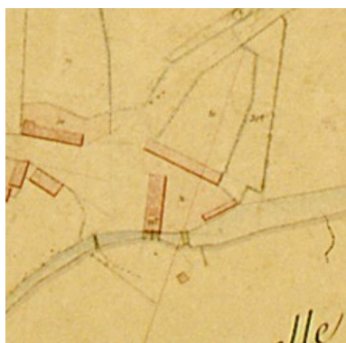
Extrait du cadastre napoléonien présentant le moulin en 1833. IVR22_20078005657XAB