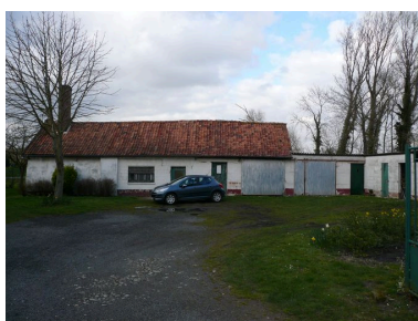
Vue des étables. IVR22_20078005633NUCA