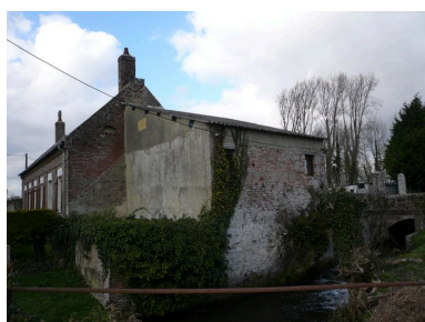
Vue du logis et de ce qu'il reste du moulin à eau.