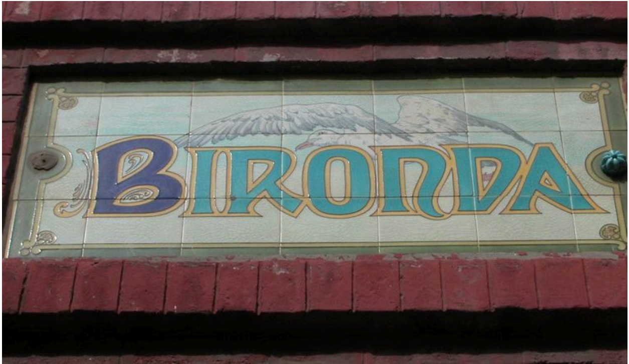
Détail de la plaque de céramique portant appellation.