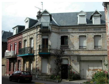
Vue d'ensemble. IVR22_20038005306NUCA