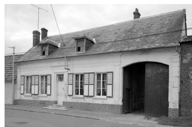
Logis. Elévation sur rue. IVR22_19846001139X