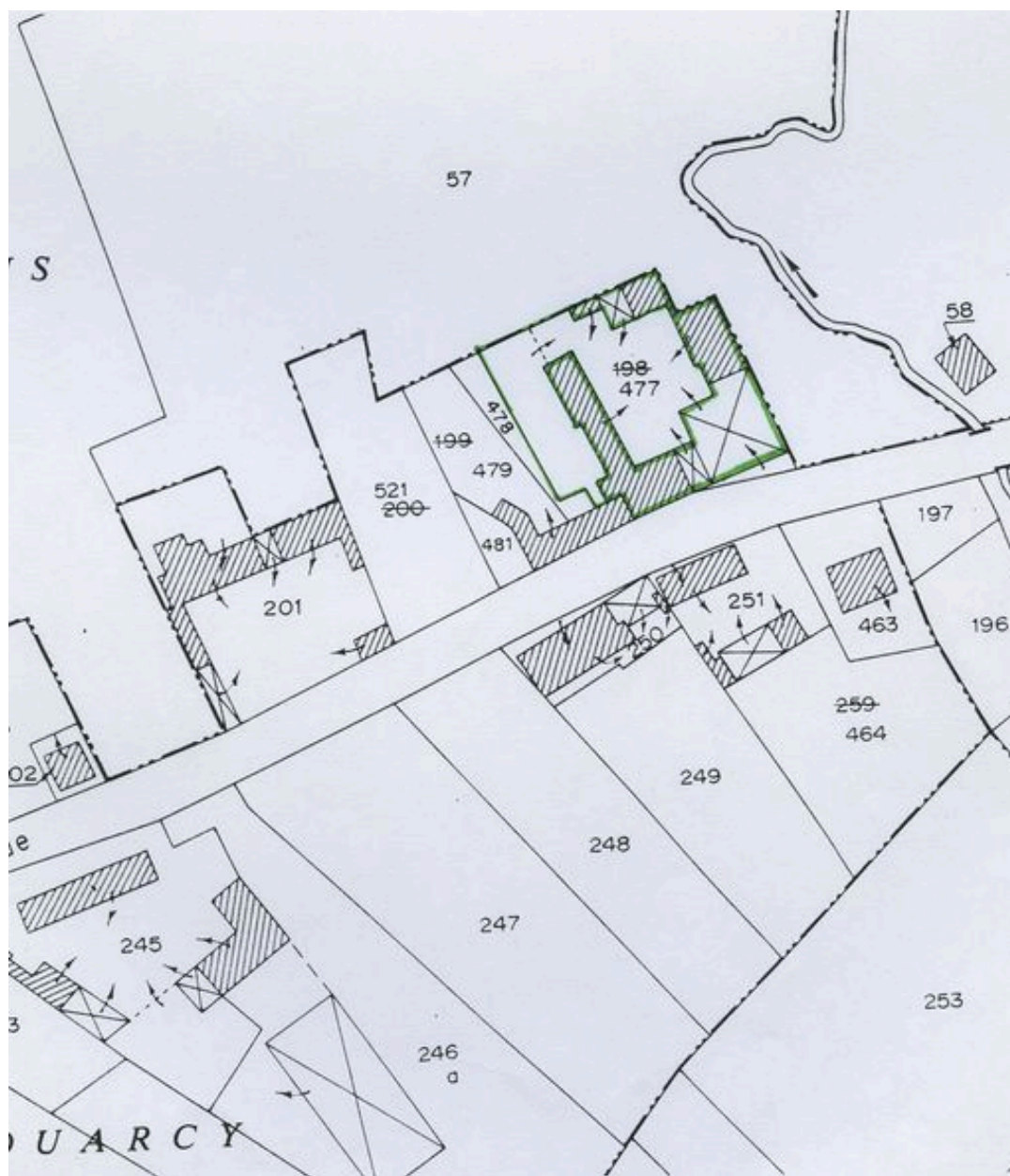
Plan de situation. Extrait du plan cadastral de 1982, section CI 477.