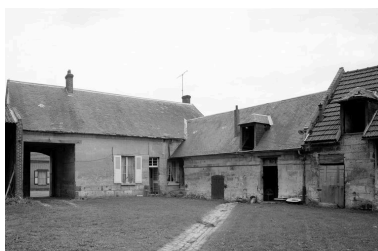
Vue partielle des bâtiments sur cour. IVR22_19846001138X