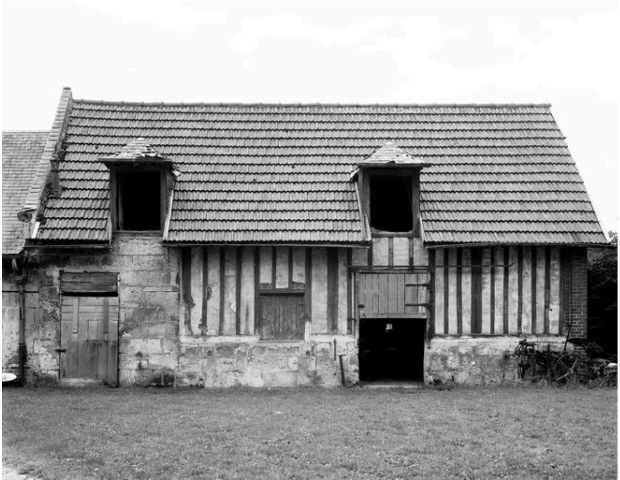
Etable. Elévation antérieure.