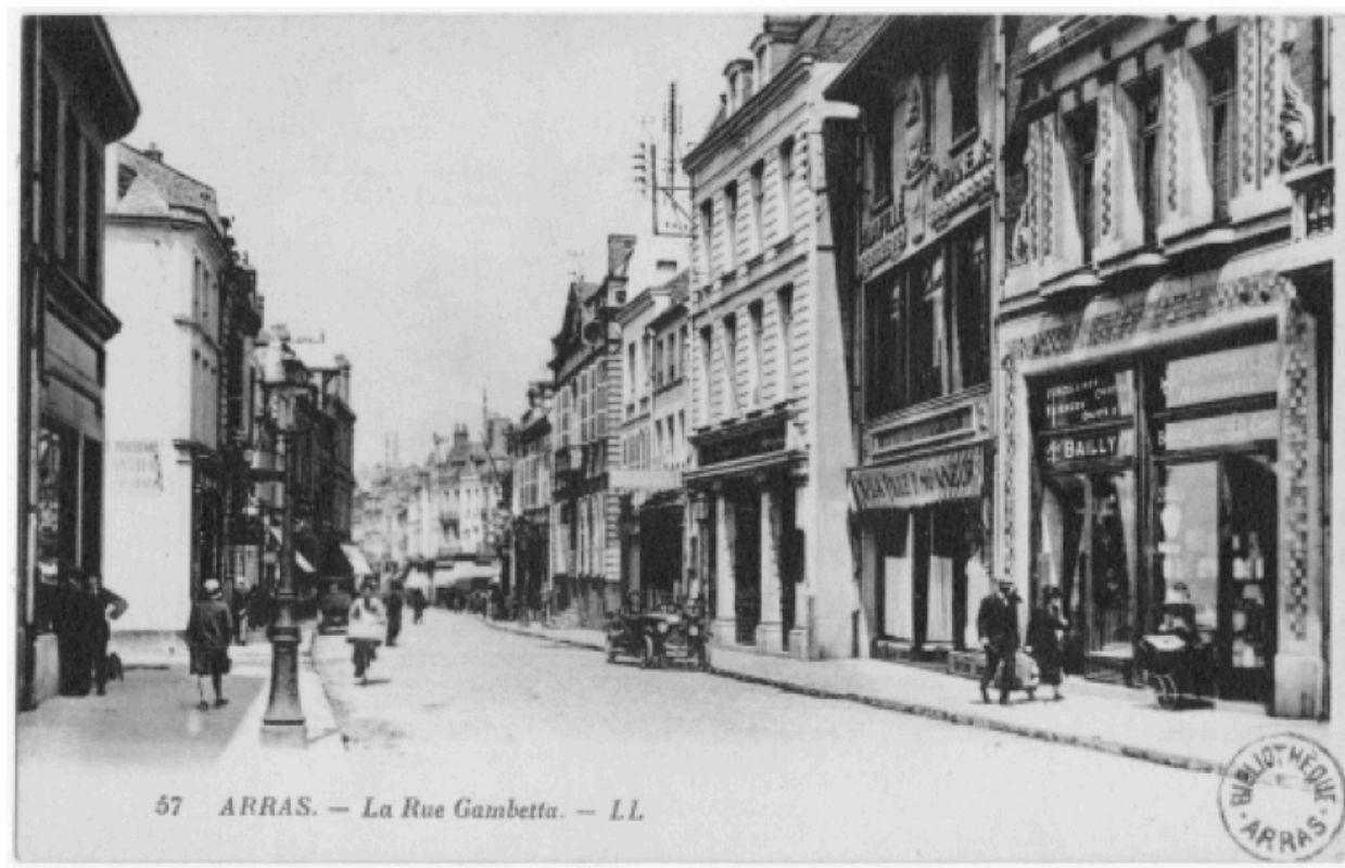
Vue des immeubles du 56 et du 60-62 rue Gambetta.