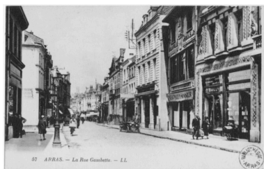
Vue des immeubles du 56 et du 60-62 rue Gambetta. IVR31_20096200319NUCB