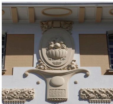
Vue sur le médaillon central orné d'une corbeille de fruits, de végétaux et de motifs semi-ovoïdes.