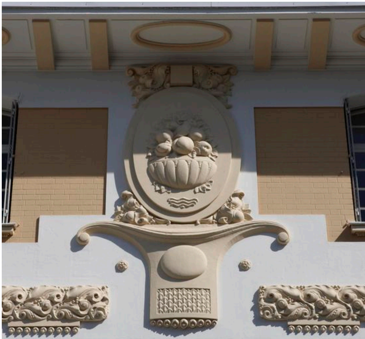
Vue sur le médaillon central orné d'une corbeille de fruits, de végétaux et de motifs semi-ovoïdes.