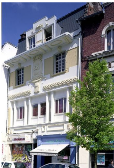
Vue générale. IVR31_20086200226XE