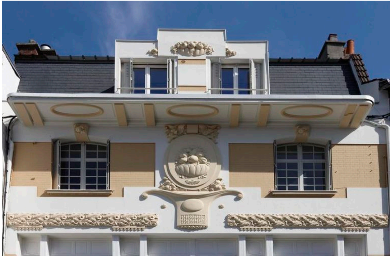
Ensemble des décors sculptés de style Art déco.