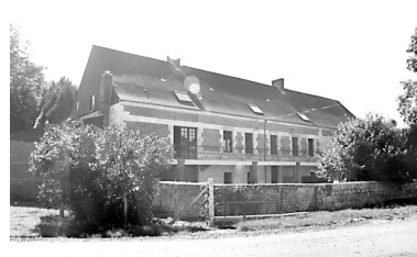
Elévation postérieure. IVR22_19980202727ZA