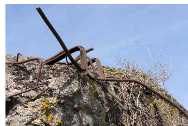
Partie est, détail du béton et des fers. Trois fers différents sont ici visibles. IVR31_20145904861NUCA