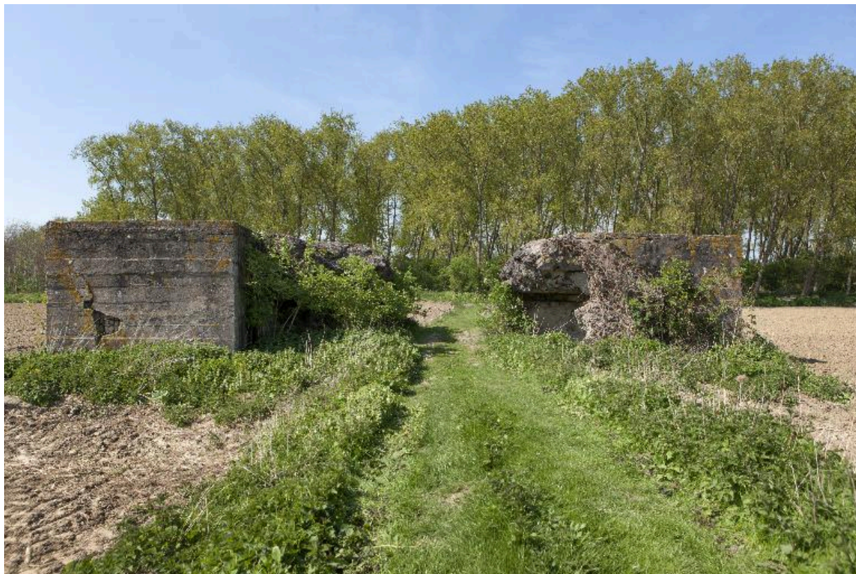
Vue générale vers le nord-ouest