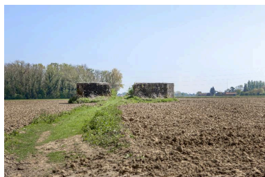
Vue générale vers le sud-est