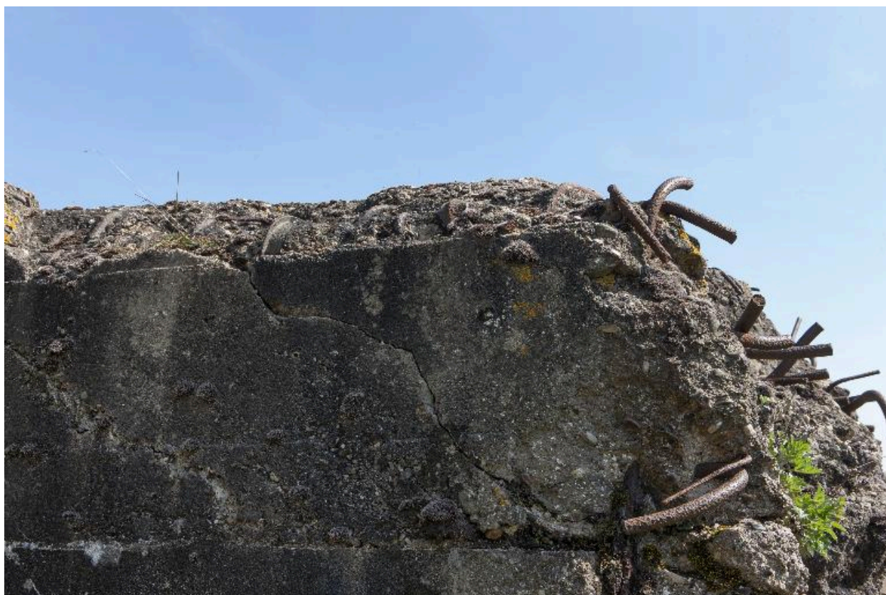
Partie est, détail du béton et des fers