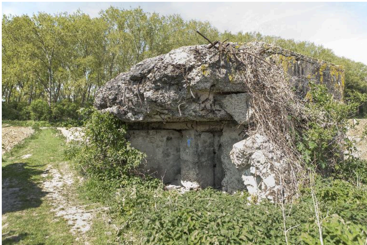
Partie est, vers le nord