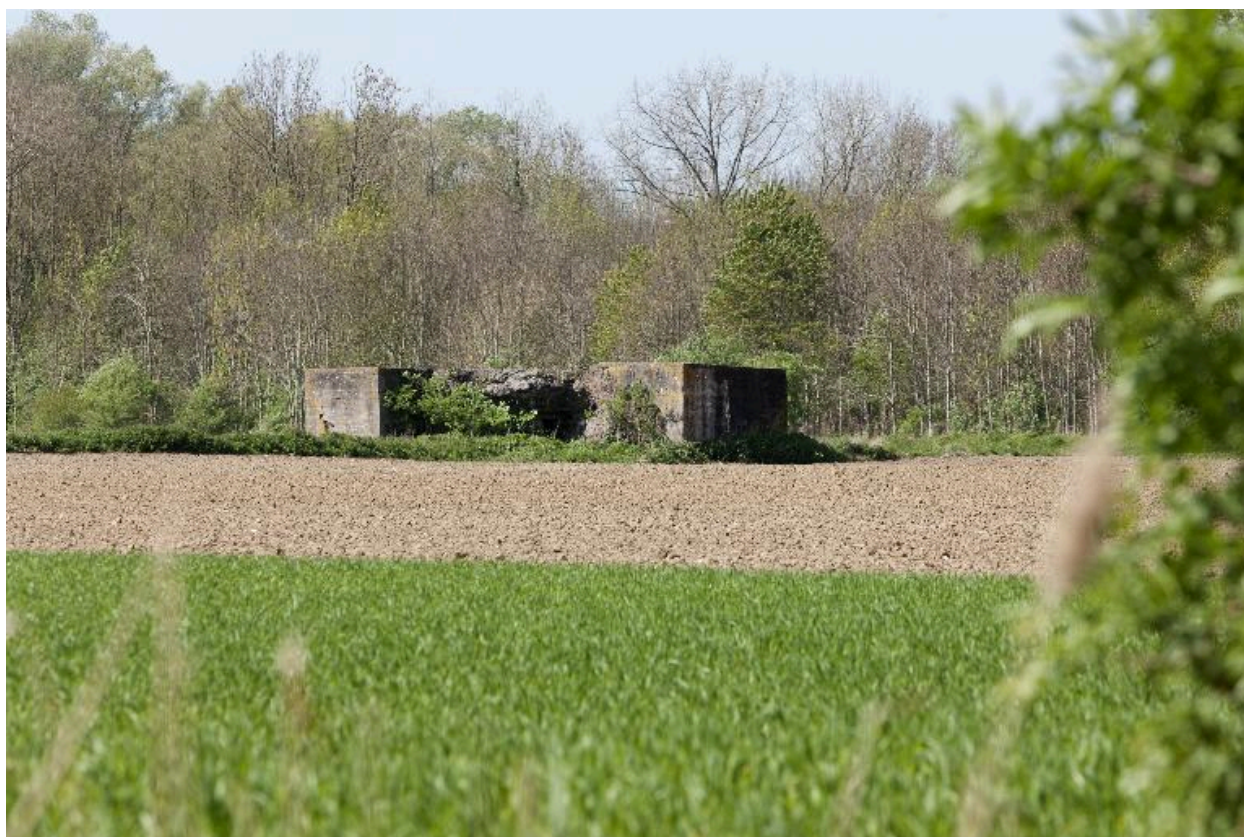
Vue générale vers le nord-est