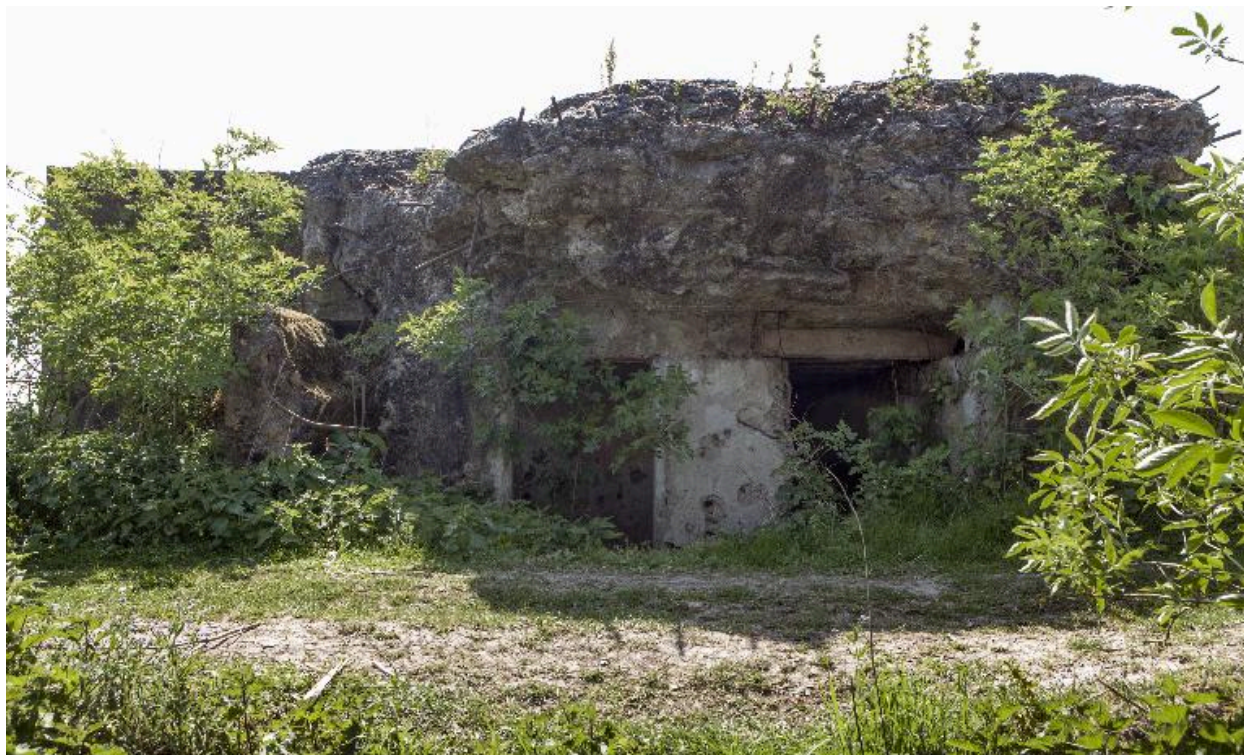
Partie ouest, vers le sud-ouest