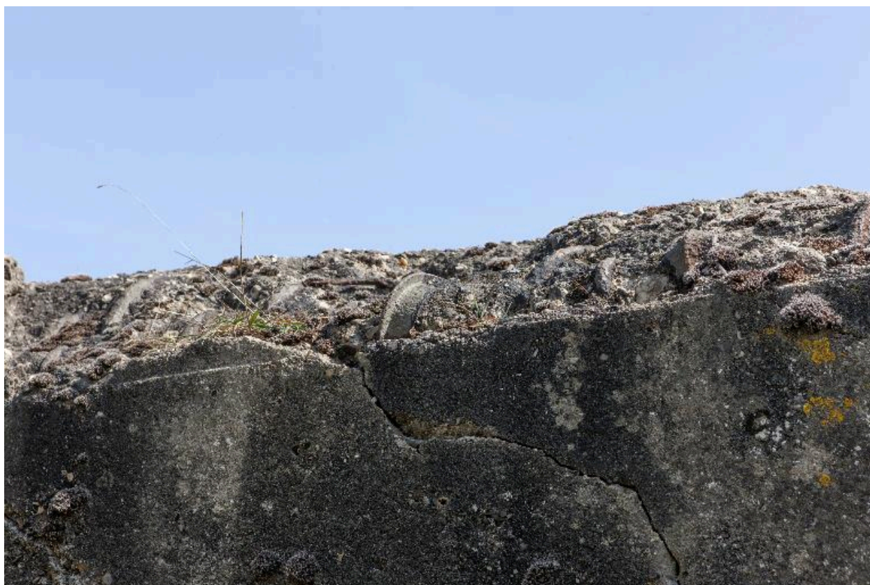
Partie est, détail du béton et des fers