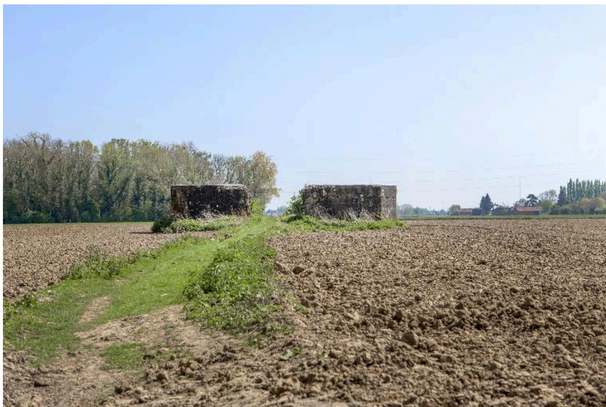
Vue générale vers le sud-est