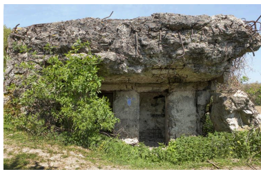
Partie est, vers le nord-est