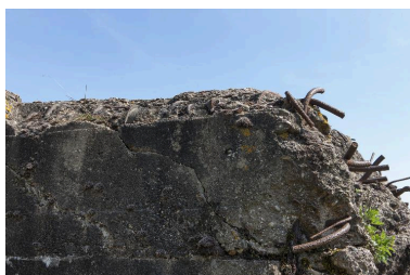
Partie est, détail du béton et des fers