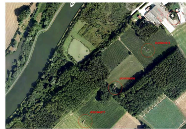
Position de l'édifice (IA59004877) sur une orthophotographie de 2009 IVR32_20175900533NUCA