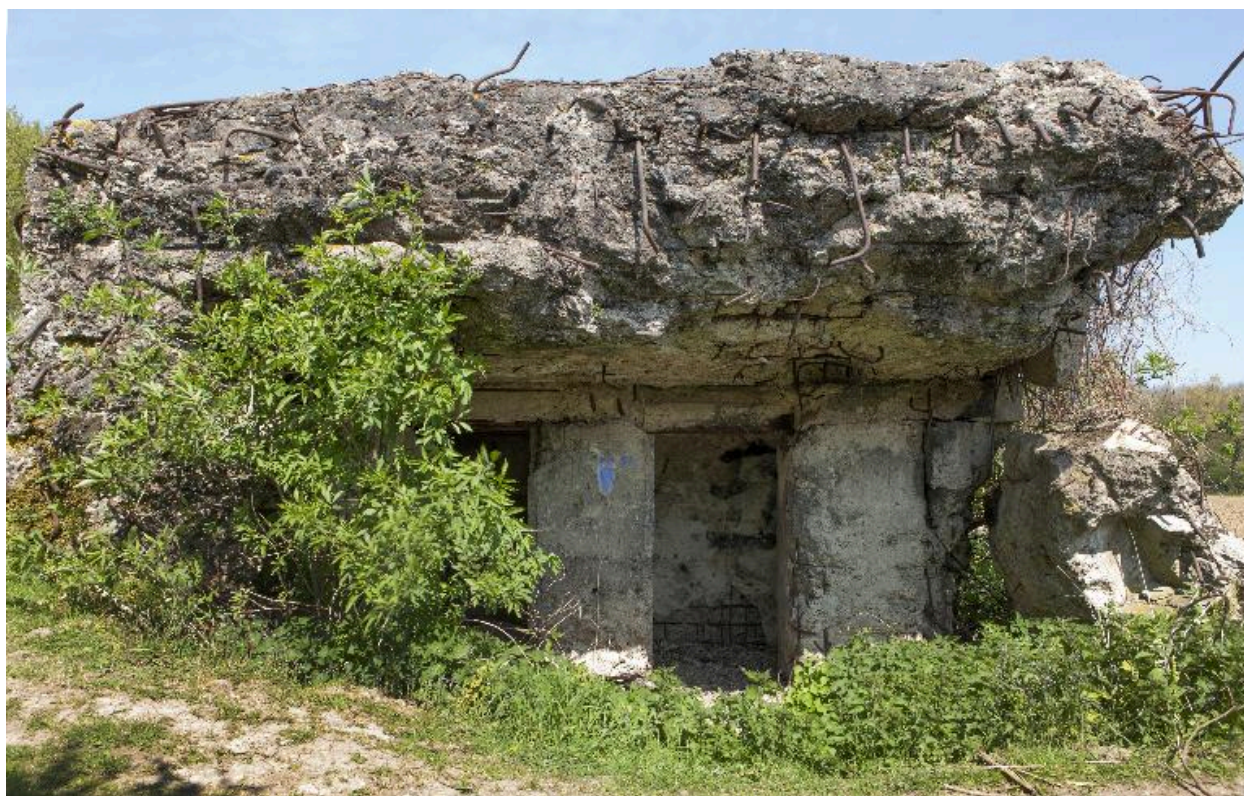
Partie est, vers le nord-est