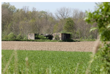
Vue générale vers le nord-est