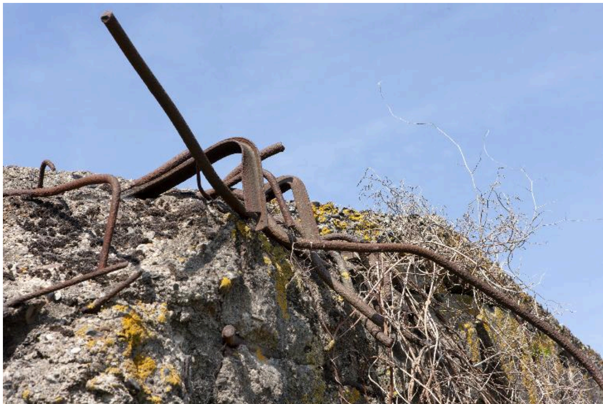
Partie est, détail du béton et des fers. Trois fers différents sont ici visibles.