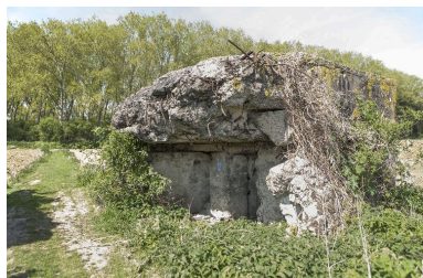
Partie est, vers le nord IVR31_20145904852NUCA