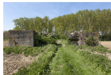
Vue générale vers le nord-ouest IVR31_20145904858NUCA