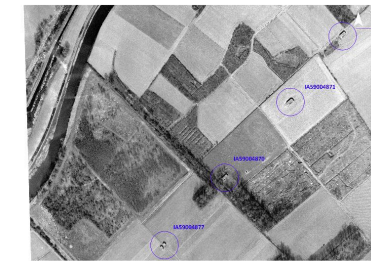
Position de l'édifice (en bas) sur photographie aérienne du 13 mars 1965 (IGN, Geoportail). IVR32_20175900532NUCA

Extrait du plan "Wotan Stellung" et position de l'édifice (en bas), sur la seconde ligne de défense de la Deûle IVR32_20175900531NUCA