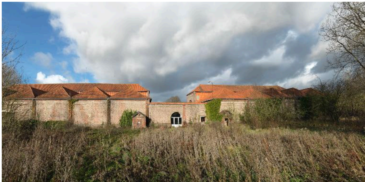
Entrepôts à jute de l'usine Saint Frères d'Harondel.