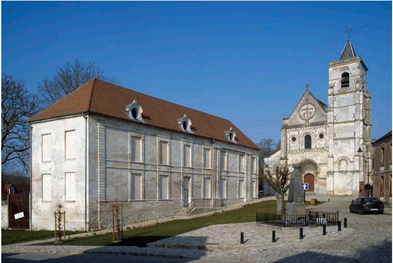
Ancienne abbaye Notre-Dame du Pré.