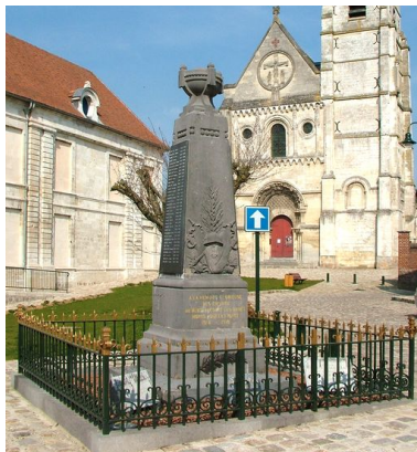
Monument aux morts, signé CAPRON/A DOULLENS, place de l'Eglise, vers 1920.