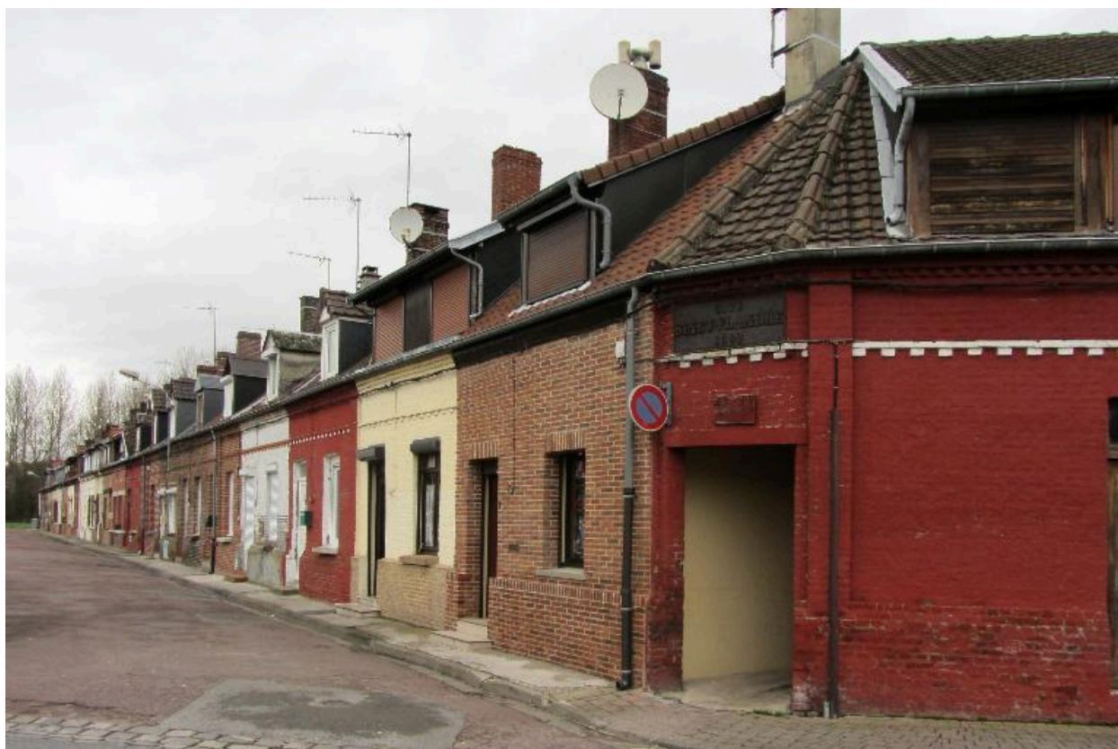
Cité ouvrière Binet-Flandre.