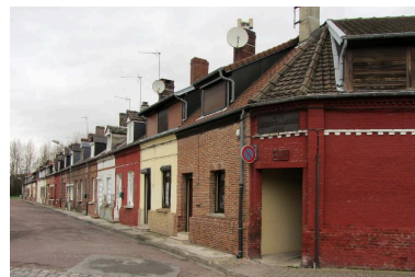
Cité ouvrière Binet-Flandre. IVR22_20128005319NUC2A