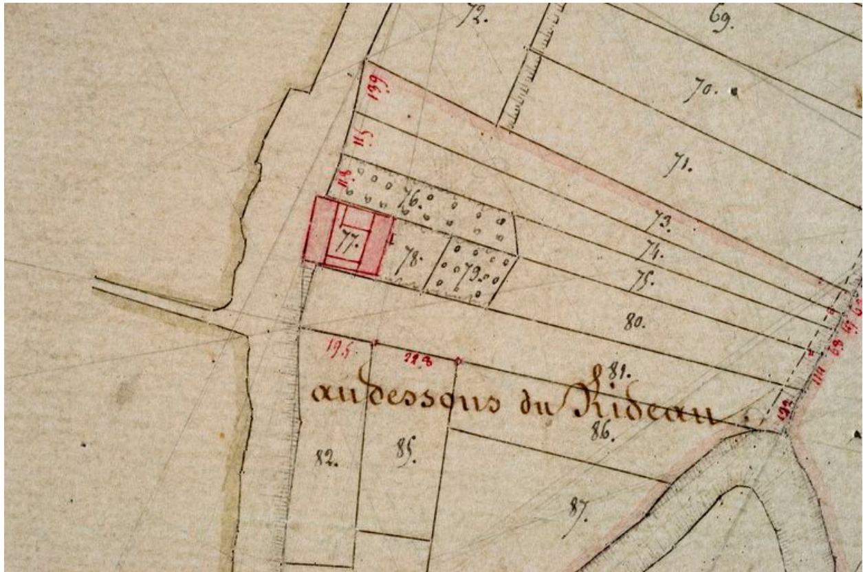
Section C (détail) : lieu-dit Au-dessous du rideau, par Sannier et Desgardin, 1832 (AD Somme ; 3P 1281/5).