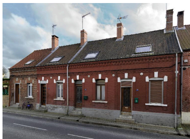
Logements ouvriers, 73 à 79 rue Eugène-Létocart. IVR22_20148000104NUC2A