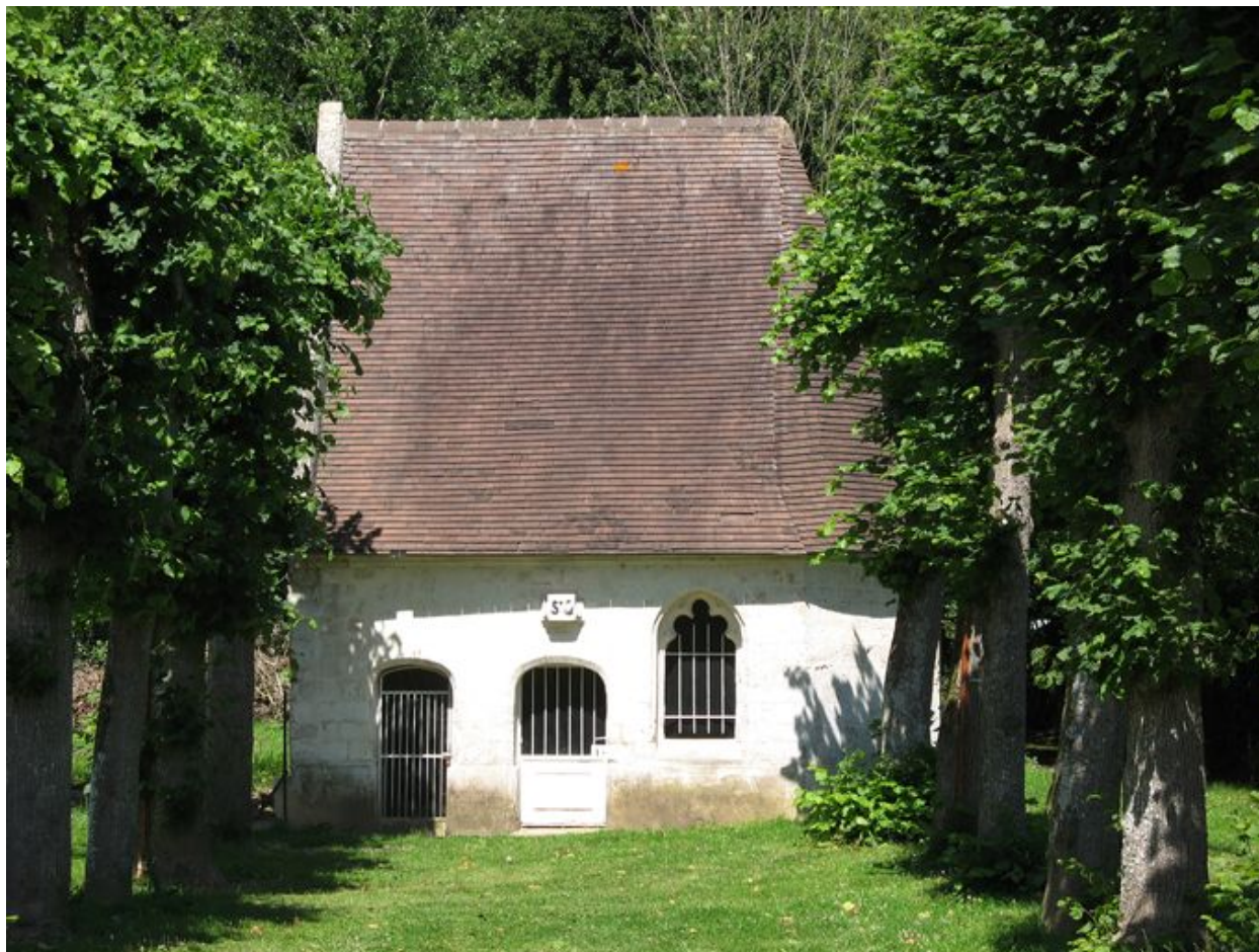
La chapelle Saint-Gautier.