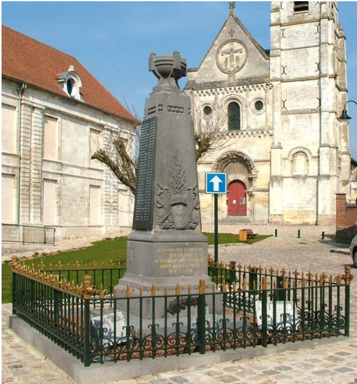
Monument aux morts, signé CAPRON/A DOULLENS, place de l'Eglise, vers 1920.