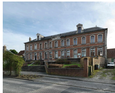
L'école primaire de garçons.