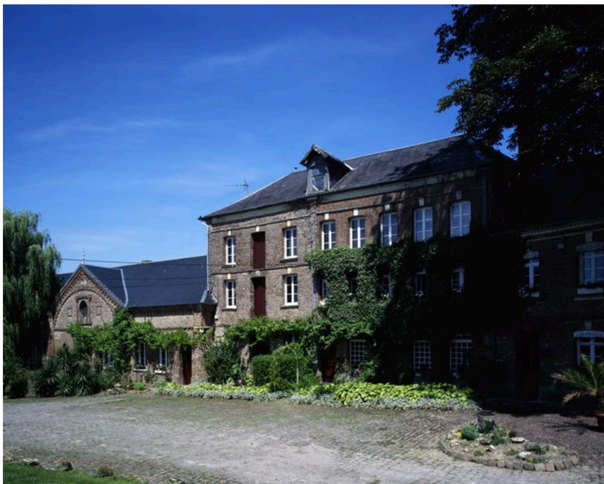
Ancien moulin à blé de l'Abbaye.