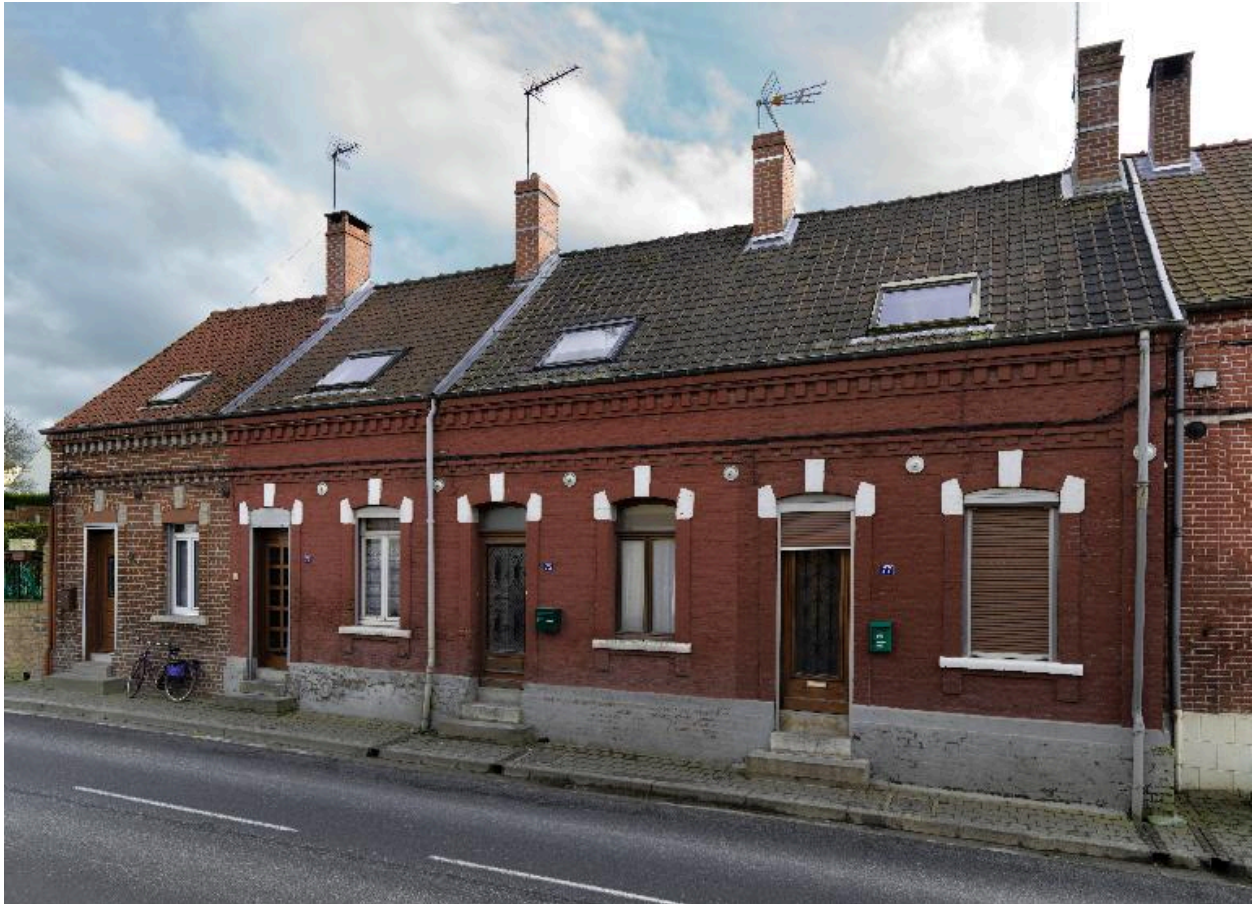
Logements ouvriers, 73 à 79 rue Eugène-Létocart.