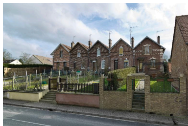
Cité ouvrière Saint Frères (61 à 69 rue Eugène-Létocart). IVR22_20148000103NUC2A