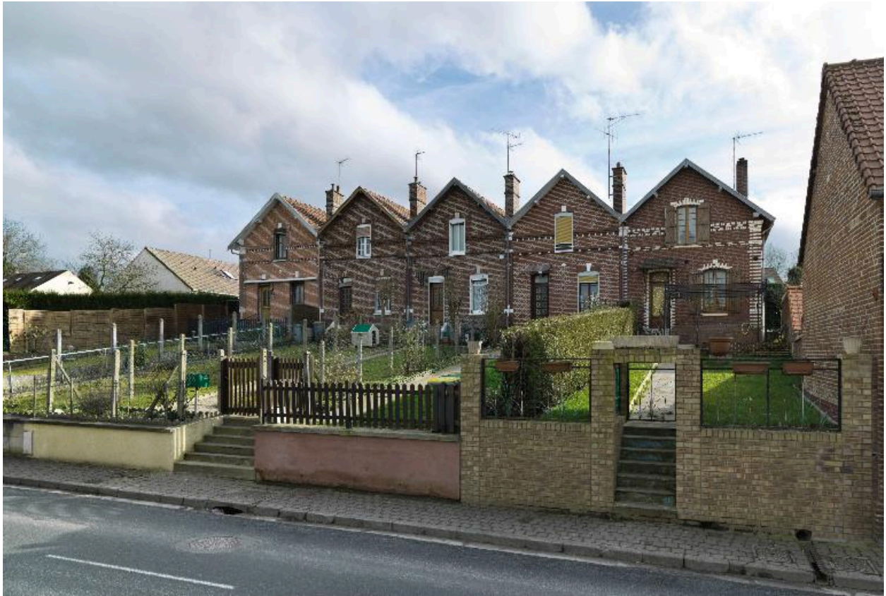
Cité ouvrière Saint Frères (61 à 69 rue Eugène-Létocart).