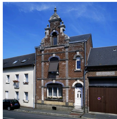
Maison, 5 rue Léon- Blum, 1er quart 20e siècle. IVR22_20088000145XA