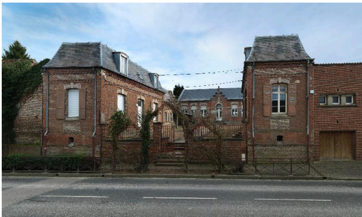
L'école primaire de filles.