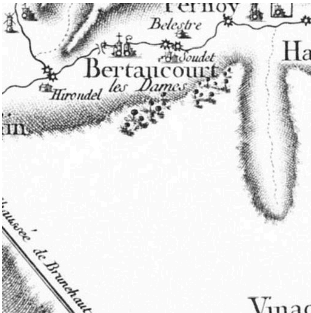
Détail de la carte de Cassini, par Le Roy le jeune, 1757.