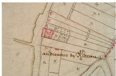
Section C (détail) : lieu-dit Au-dessous du rideau, par Sannier et Desgardin, 1832 (AD Somme ; 3P 1281/5).

Phot. Thierry Lefébure IVR22_20088000011VA