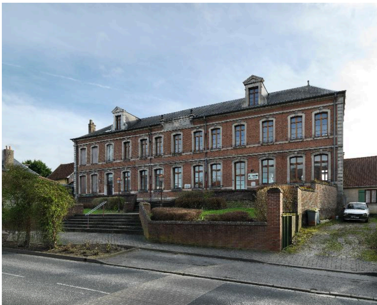
L'école primaire de garçons.