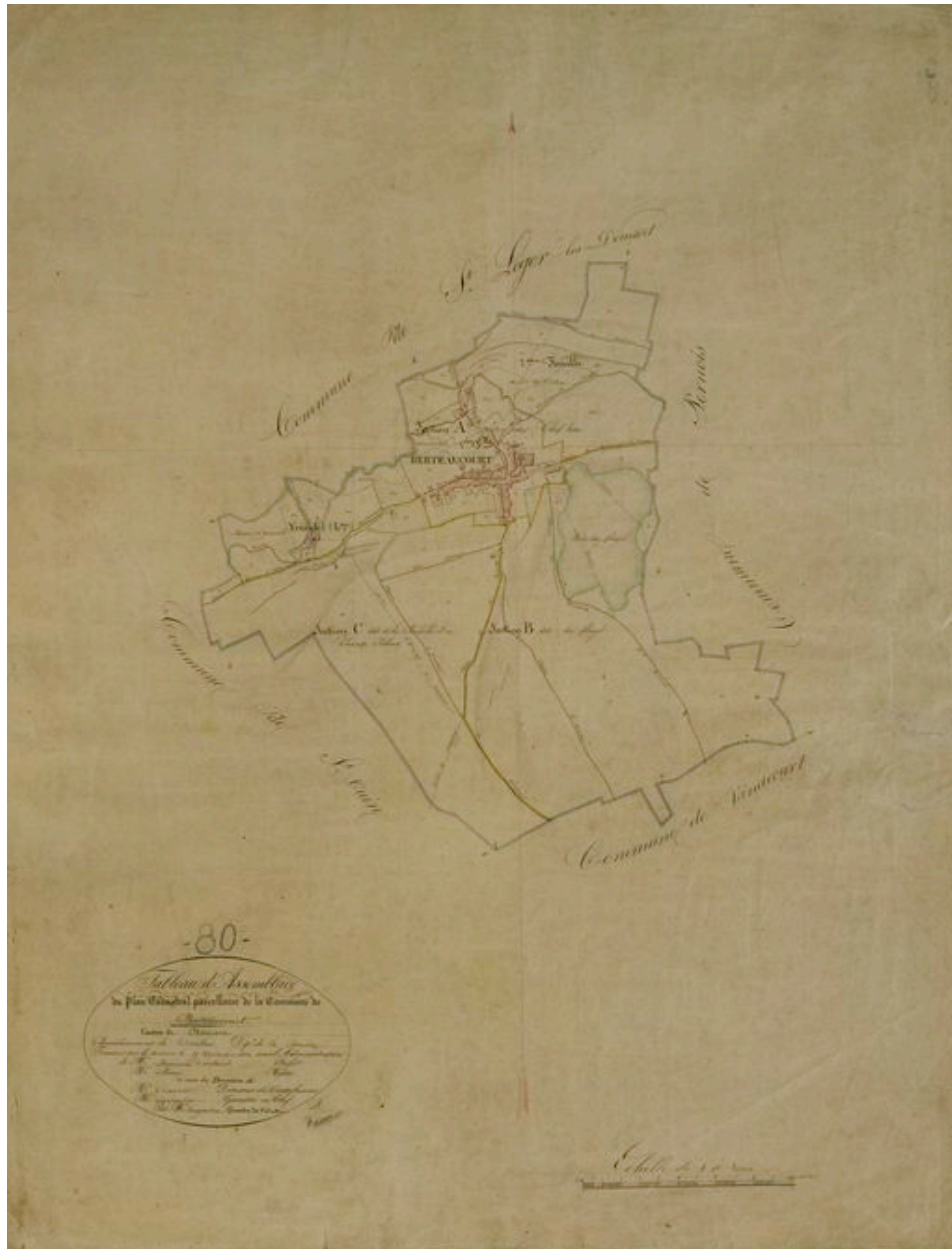
Tableau d'assemblage, par Desgardin, 1832 (AD Somme ; 3P 1281/1).