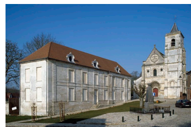
Ancienne abbaye Notre-Dame du Pré.