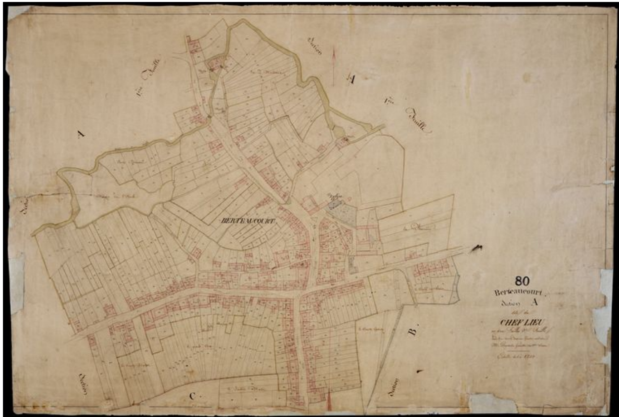
Section A2 : le village, par Sannier et Desgardin, 1832 (AD Somme ; 3P 1281/3).