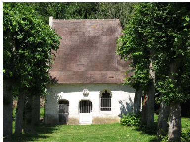
La chapelle Saint-Gautier. IVR22_20088015004NUCA