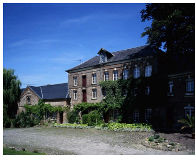
Ancien moulin à blé de l'Abbaye.