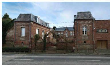
L'école primaire de filles. IVR22_20148000102NUC2AQ