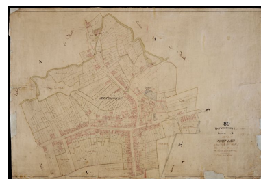
Section A2 : le village, par Sannier et Desgardin, 1832 (AD Somme ; 3P 1281/3).

IVR22_20088000010NUCA