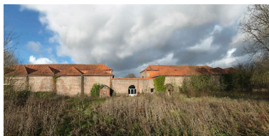
Entrepôts à jute de l'usine Saint Frères d'Harondel. IVR22_20128001258NUC2AQ