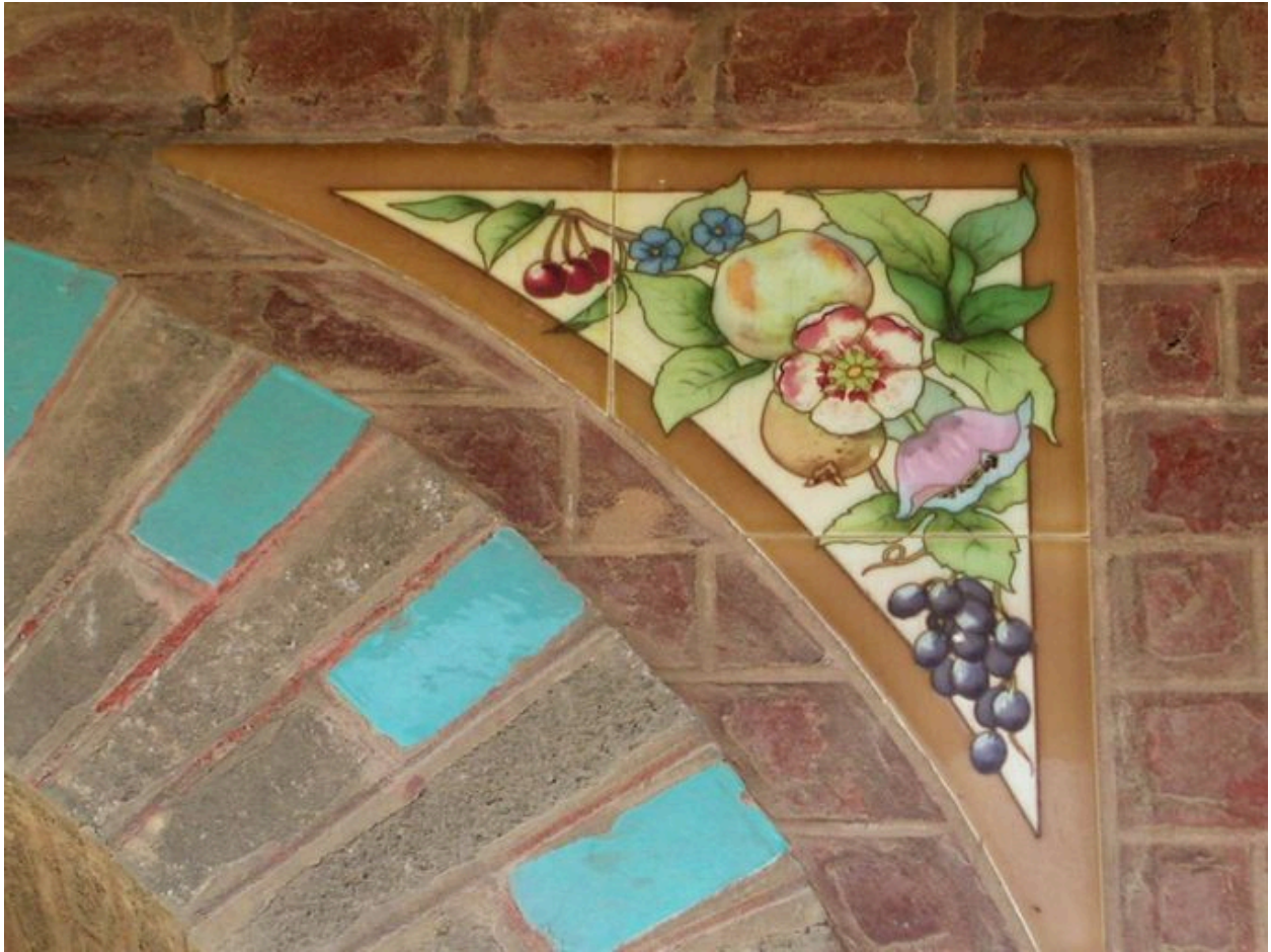
Détail du décor de céramique situé au-dessus de la porte d'entrée.