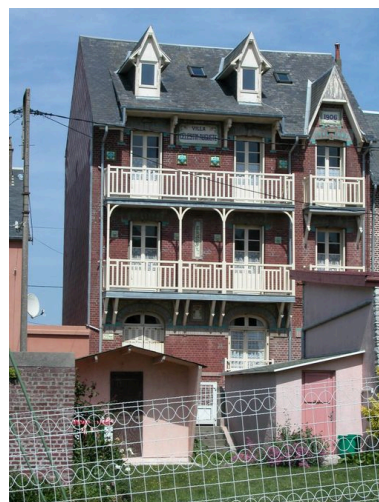
Vue d'ensemble depuis la rue de la Brise.

Phot. Elisabeth Justome IVR22_20048001500NUCA