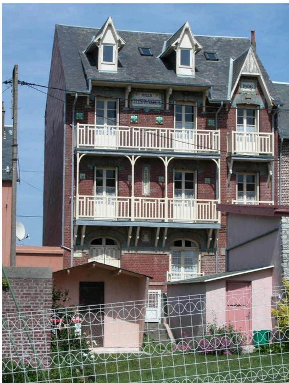
Vue d'ensemble depuis la rue de la Brise.