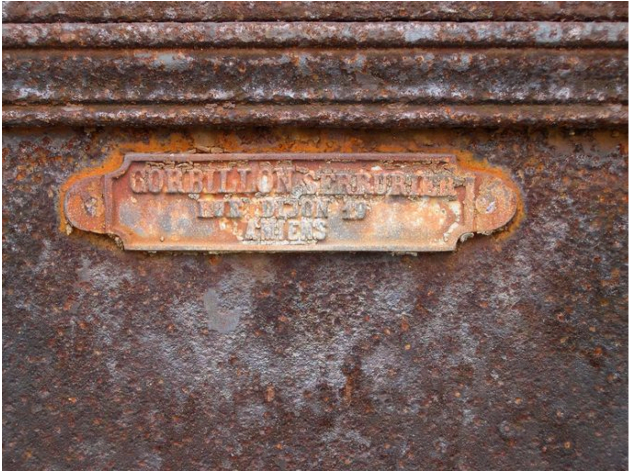
Détail sur la signature : Gorrillon(serrurier).