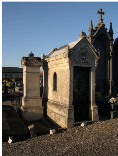
Vue de situation. IVR22_20078010618NUCA