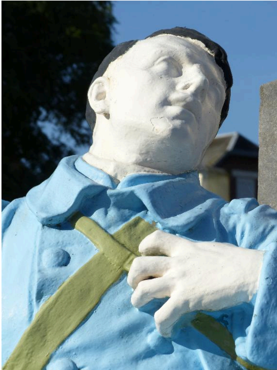
Vue de détail sur le visage du soldat.