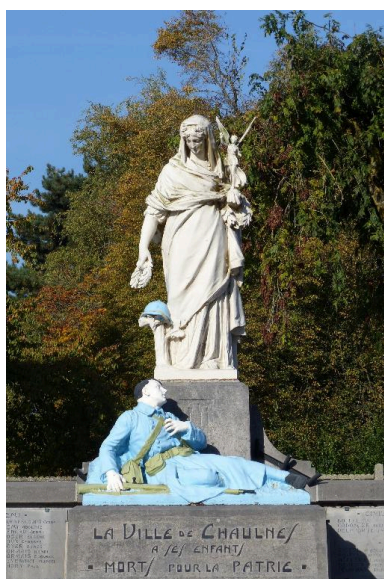
Vue générale. IVR32_20168006252NUCA