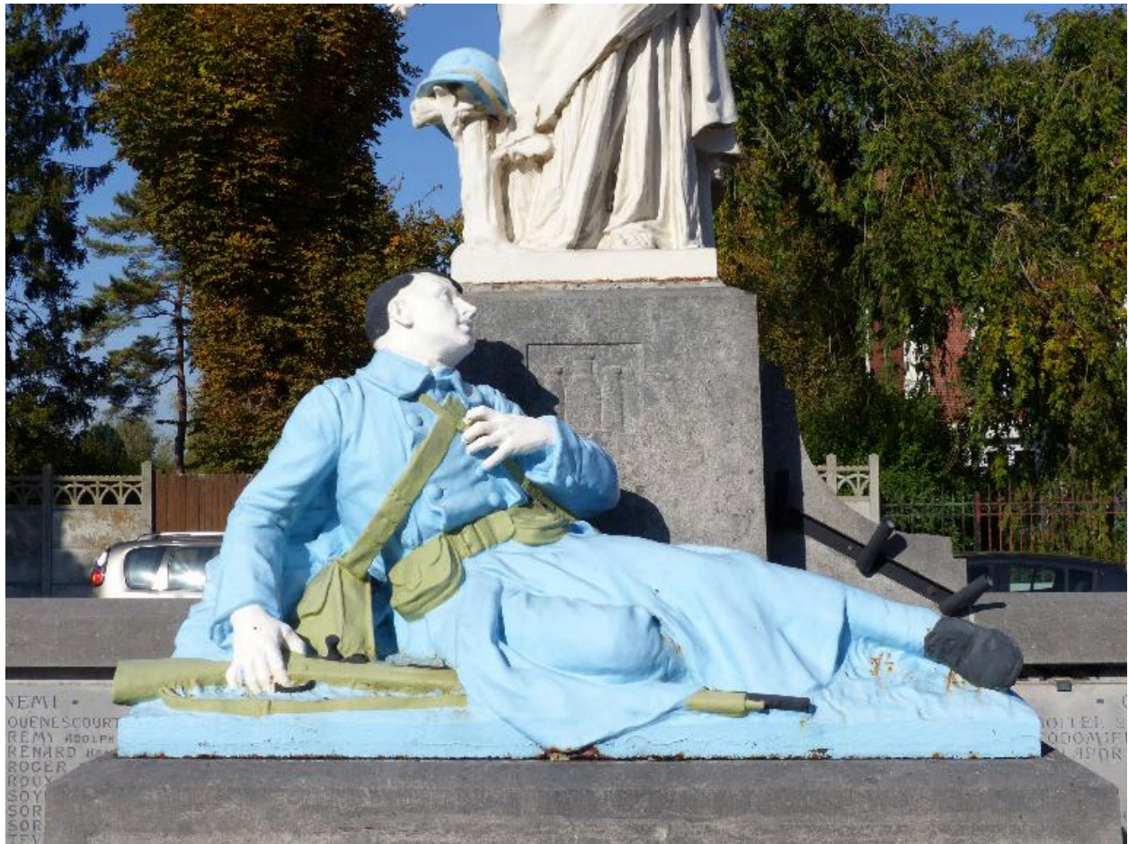
Vue de détail sur le soldat.