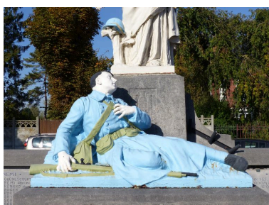
Vue de détail sur le soldat.