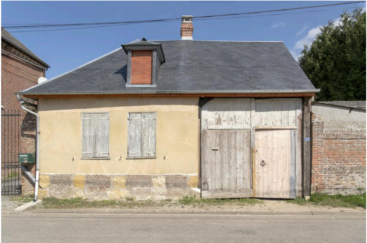
Façade de logis et entrée charretière sur rue (ancienne maison de serger?), n°22 rue Principale, vue depuis l'ouest.