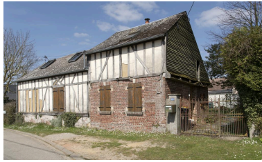
Logis sur rue avec traitement ornemental du pan de bois au-dessus d'une baie, n°64 rue Principale, vue depuis le sud-ouest.