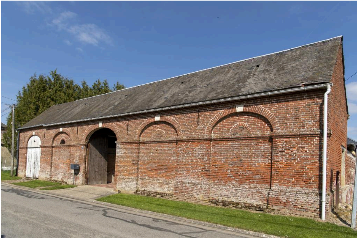
Façade de grange et entrée charretière sur rue, rythmée par des arcs surbaissés, n°18 rue Principale, vue depuis l'ouest.