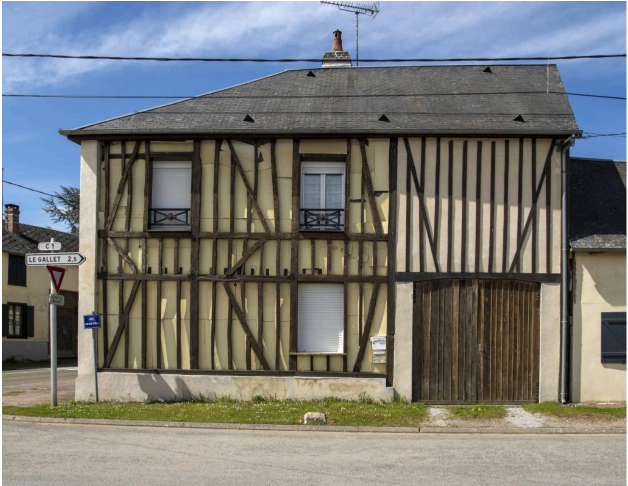
Ancien café, n°9 route de Rouen, vue depuis l'est, rue Principale.