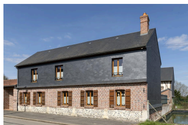
Logis sur rue avec essentage en ardoise et solin en moellons de silex et pierre de taille, n°4 rue Principale, vue depuis l'ouest.