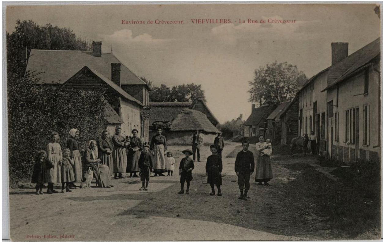
Viefvillers (Oise). La rue de Crèvecœur, carte postale, éd. Debray-Bollez, [1er quart du 20e siècle] (coll. part.).