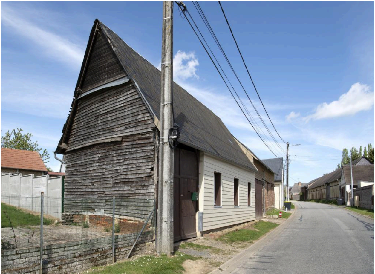
Pignon avec un essentage ancien en clins de bois, n°9 rue Principale, vue depuis le sud-est.