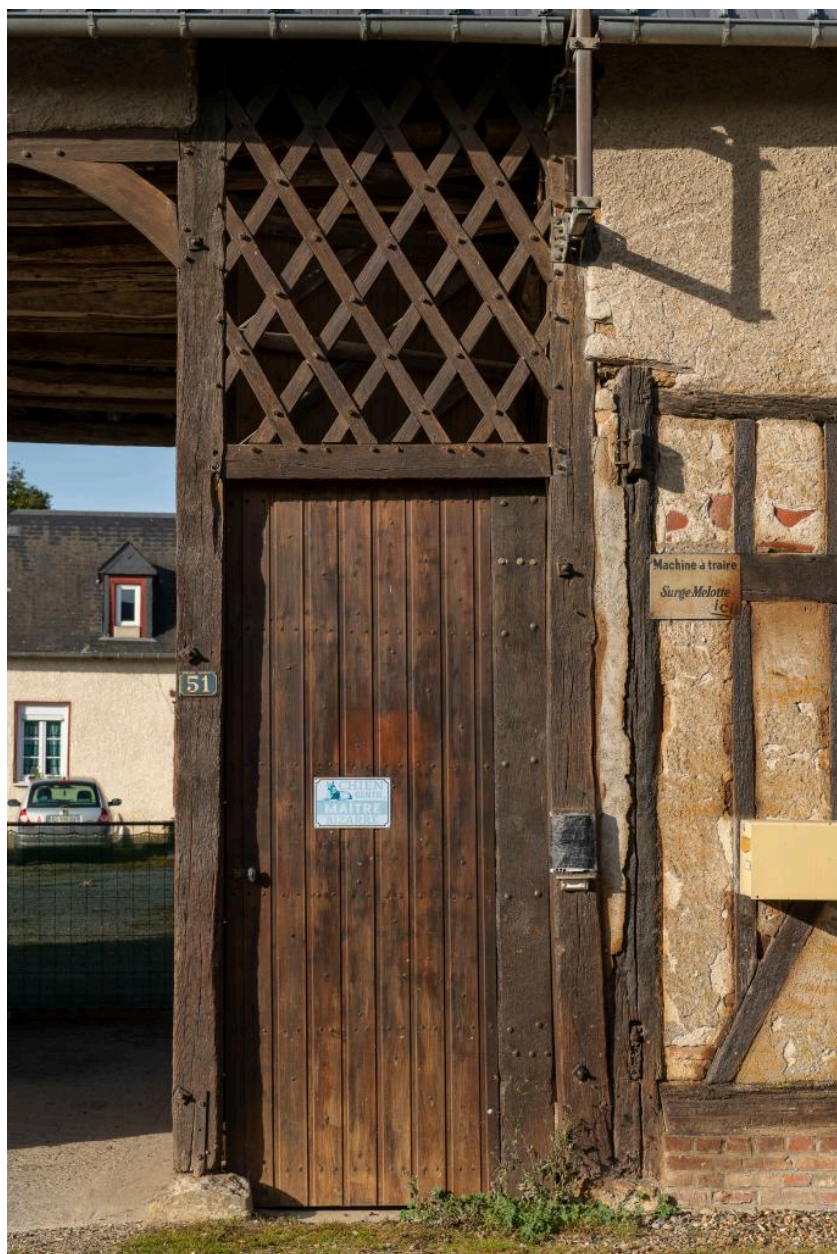
Détail de la porte piétonne avec imposte ajourée, n°51 rue Principale, vue depuis l'est.