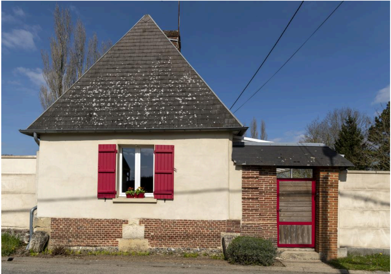
Pignon de logis sur rue, n°10 rue Principale, vue depuis l'ouest.