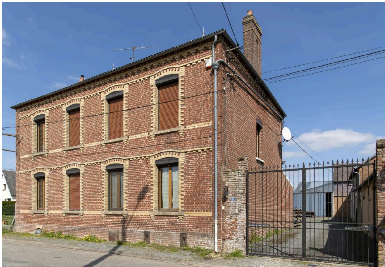
Logis de ferme sur rue, 1er quart 20e siècle, n°24 rue Principale, vue depuis l'ouest.