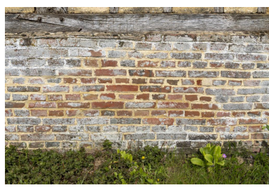
Solin en brique de la grange, n°8 rue Principale. L'irrégularité de grain, de ton et de forme