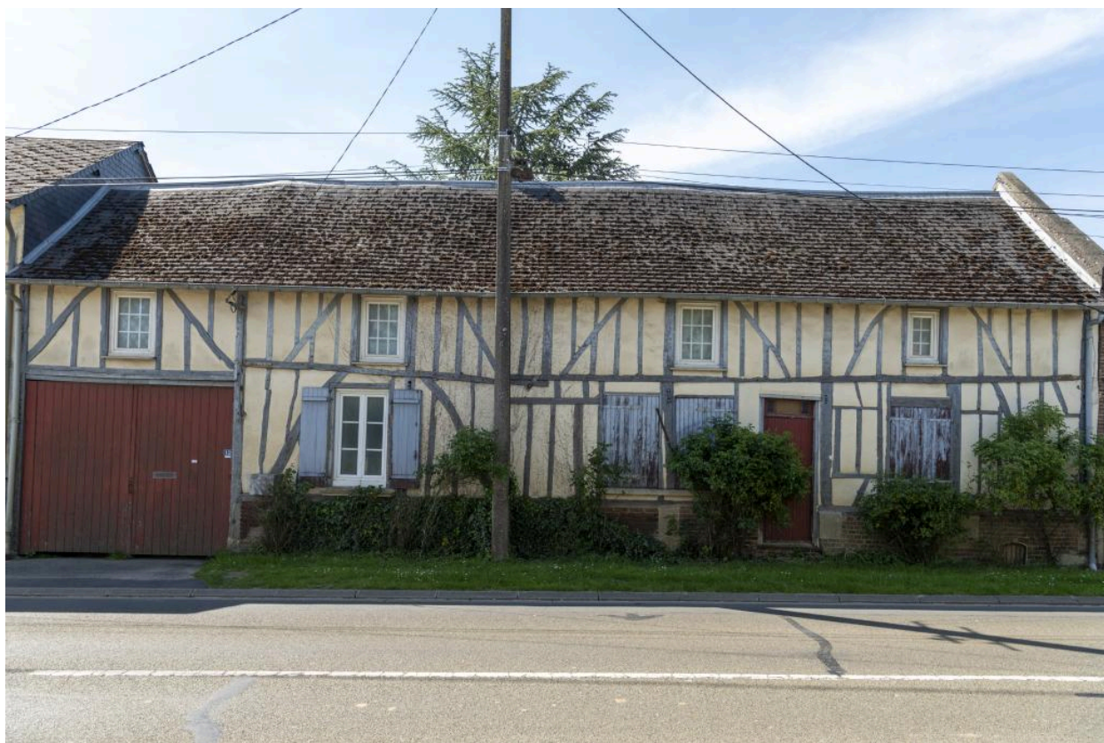
Logis avec entrée charretière sur rue, n°12 route de Rouen, vue depuis le nord.