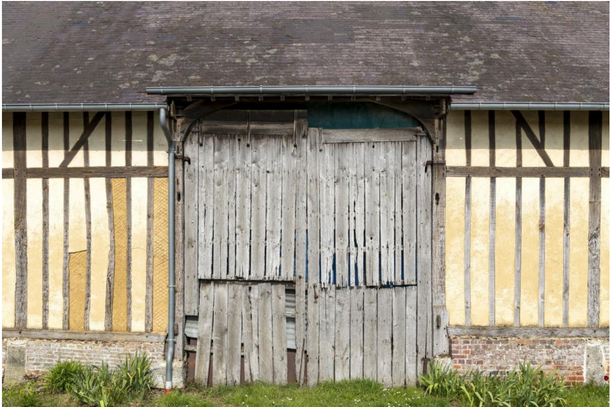
Porte de l'entrée charretière de la grange, n°8 rue Principale, vue depuis l'ouest.