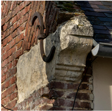
Détail du corbeau taillé en pierre, n°63 rue Principale.