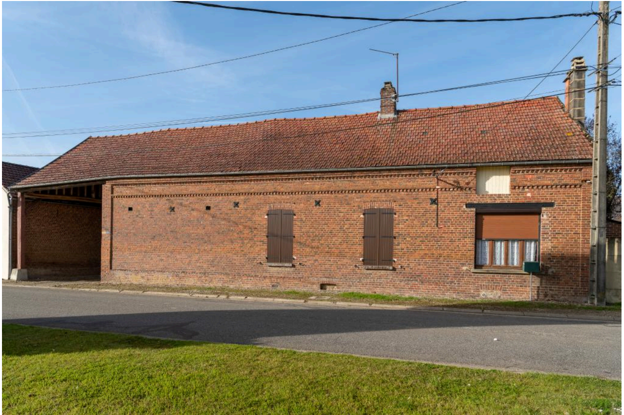
Logis en brique avec entrée charretière, n°59 rue Principale, vue depuis l'est.