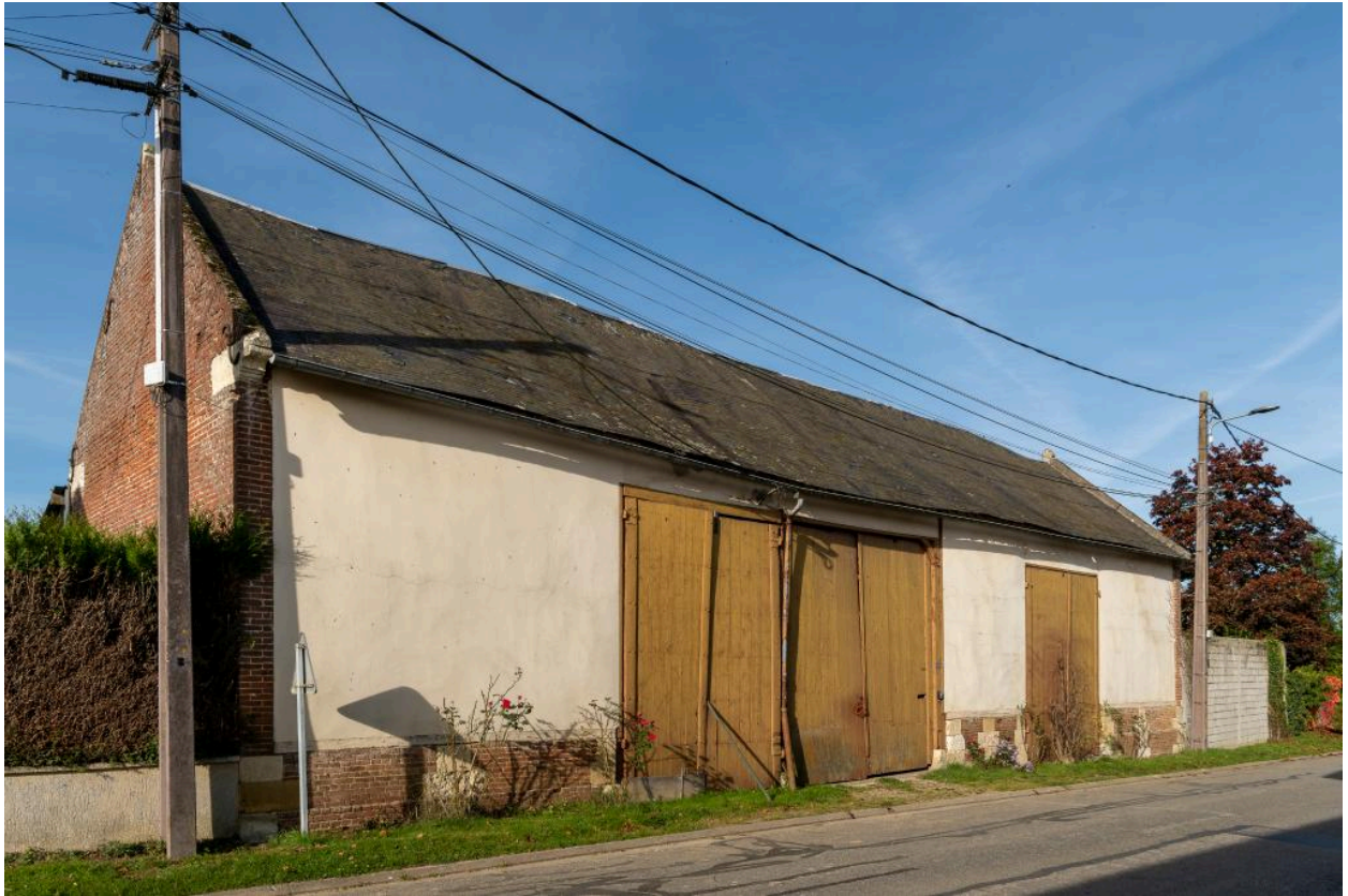
Grange et entrée charretière, n°63 rue Principale, vue depuis le sud-est.