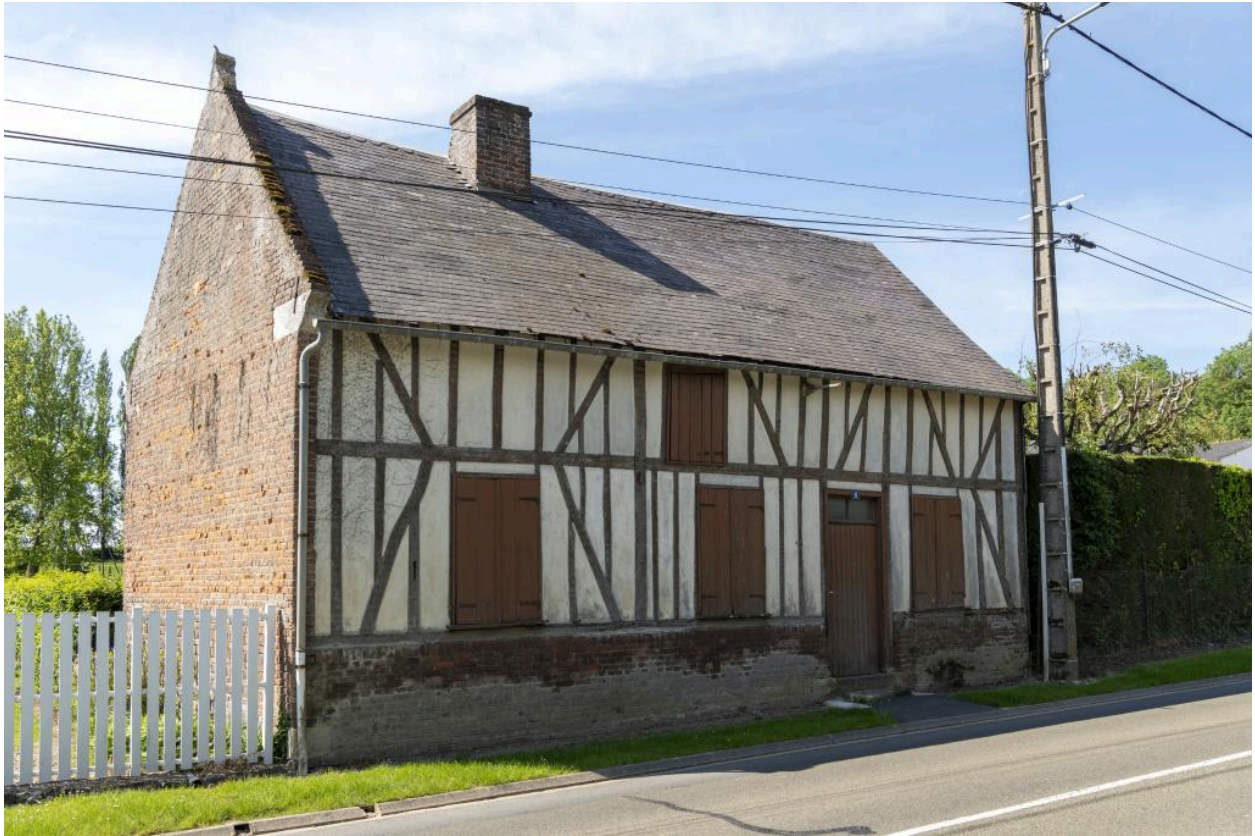
Logis sur rue avec comble, n°8 route de Rouen, vue depuis le nord-est.