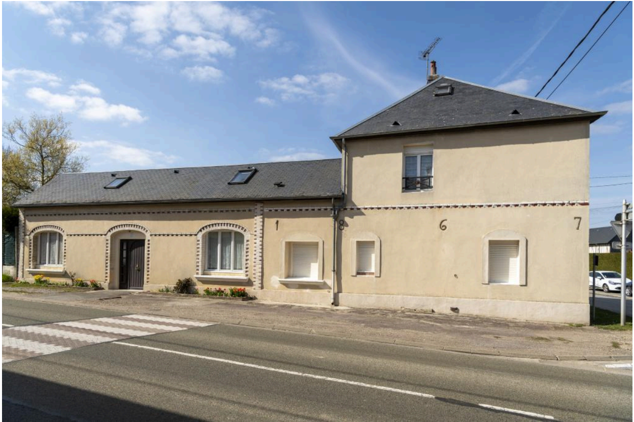
Ancien café, date portée: "1867", n°9 route de Rouen, vue depuis le sud.