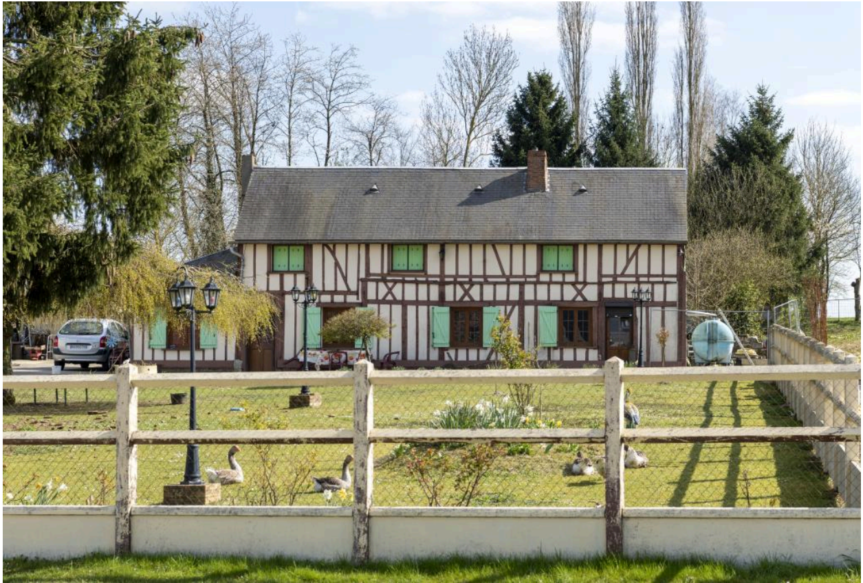
Logis d'une ancienne ferme, n°16 route de Rouen, vue depuis le nord.