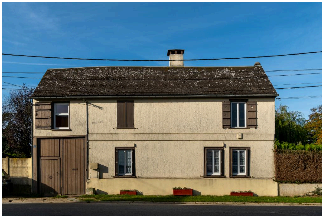
Ancienne maison de serger (?), n°61 rue Principale, vue depuis l'est.