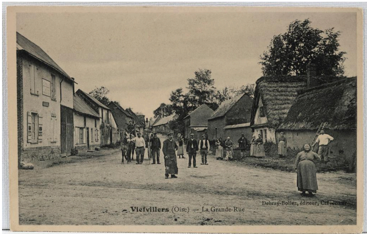
Viefvillers (Oise). La Grande rue, carte postale, éd. Debray-Bollez, [1er quart du 20e siècle] (coll. part.).