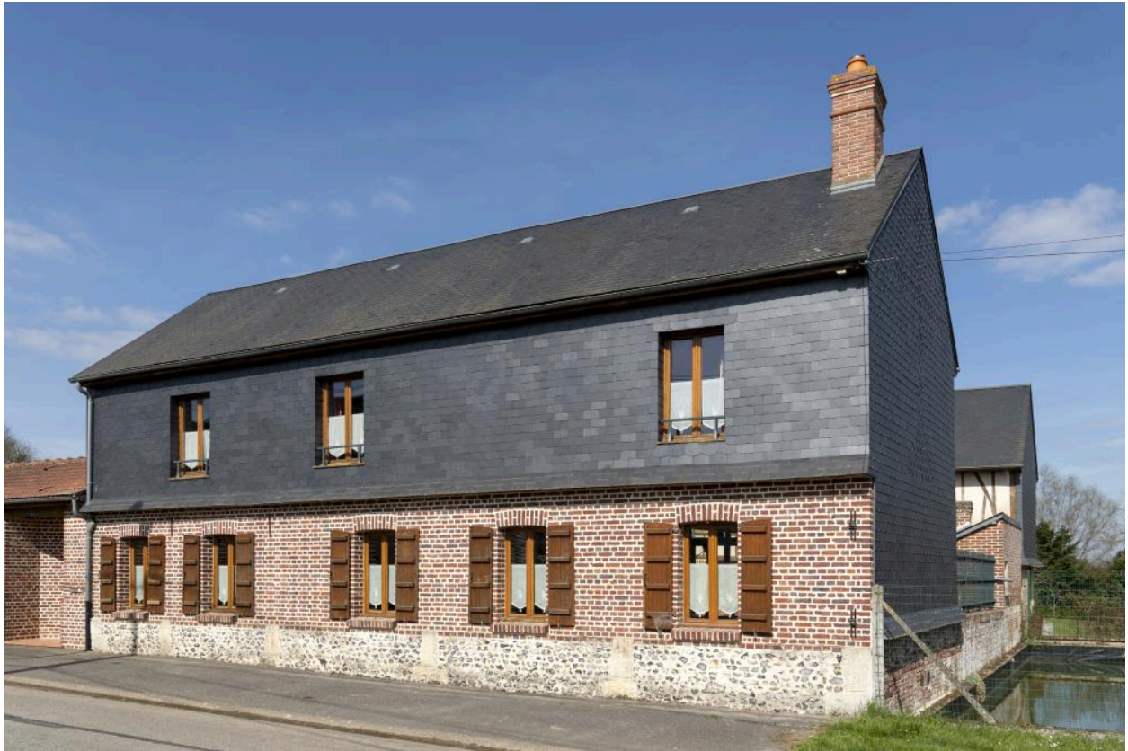
Logis sur rue avec essentage en ardoise et solin en moellons de silex et pierre de taille, n°4 rue Principale, vue depuis l'ouest.