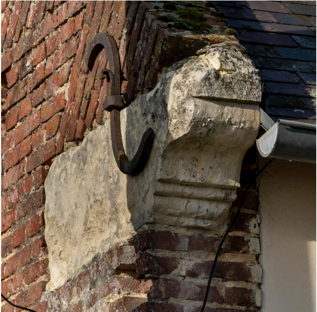
Détail du corbeau taillé en pierre, n°63 rue Principale.