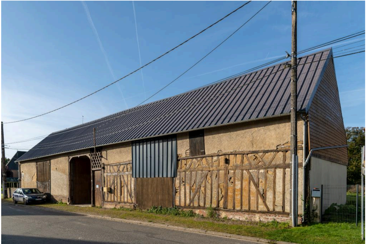
Grange, étable et passage charretier, n°51 rue Principale, vue depuis l'est.