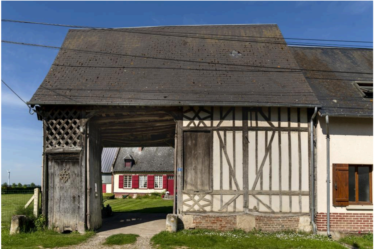
Grange sur rue de l'ancien presbytère avec un traitement ornemental des pans de bois, n°41 rue Principale, vue depuis l'est.