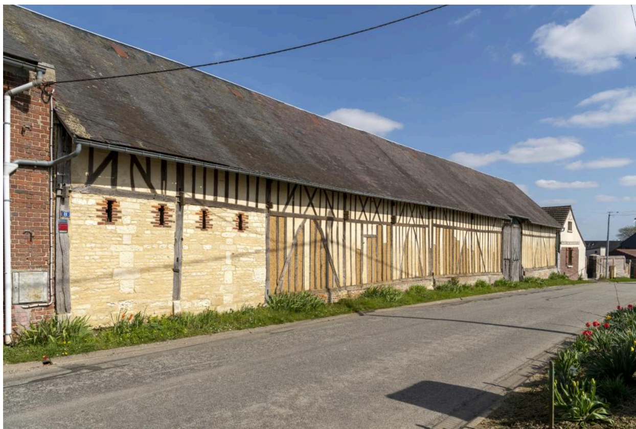
Étable (partie en pierre) et grange sur rue, 18e siècle (?), n°8 rue Principale, vue depuis le nord-ouest.