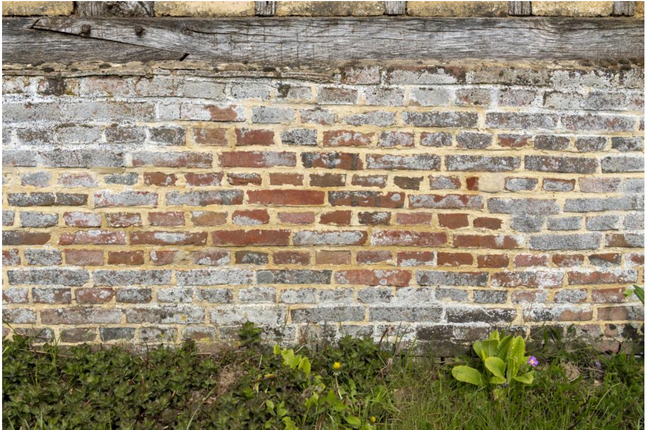
Solin en brique de la grange, n°8 rue Principale. L'irrégularité de grain, de ton et de forme des briques indiquent une construction antérieure au 19e siècle.