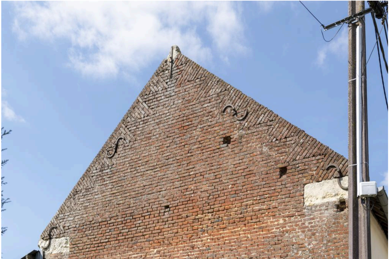
Pignon en brique avec couteaux picards, logis de l'ancien presbytère, n°41 rue Principale, vue depuis le nord.