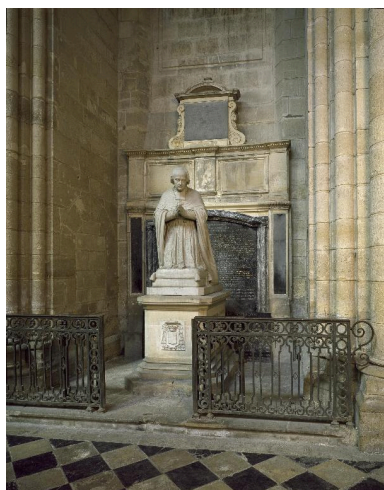
Vue générale de la chapelle réservée aux monuments commémoratifs des évêques défunts, précédée de sa clôture.

IVR22_20030200822VA