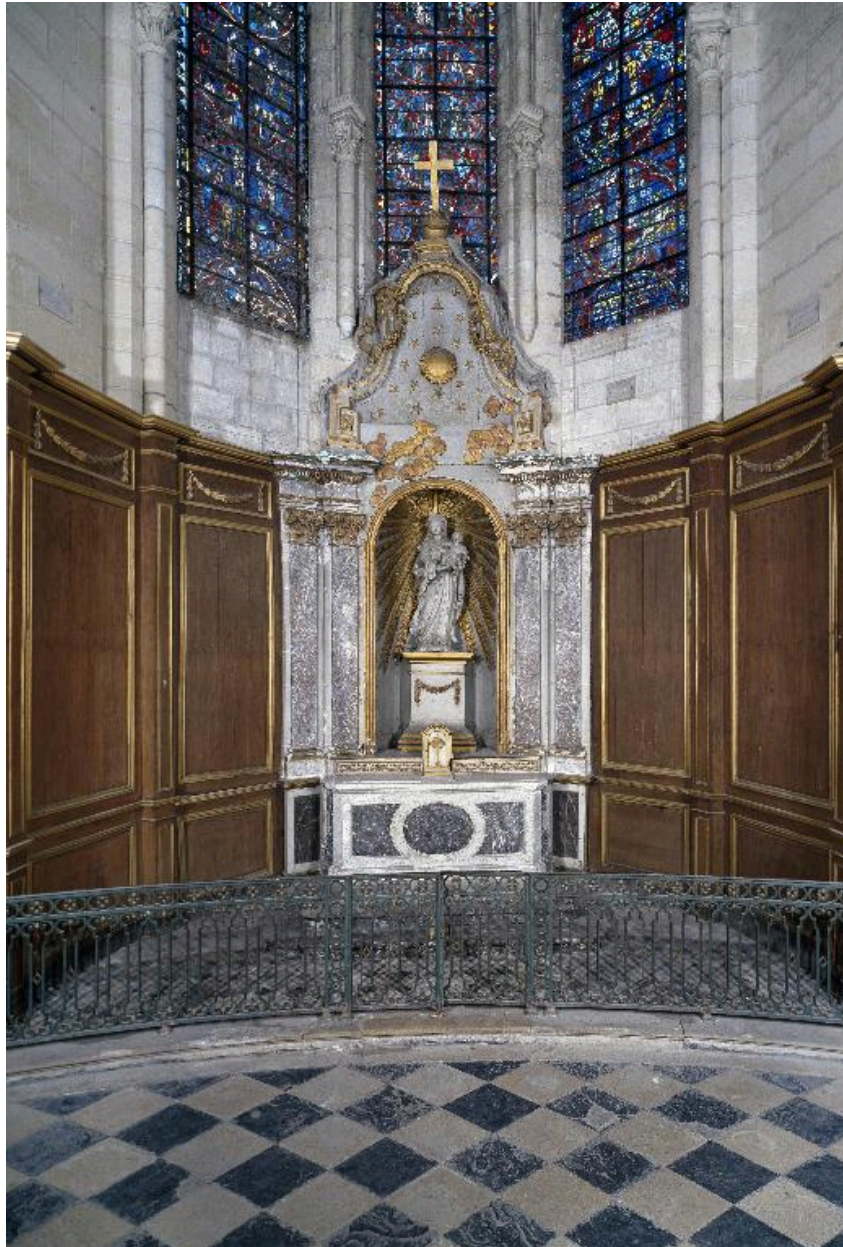
Vue générale de la chapelle axiale, précédée de sa clôture.