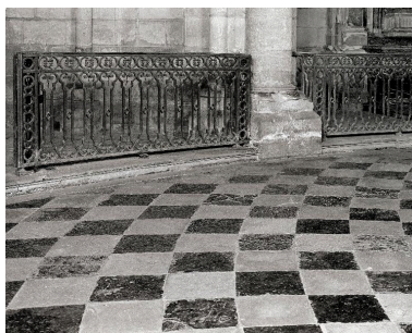
Vue partielle de deux clôtures.

Phot. Thierry Lefébure IVR22_19970200382PA