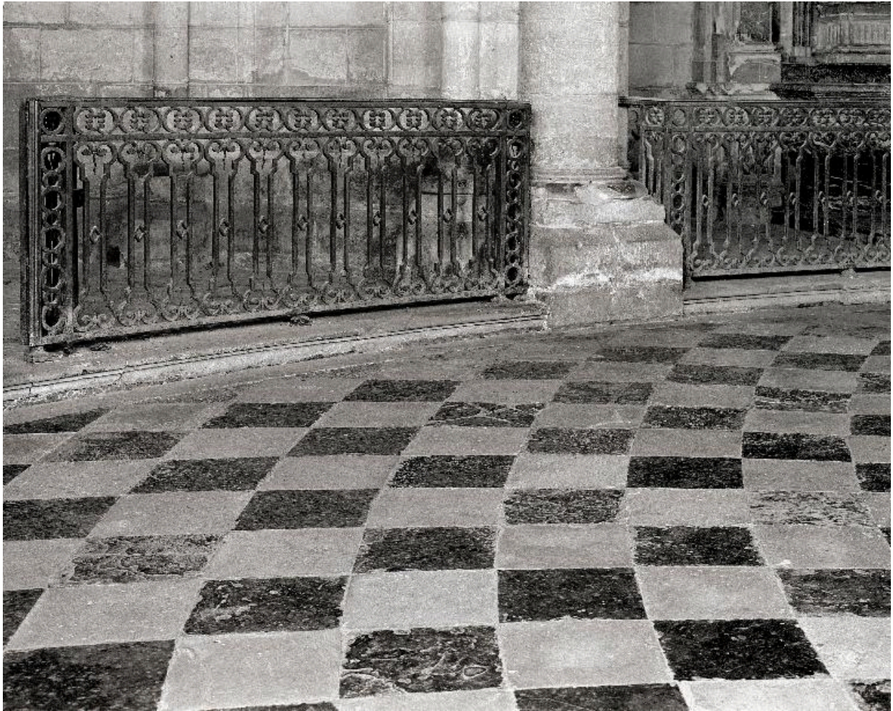
Vue partielle de deux clôtures.