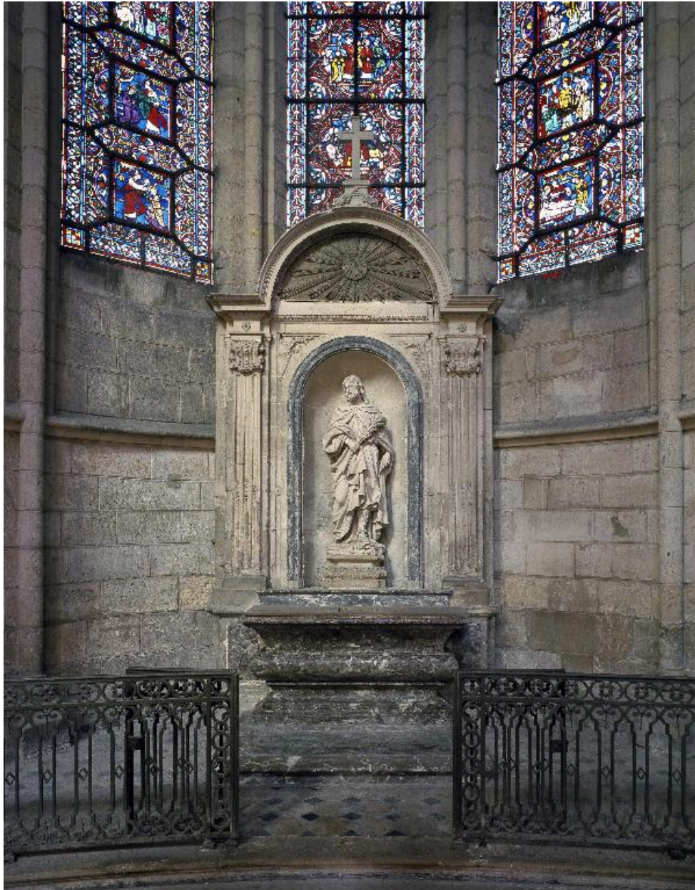
Vue de la chapelle Saint-Rufin, précédée de sa clôture.