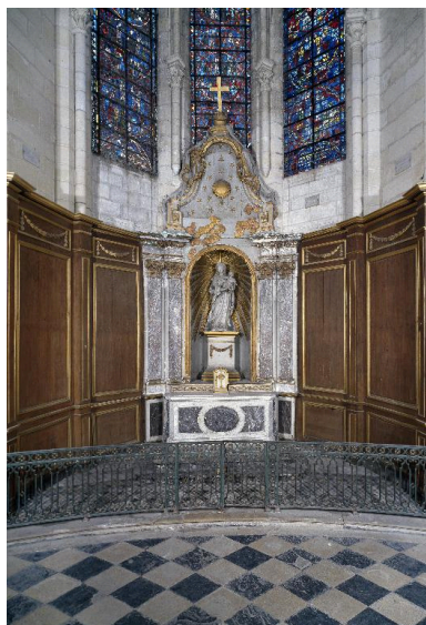
Vue générale de la chapelle axiale, précédée de sa clôture.

IVR22_19970200245VA