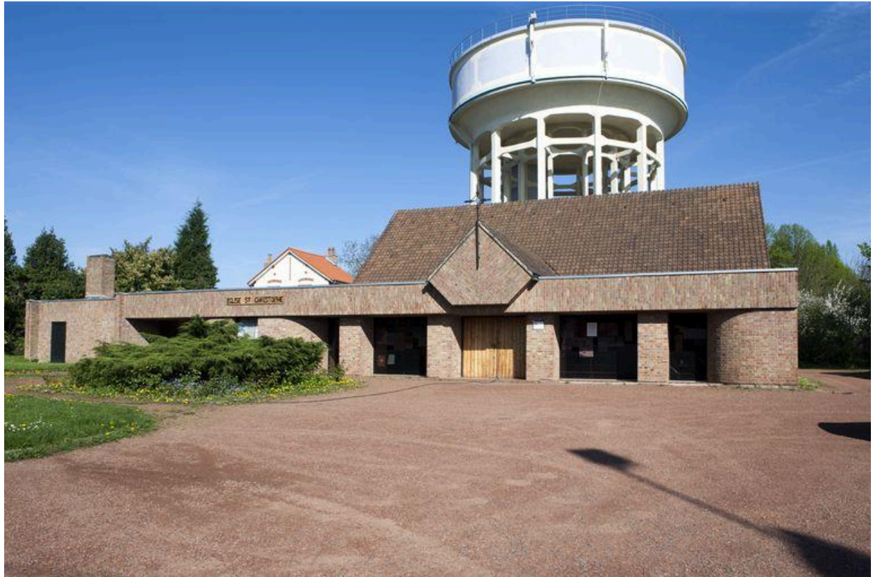
Élévation antérieure de l'église.