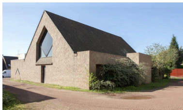
Élévation postérieure de l'église et flanc droit.