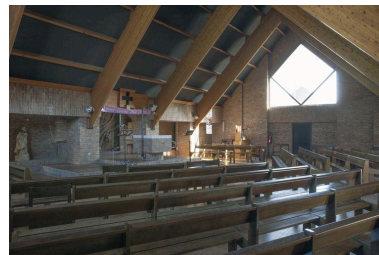
Vue du chœur et du flanc droit.