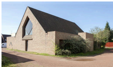
Élévation postérieure de l'église et flanc droit.