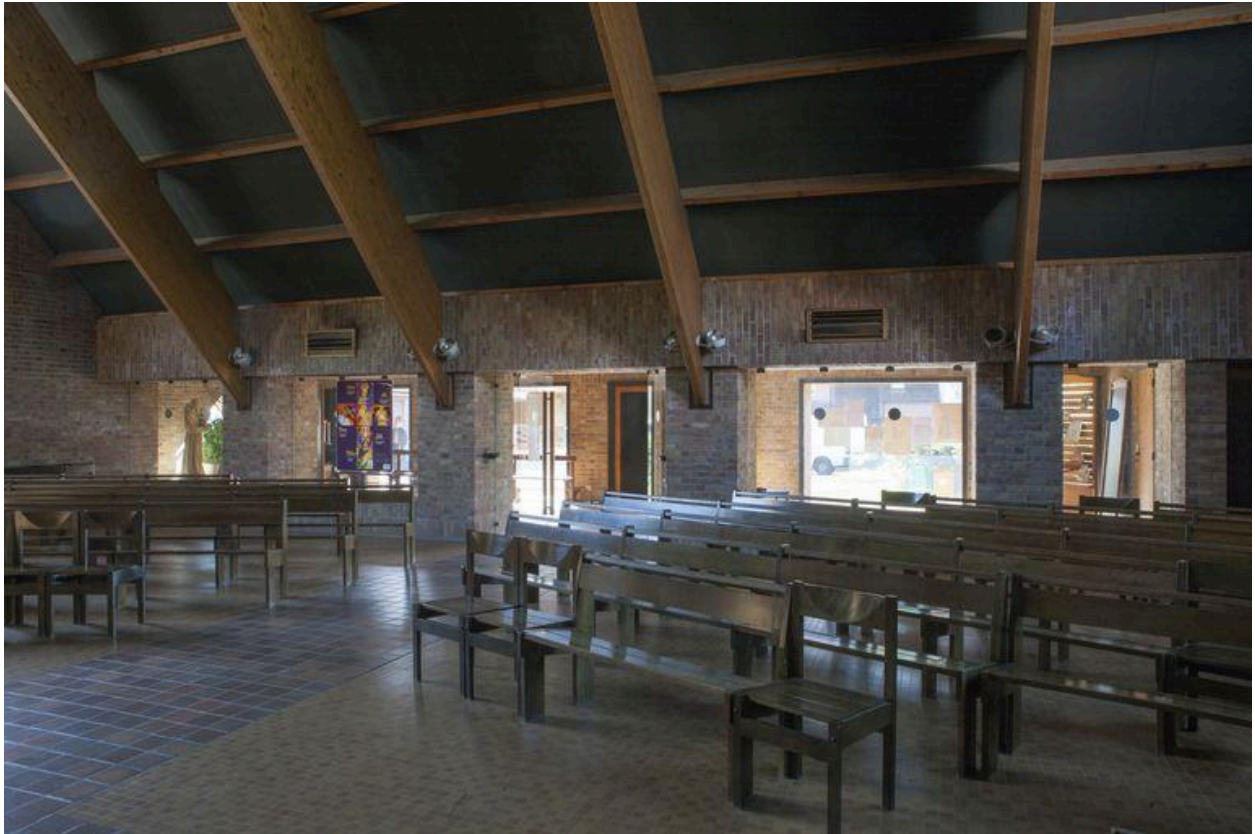
Vue de l'entrée de l'église.