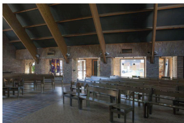
Vue de l'entrée de l'église.