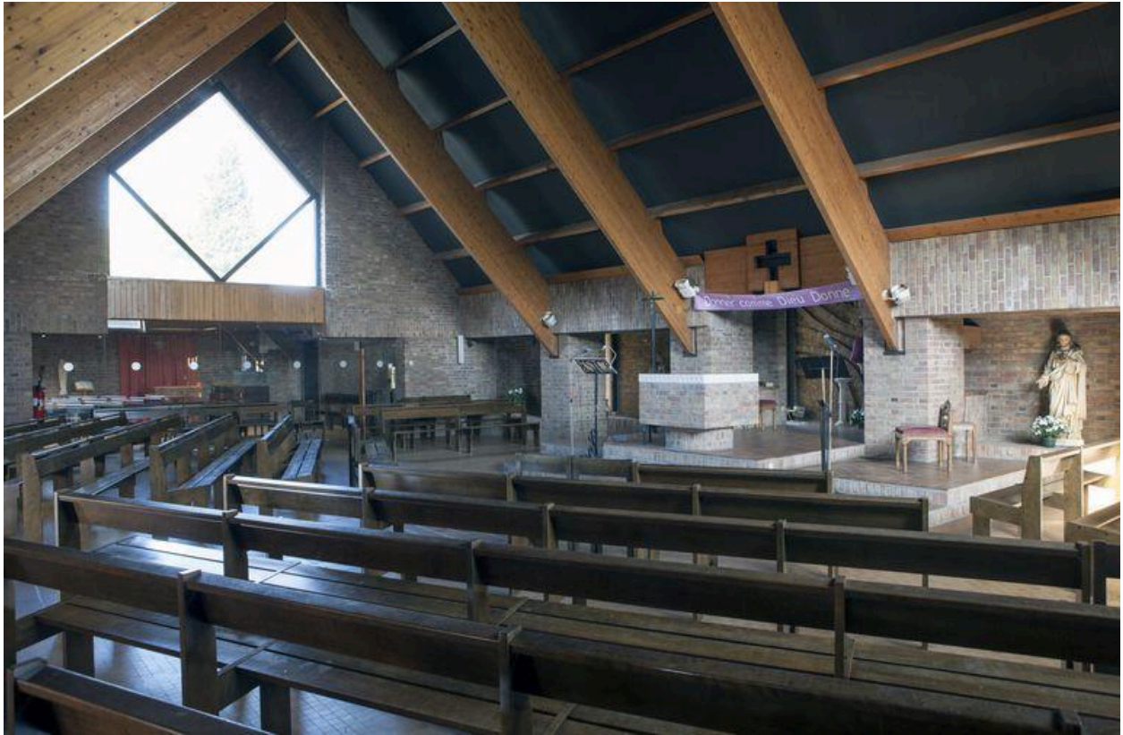
Vue du choeur et du flanc droit.