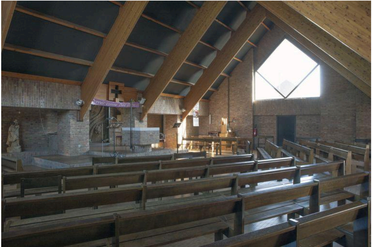
Vue du choeur et du flanc droit.