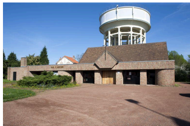
Élévation antérieure de l'église. IVR31_20155900653NUCA