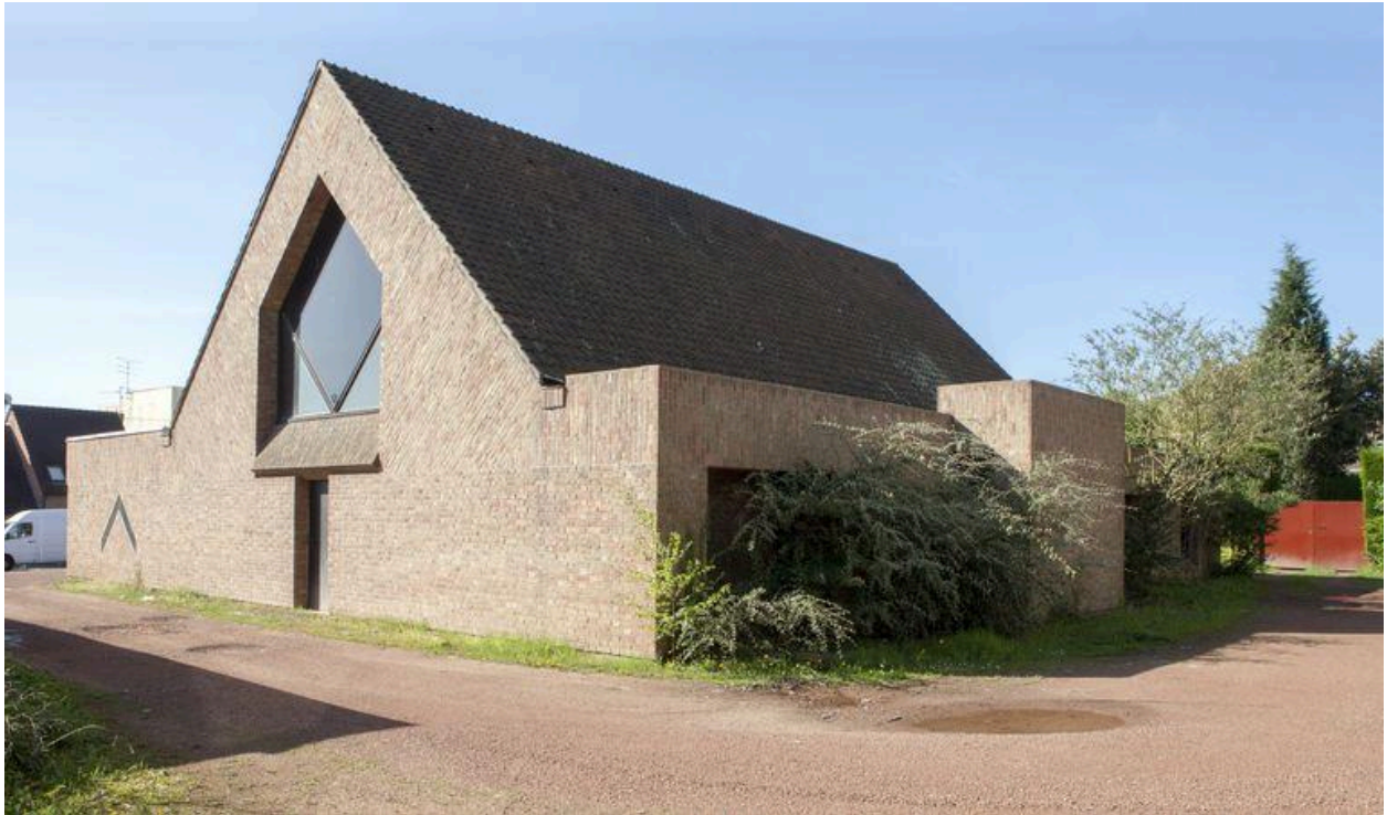
Élévation postérieure de l'église et flanc droit.