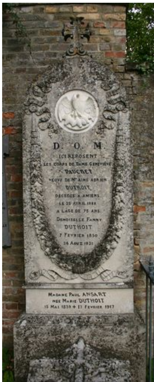
Stèle funéraire de Geneviève Pauchet.