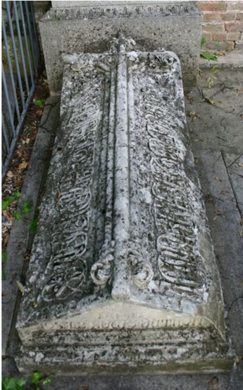
Tombale du monument de Louis Joseph Duthoit.