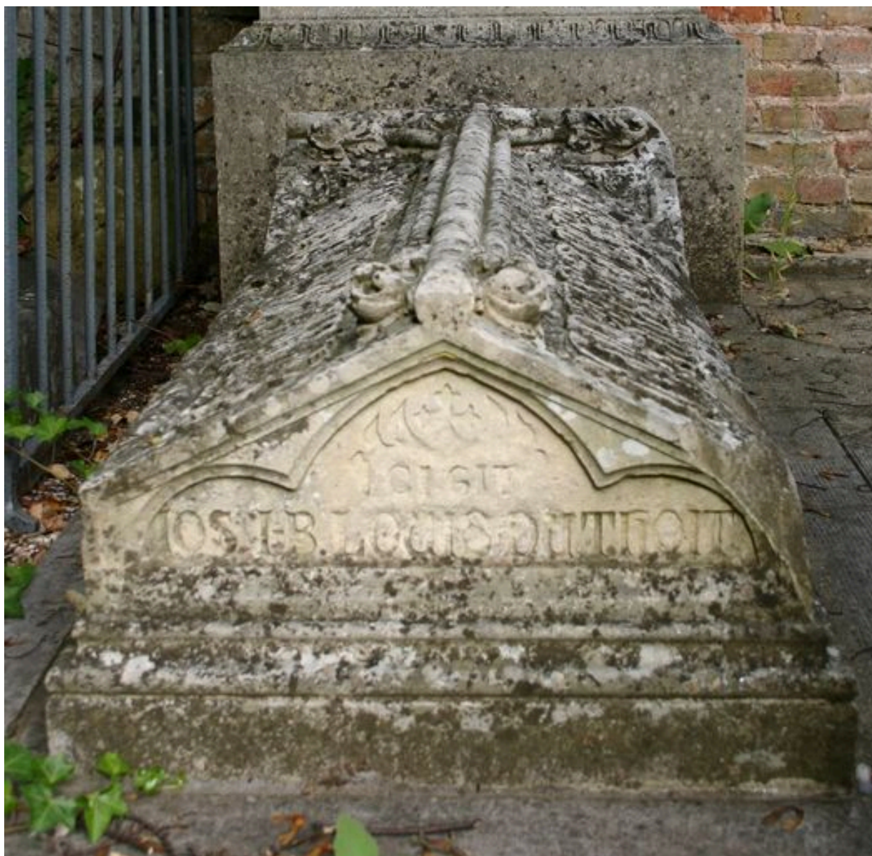
Détail du tombeau de Louis Joseph Duthoit.