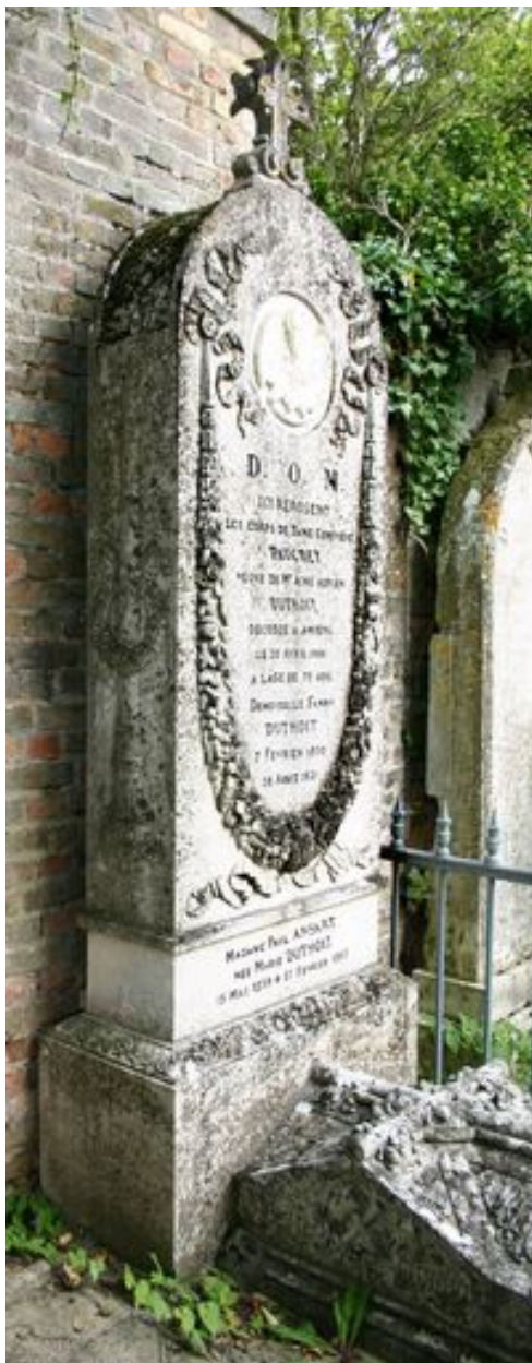
Stèle funéraire de Geneviève, vue de trois-quarts.