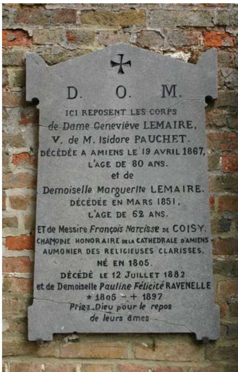
Stèle d'applique, vers 1867.