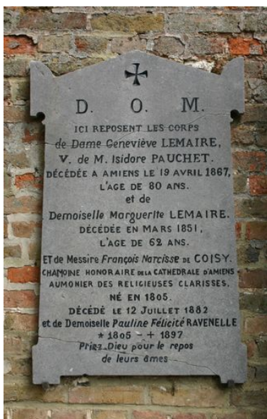
Stèle d'applique, vers 1867.