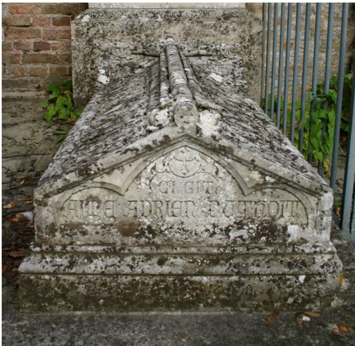
Détail du tombeau d'Aimé Adrien Duthoit.