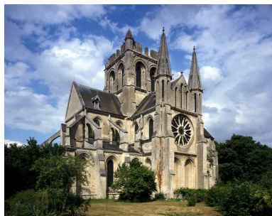
Vue de l'élévation sud. IVR22_20030203313VA