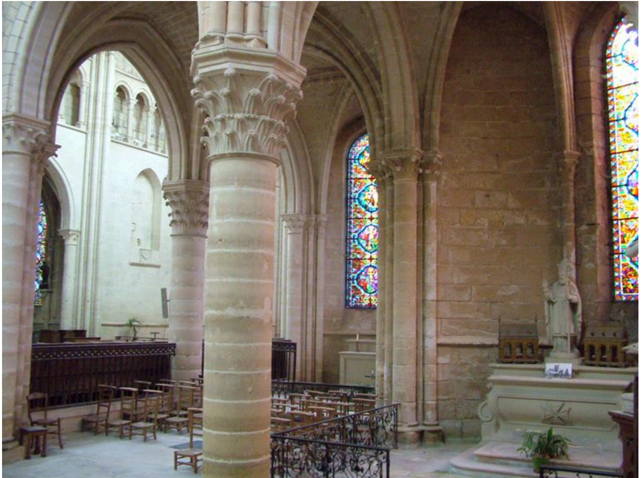
Vue des chapelles à 45° sud.