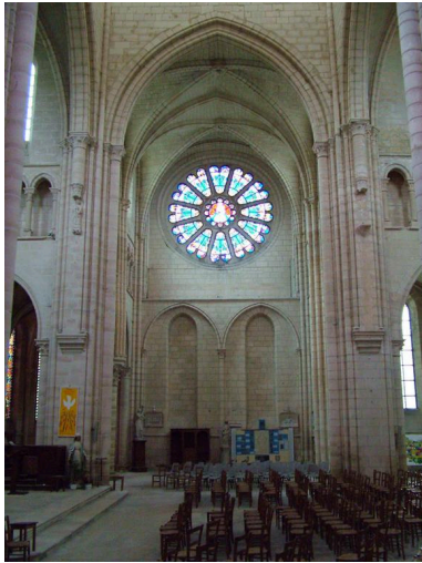
Vue du bras sud du transept.