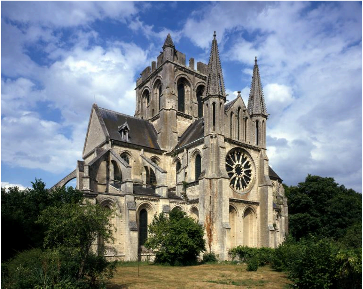
Vue de l'élévation sud.