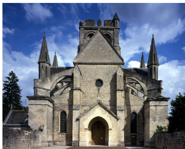
Vue de la façade occidentale et moderne. IVR22_20030203314VA