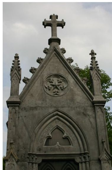
Vue rapprochée de la partie supérieure du tombeau-chapelle.