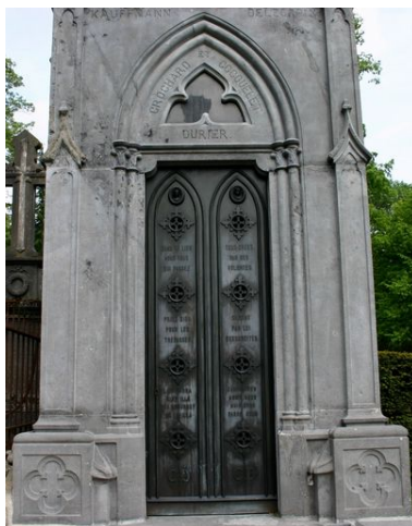
Vue rapprochée de la partie inférieure du tombeau-chapelle.