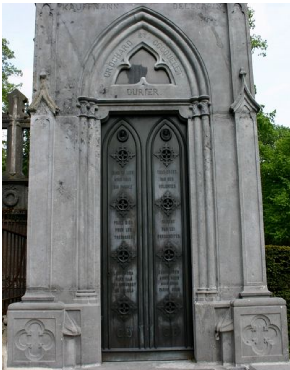
Vue rapprochée de la partie inférieure du tombeau-chapelle.