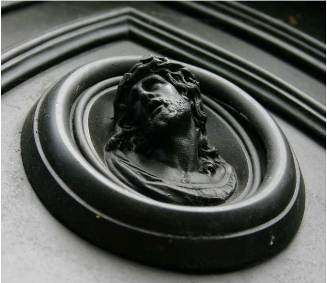
Vue de détail sur le médaillon représentant le Christ.