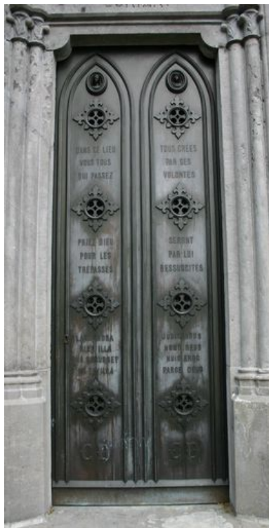
Détail de la porte en fonte.