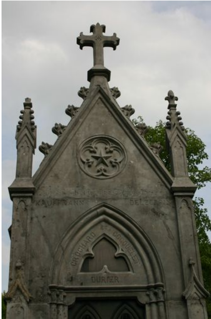
Vue rapprochée de la partie supérieure du tombeau-chapelle.