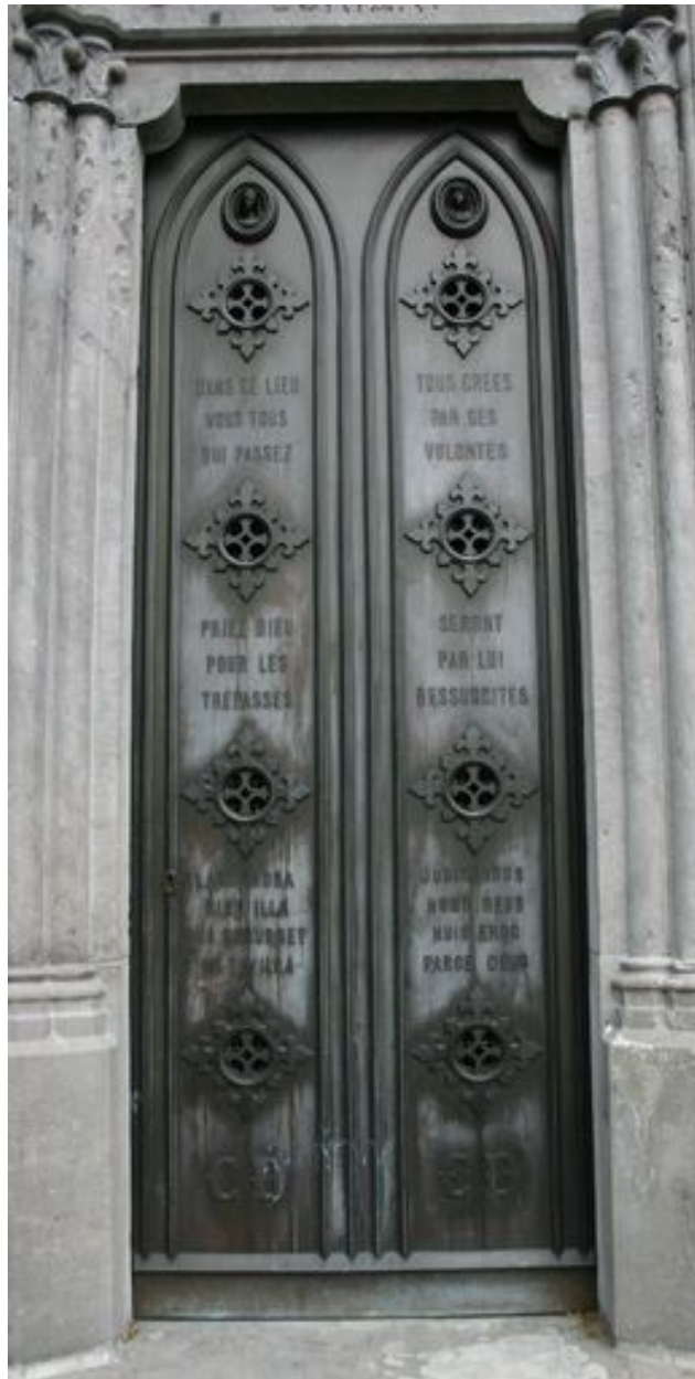
Détail de la porte en fonte.