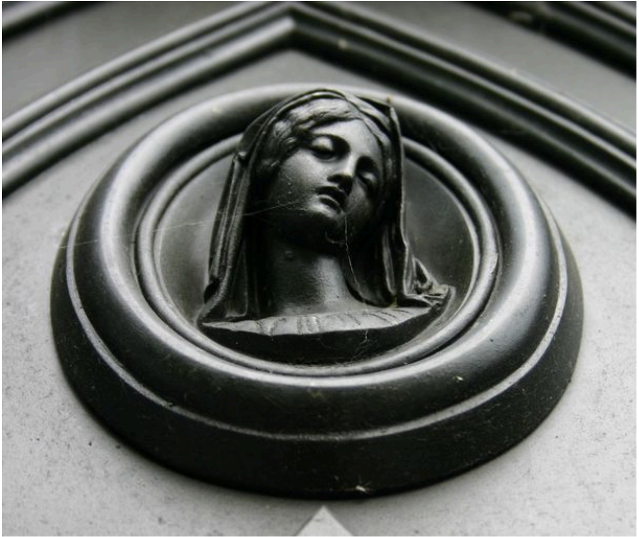
Vue de détail sur le médaillon représentant la Vierge.