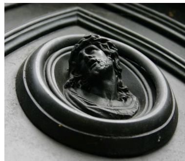
Vue de détail sur le médaillon représentant le Christ. IVR22_20078000788NUCA