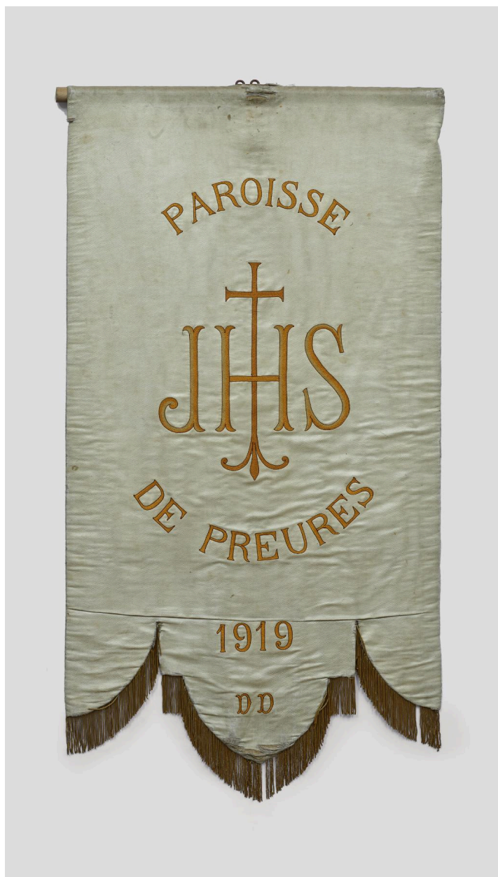
Bannière de procession (n°2), verso.