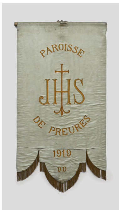
Bannière de procession (n°2), verso.

IVR32_20236200531NUCA