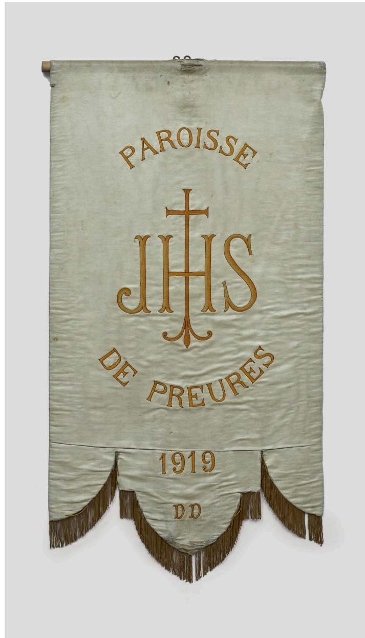
Bannière de procession (n°2), verso.