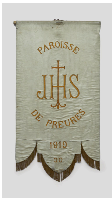
Bannière de procession (n°2), verso. IVR32_20236200532NUCA