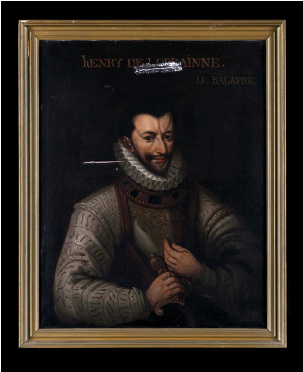
Vue du tableau représentant Henri 1er de Lorraine, duc de Guise.