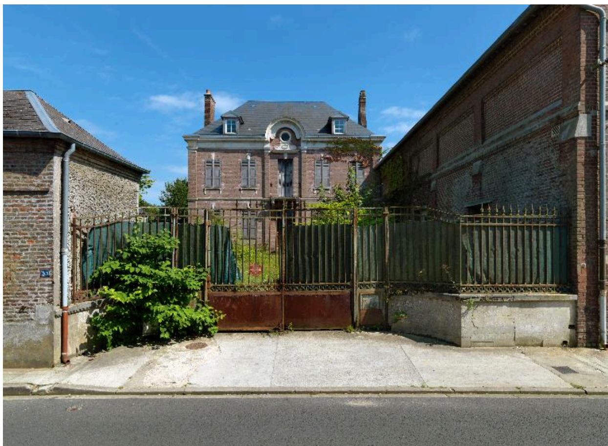
Vue depuis la rue Jean-Catelas de l'ancien logement patronal de M. Beauvisage.