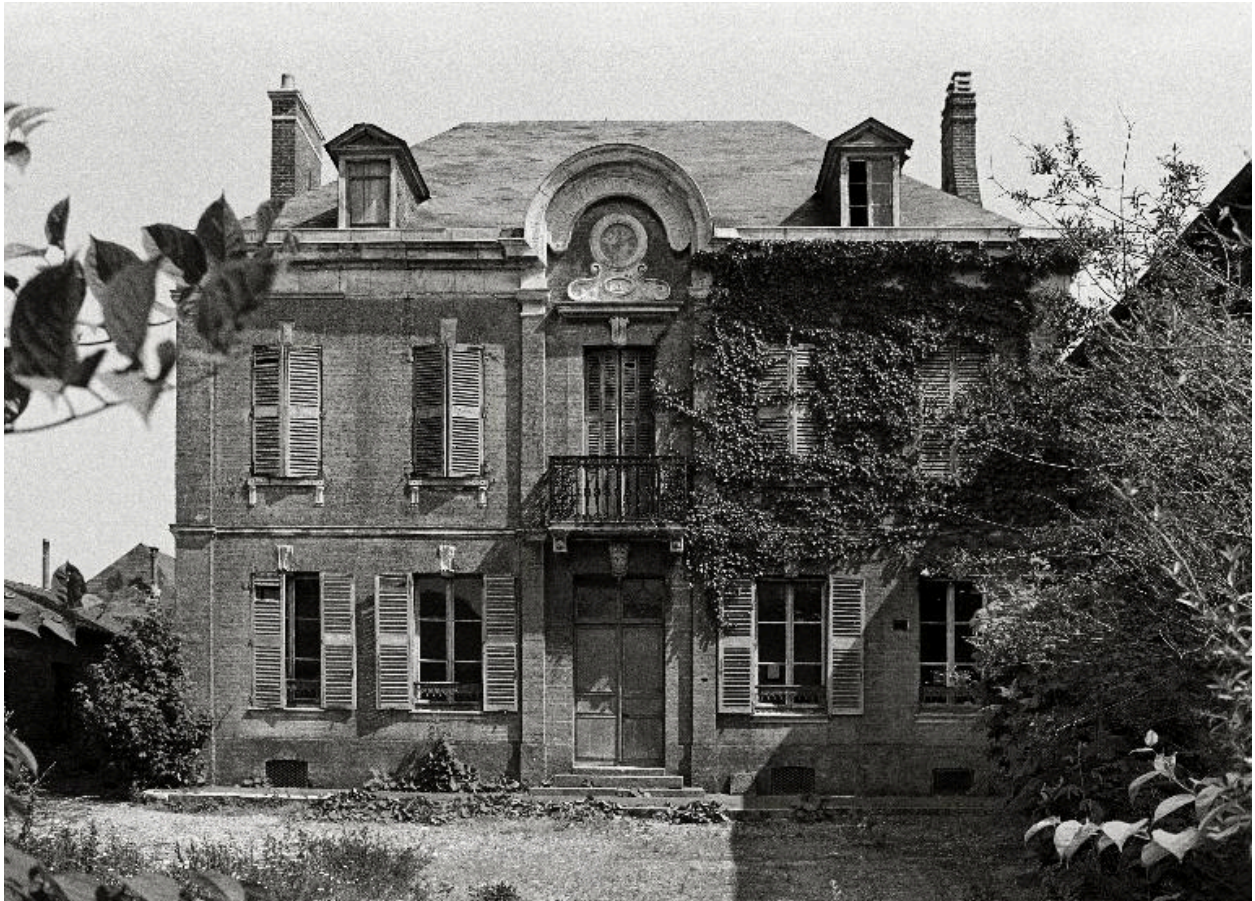
Vue générale, en 1990.