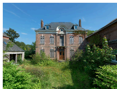
Vue générale. IVR22_20148000434NUC2A