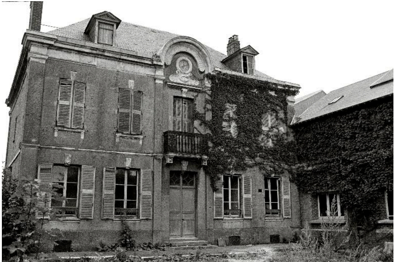
Vue générale, en 1990.