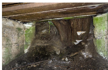
Sortie de la chambre de tir, vers le nord, depuis l'intérieur