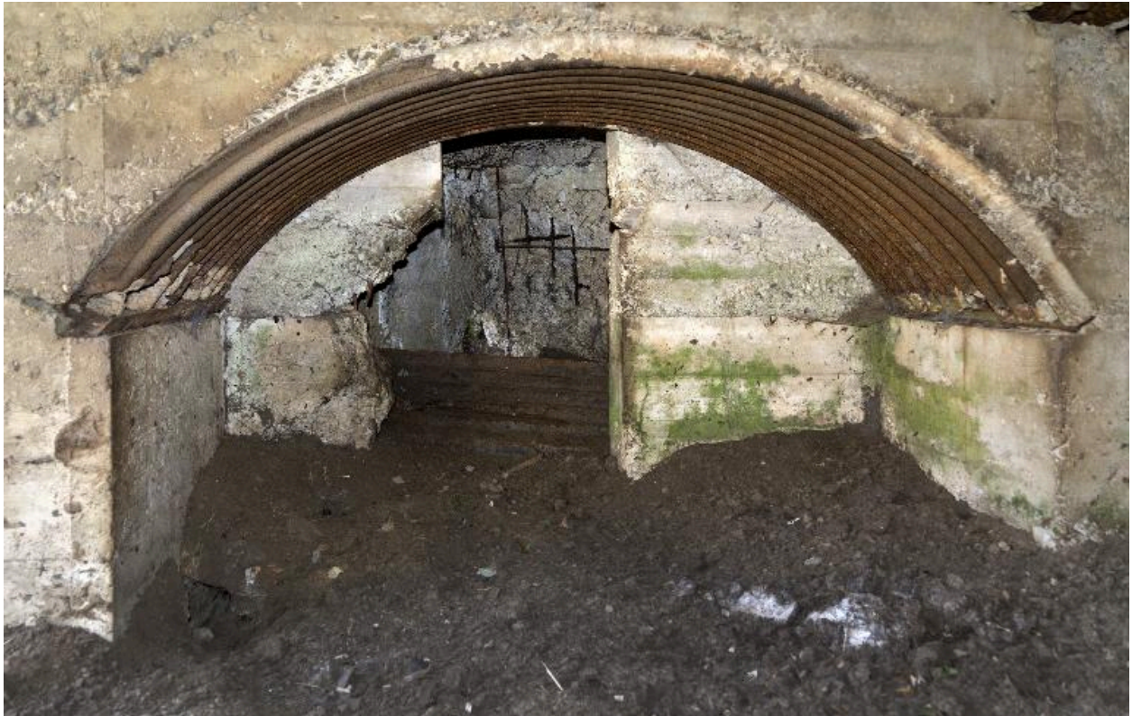
Depuis la chambre de tir, une des deux salles latérales (ouest)