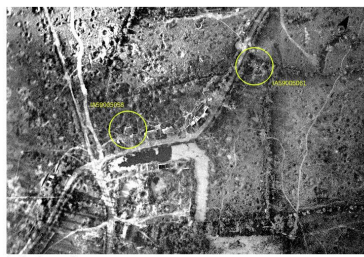
Position de l'édifice (cercle du haut) sur une photographie aérienne britannique du 12 sept. 1918 IVR32_20175901095NUCA