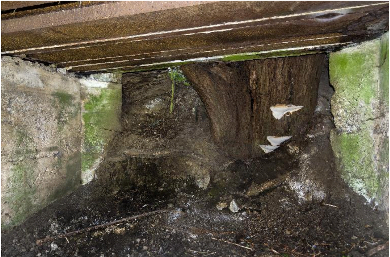
Sortie de la chambre de tir, vers le nord, depuis l'intérieur