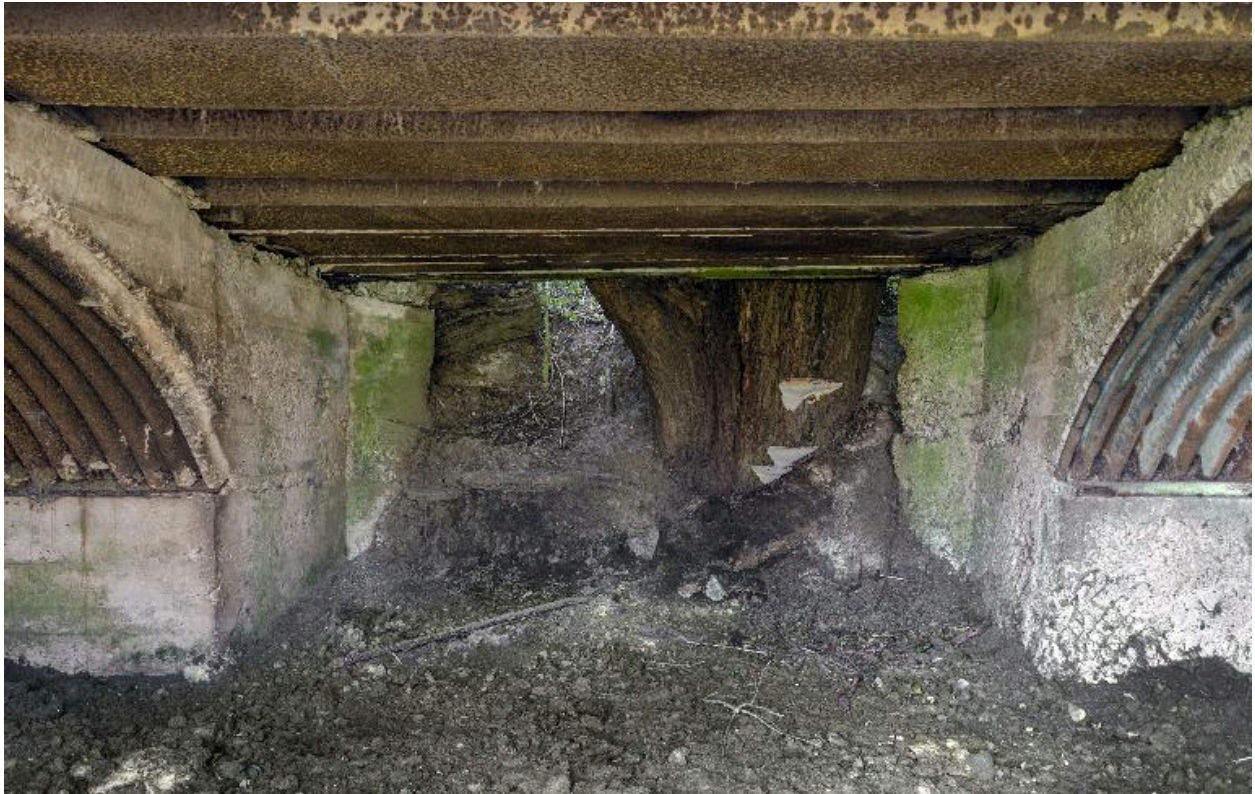
Intérieure de la chambre de tir, vers le nord