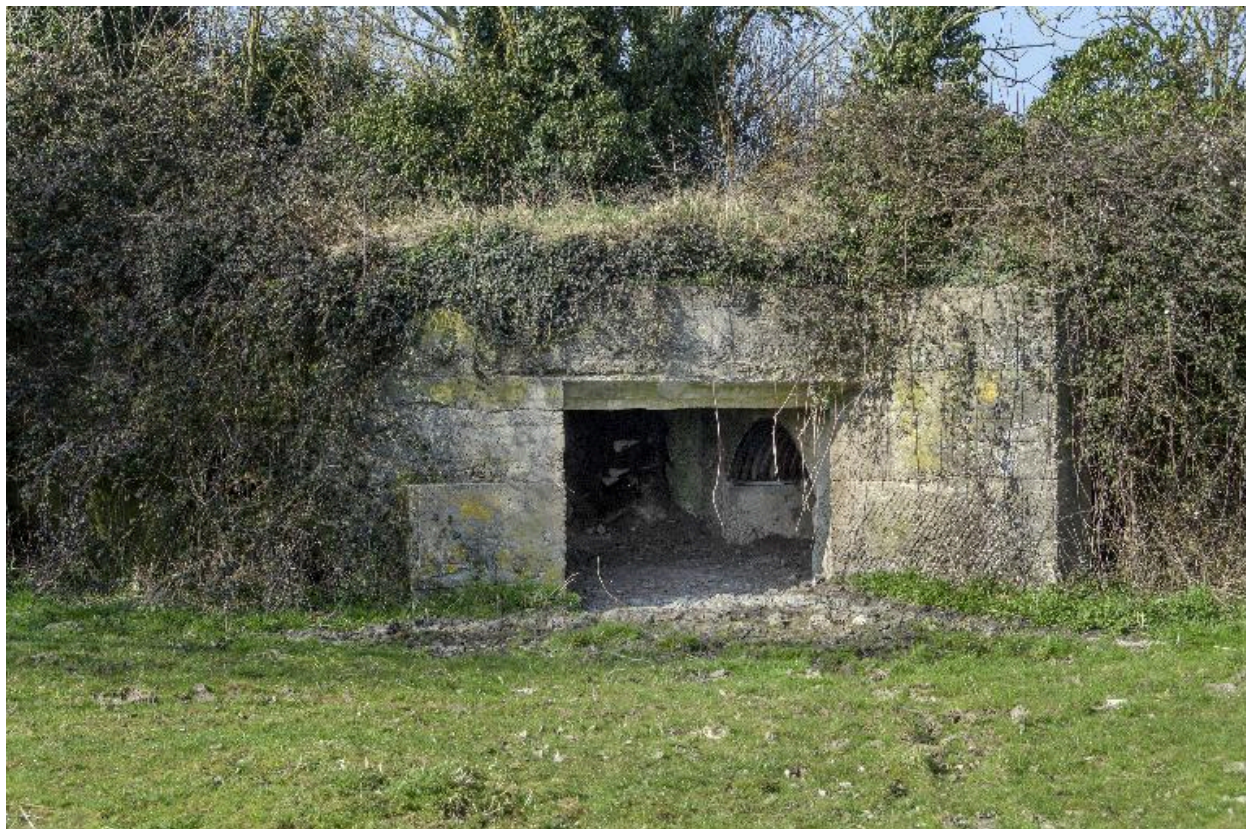
Elévation sud, entrée du canon