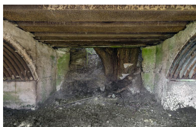
Intérieure de la chambre de tir, vers le nord IVR32_20165901003NUCA