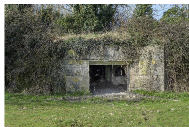
Elévation sud, entrée du canon IVR32_20165901000NUCA