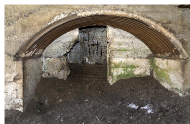
Depuis la chambre de tir, une des deux salles latérales (ouest) IVR32_20165901001NUCA