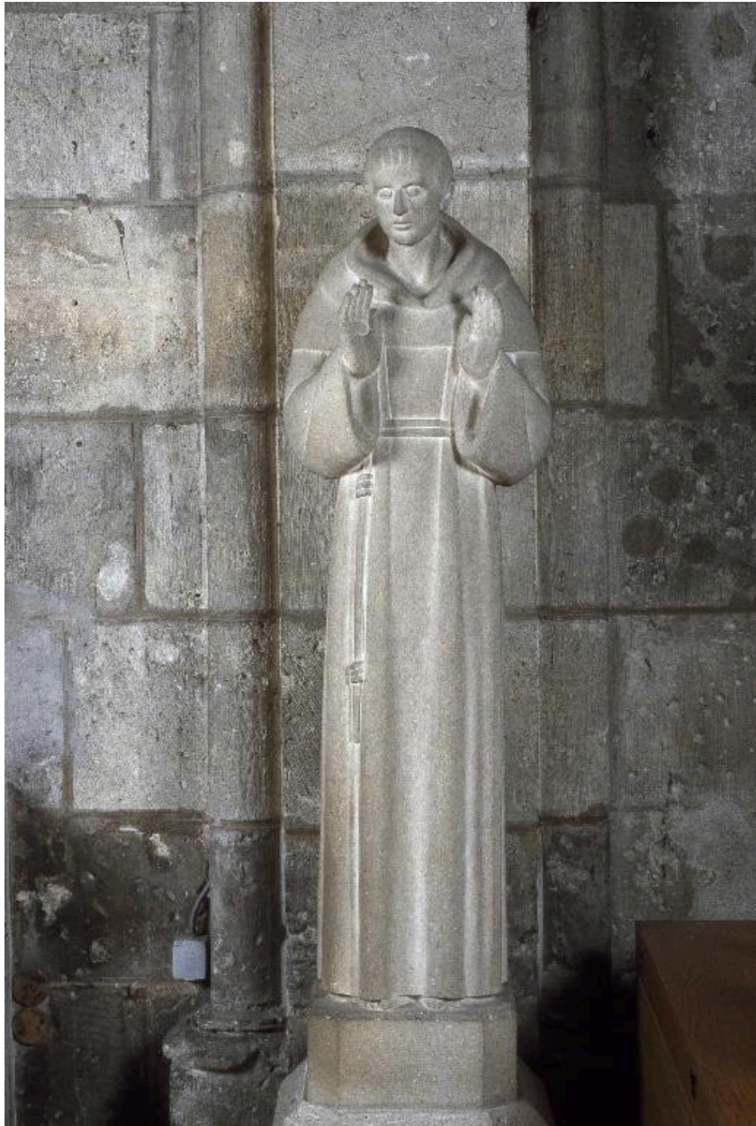
Statue de saint François d'Assise : vue générale.