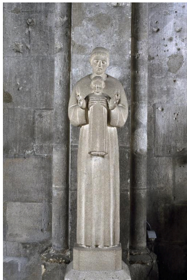
Statue de saint Joseph avec l'Enfant Jésus : vue générale. IVR22_20010202556ZA