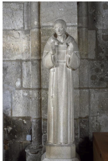
Statue de saint François d'Assise : vue générale. IVR22_20010202557ZA