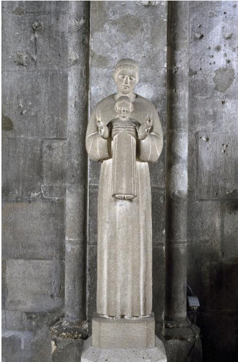
Statue de saint Joseph avec l'Enfant Jésus : vue générale.