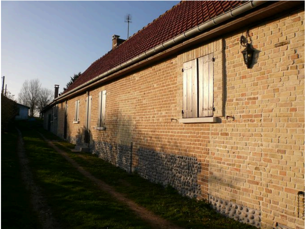
Vue détaillée de la partie habitable.