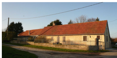
Vue générale. IVR22_20058006386NUCA