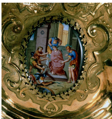
Vue de détail d'un médaillon sur le pied : la Dérision du Christ.